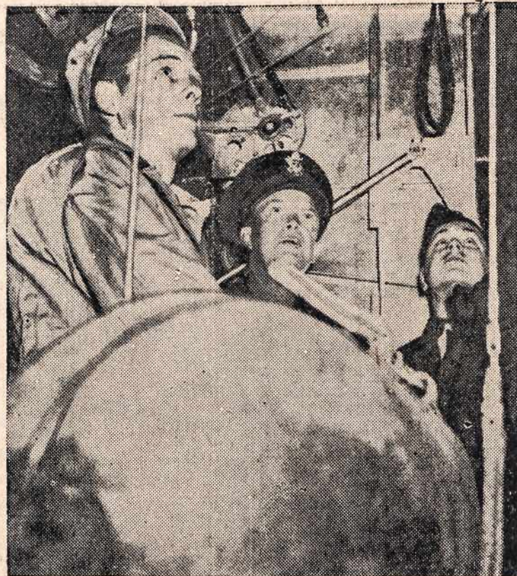
Gen. Eisenhower (vidury) seka eiga didžiosios bombos, kuri buvo paleista iš bomberio į jūros įlanką, kur nors Anglijoj.

P. S. BALF statutą ir apie skyrių organizavimą parašysime vėliau. Valdyba.