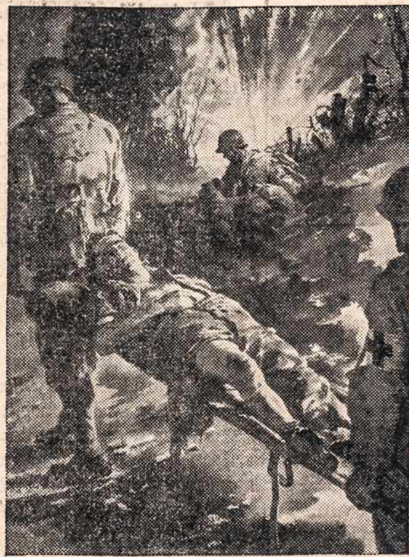
...Ask that kid on the stretcher!