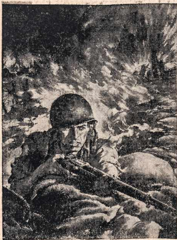
...Ask the Joes in the front lines!