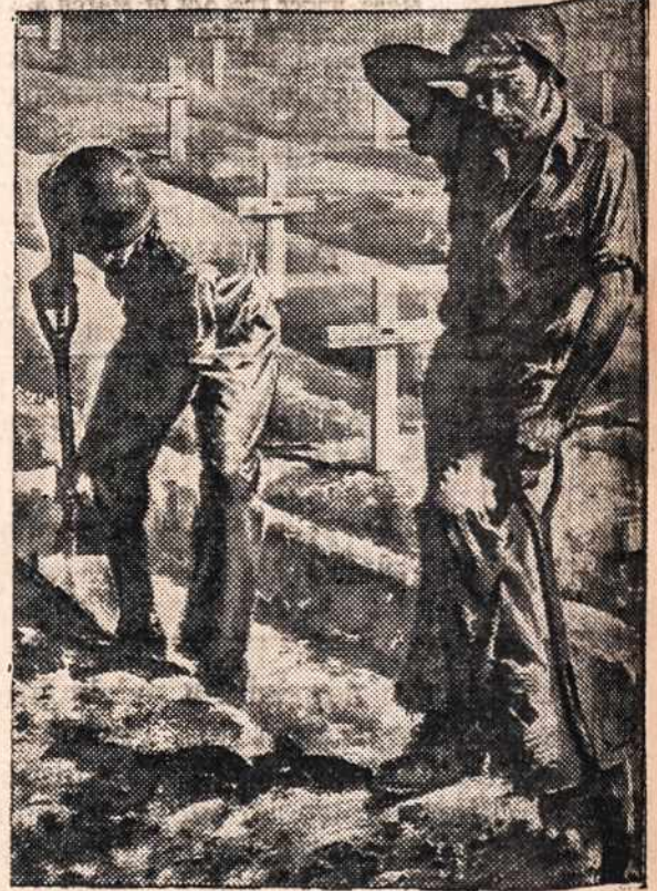
...Ask those who bury our dead!

THEY KNOW. Every G. I. Joe knows. "This is the big show. This is the pay-off. This is the one that counts. "Sure, we're going to take 'em. But it's going to cost us plenty . . . thousands and thousands of lives . . .