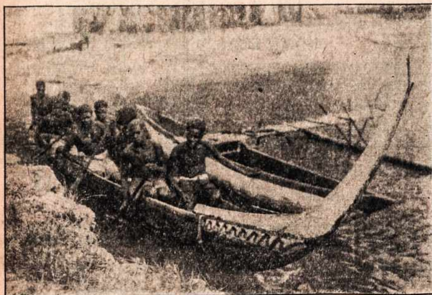
Negrai dideli ežerų mėgėjai.

Bet kadangi Jo yra tokia valia, kad būčiau maža ir darbuočiau mažyčių tarpe, tad nieko daugiau ir nebenoriu.