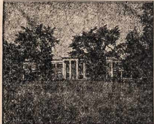
Marianapolio Kolegijos Rūmai

Tai vienintelė mokykla lietuviams berniukams šiame krašte. Ji buvo įsteigta 1923 metais ir jau yra išleidusi daugiau kaip 1100 mokinių.