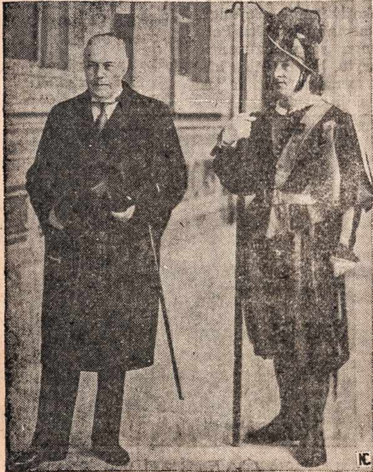
Amerikos atstovas Vatikane Myron C. Taylor su Popiežiaus Gvardijos kareiviu.

Vienos arkiv. Dr. A. Grušai esant dar vaiku buvo toks atsitikimas. Grįždamas iš pradžios mokyklos, jis sustojo su kitais berniukais prie šv. Stefano bažnyčios. Iš bažnyčios išėjo zakristijonas ir paprašė vaikų eiti patarnauti šv. Mišioms. Mažasis Grušukas pirmas pasipiršo. Kada jis po šv. Mišių ėjo iš zakristijos, atsi-klaupė prie altoriaus, kur buvo švė. Sakramentas, ir karštai pasimeldė: "Gerasis Dieve! Aš noriu visada Tau tarnauti. Aš prašau Tave padaryti mane kunigu". Vaikiuko malda buvo išklaudyta. Jo gerasirdis dėdė kunigas išleido jį į gimnaziją. Gerai baigęs gimnaziją, 18-tais amžiaus metais jis įstojo į kunigų seminariją. Į kunigus iššventė 23-čiais amž. metais (1843). Paskum jis pasiekė ir kardinolo laipsnį.