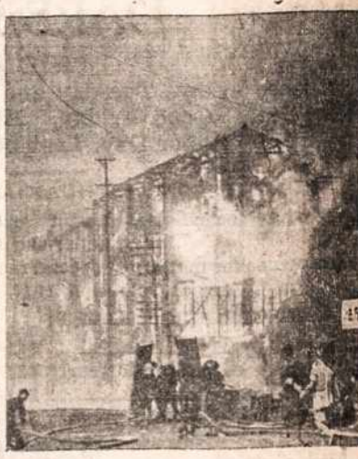
Karo metu liepsnose dingsta didingi rūmai ir vargingos lušnelės.

(Galas) Didesnei Dievo garbei! Kl. Jonas Bernatonis.