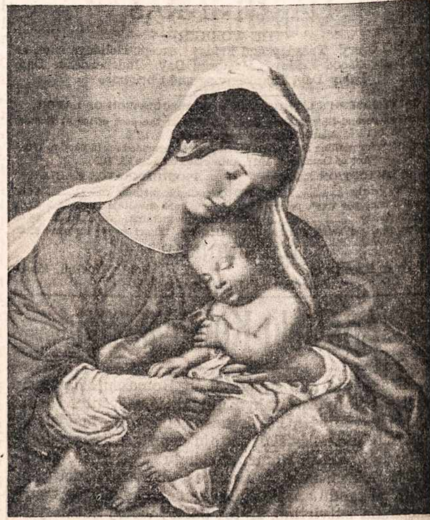
Motina Gailestingoji, globok mūsų tėvų žemė, Lietuvą!

nai ir kitokiomis. Papuošimas gaubtuvo buvo tik apie galvą, iki smilkinių. Iš po gaubtuvo truputį išsikišę plaukai tamsiai geltoni, perskirti per kaktą, truputį garbanuoti nusileidę dešiniu šonu žemiau juostos. Veidas skaisčiai gražus, labai malonus, truputį liūdnas. Ant Marijos galvos — šviesi, iš 12 žvaigždžių aureolė, nuo žvaigždžių ėjo stulpais spinduliai, sklisdami vis platyn vaivorykštės spalvomis. Ant kairiosios rankos laikė kūdikį apie 1 metų amžiaus. Jo rūbai taip pat balti, kaip Marijos. Jo kojeles Marija laikė pridengusi savo gaubtuvo kraštu. Kūdikėlio veidelis labai malonus ir gražus, plaukai šviesiai