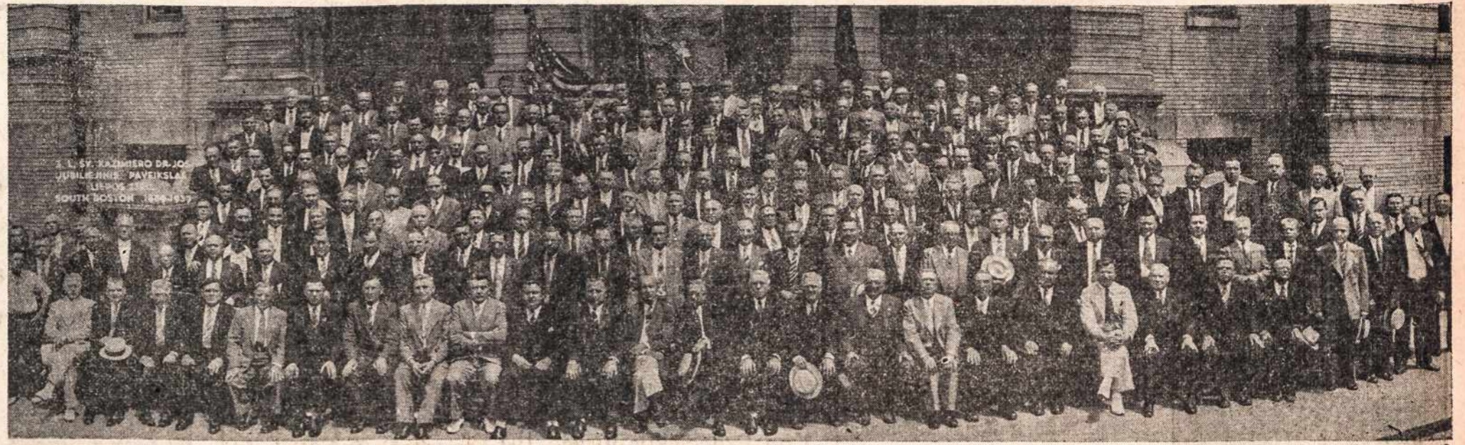
SUS. LIETUVIŲ ŠV. KAZIMIERO DRAUGIJA, SO. BOSTON, MASS., suorganizuota liepos 4, 1889 m. ši draugija nutarė dalyvauti Naujos Anglijos Lietuvių Konferencijoje — parade — pamaldose ir sesijoje, ir paaukavo $25.00 Amerikos Lietuvių Tarybos reikalams. Tą pačią dieną draugija minės savo 55 gyvavimo metų sukaktį. (Šis paveikslas imtas 50 gyvavimo metų Jubiliejaus proga, liepos 23 d., 1939 m., prie Bigelow mokyklos, E St.)

Už savaitės parvažiuoja trumpoms atostogoms kareivis