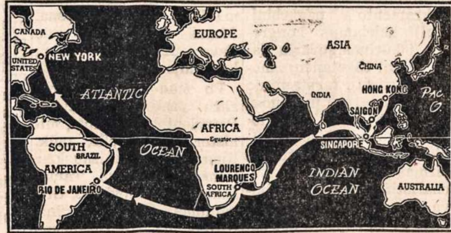
Išlaisvinti misijonieriai ilgai keliaudami sugrįžo į savo gimtąjį kraštą.

Šventasis Povilas stebina mus savo narsumu, išterme sunkiausiuose darbuose ir kantrybe kentėjimuose. Jisai nors nebuvo dvylikos apaštalu skaičiuje, tačiau ir jį, kaip kitus apaštalus, į Evangelijos platintojus patsai Kristus pakvietė. Kartu jis su apaštalais darbavosi, kartu už šv. tikėjimą kraują liejo, dėlto Katalikų Bažnyčia nuosėkliai jį vadina apaštalu. Šv. Povilas stačiai užkariavo Kristaus tikėjimui stabmeldžių tautas. Tūkstančiai tamsių žiaurių stabmeldžių girdėdami šventojo karštus pamokslus, matydami jo išmintį, jo dorą šventą gyvenimą, tapo pavyzdiniais krikščionimis. Vadinamas yra jįsai prakiliu vardu "stabmeldžių apaštalas", o jo gyvenimas labai gražiai aprašytas knygoje, vadinamoje "Apaštalu Darbai".