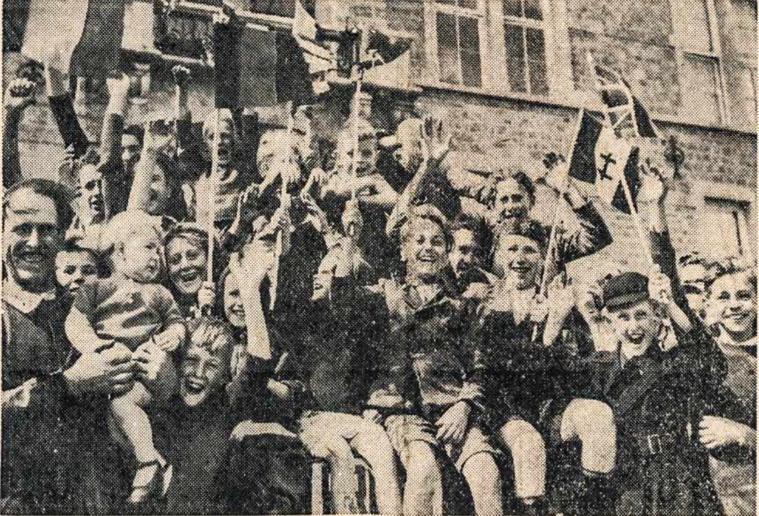
Belgai ir jų vaikai jau seniai žinojo, kad ateis valanda, kada draugingi amerikiečiai išlaisvins juos iš nacių vergijos. Ir štai žodis stojosi kūnu, — amerikiečiams žygiuojant per belgų miestelį Seloignes, belgai entuziastiškai sveikina išvadotojus.

DARBININKAS RADIO 366 W. Broadway, So. Boston 27, Mass. Tel. SOUTH Boston 2680 arba NORwood 1449.