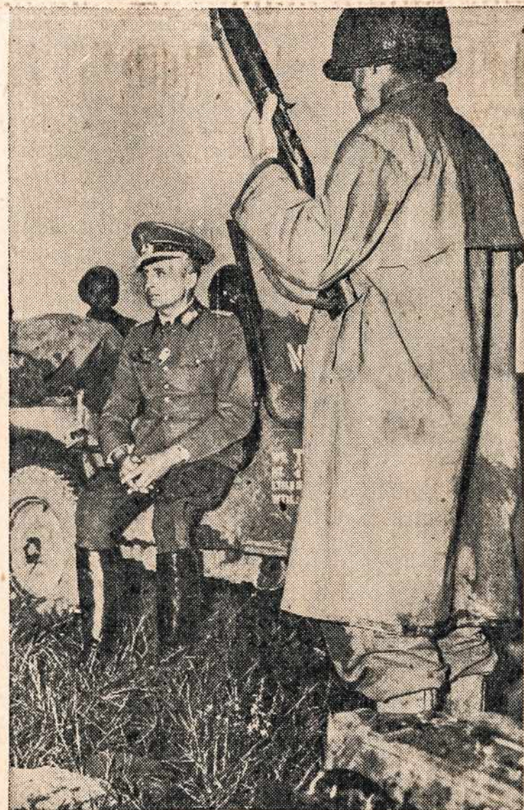
Dėdės Samo karys saugo pačiuptą fronte nacių generolą. Sakoma, kad tas generolas buvo ligi ašarų susijaudinęs, kaip jį netikėtai amerikiečiai pačiuupo jau nacių krašte. Štai kaip mažas eilinis karys 'bosauna' ant didelio 'pono'.

Žinoma, Jungtinėse Amerikos Valstybėse komunistai iki šiol vis laisvai veikdami, nėra atsiekę žymių rezultatų, nes Amerikos darbininkai daugelis turi savas nuosavybes ir yra susipratę. Vargu ar ką ypatinga komunistai ir ateity čia atsieks, bet jei susilauksime didesnių puolimų prieš Bažnyčią, prieš jos veikėjus komunizmui palankiuose laikraščiuose, leidiniuose, tai visgi žino-