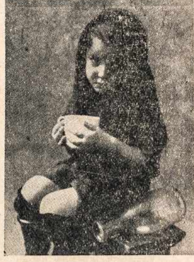
Nuoga, suvargusi nuo karo nukentėjusį brolių ar sesė užjaučianti ir jam ištieti pagalboms ranka, yra mielaširdingas darbas ir didžiausias artimo meilės aktas. Lai ir tavo širdis tą meilę pažįsta!