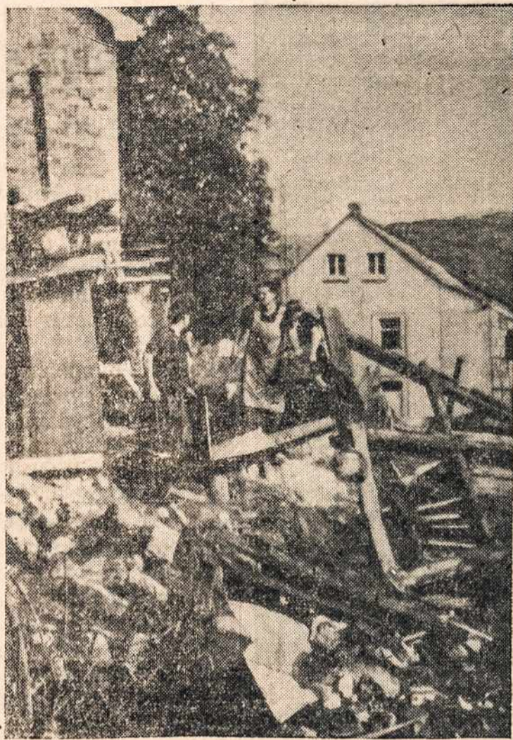
Sis vaizdas tai Vokietijoje. Ir ten jau karas atnešė griuvėsius ir štai dvi vokietės peržiūrinėja gražiųjų namų krūvas griuvėsių.

— Taip? Bet aš turiu dar daug laiko kalėjime, kol