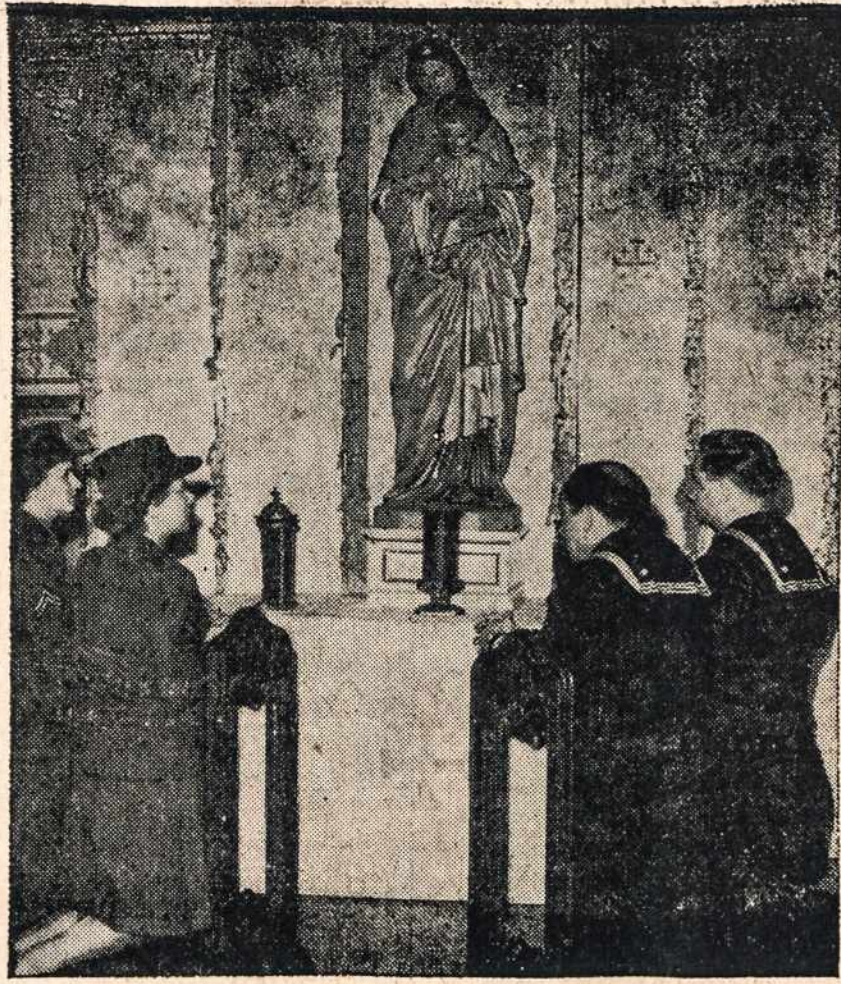
Amerikos kariai meldžiasi prie Šv. P. Marijos prašydami pergalės, taikos ir laimingo sugrįžimo.

Tačiau sunkūs vadų uždaviniai su šiuo karu nepasibaigs. Jau dabar jie reiškiasi nepertoliausiam akvraty. Stambiausia problema ta Rusija. Ji sudaro milžinišką klausuką (klausimo ženklą) visoj eilėj pačių svarbiausių būsimos Europos klausimų. Bolševikija įsivėlė visur ir mina ant kojų visiems. Pasak anglų spaudos, kyla štai kokie klausimai, kuriuose rusų interesai pareina į kelių kitų tautų interesams. Pirmiausia, susidūrimas britų ir rusų interesų Balkanuose. Tai tradicinė anglų politikos dirva. Britai niekam čia neleidavo kištis. Toliau, Lenkijos ir jos pabėgusių vyriausybės ateitis. Anglija ir Amerika jau pripažįsta, gi Rusija atmeta. Pagaliau Pabaltės valstybių padėtis, kurias Sovietija pasisavino, bet Anglija ir Amerika to užgrobo nepripažino. Rūpi ir Italijos ateitis, kuri yra be galo svarbi strateginiu atžvilgiu Viduržemio vandenynė. Visi tie klausimai labai opūs. Iš vienos pusės taip vadinama Europos pajėgų pusiausvyra žada sugriūti ir ant tų griuvėsių išdygti savotiška, pusiau azijatiška bolševikų "kultūra", grėsianti sunaikinti daugelio šimtmečių civilizacijos laimėjimus. Iš kitos pusės, buvusių didžiųjų valstybių tik šešėliai težada pasilikti. Bet didžiausia nelaimė laukia mažasias tautas. Jų likimas — amžinas ašarų klonis. Tokios pasiribėtos ateities negali nenumatyti Alijantų vadai. Net toks atsargus diplomatas kaip Churchill vis dėlto pasisakė, kad britų ir rusų politika kai kuriais atžvilgiais nėra taptaiinga (identical). Tais žodžiais daug pasakyta.