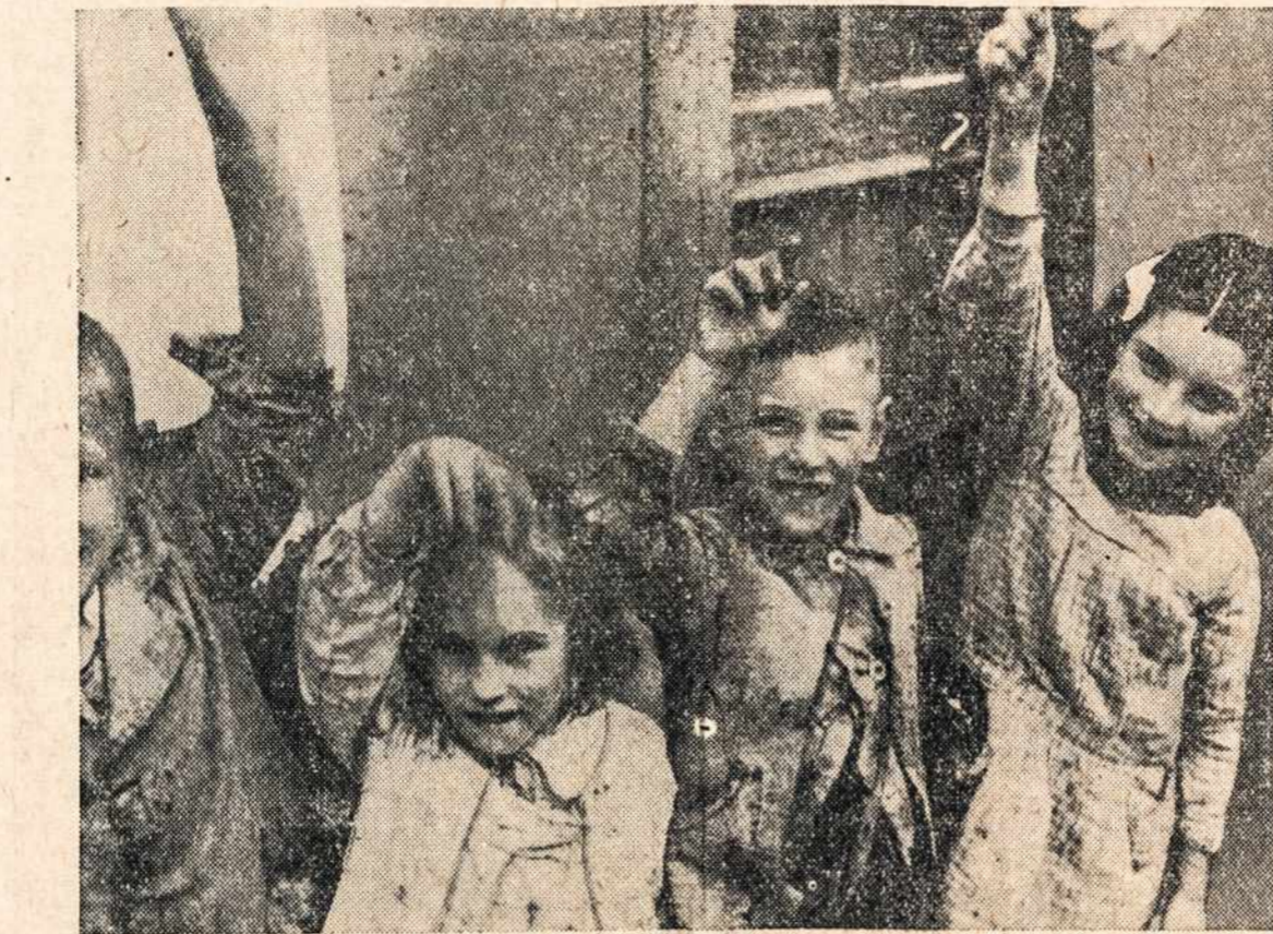
Neatsižvelgiant į šių Prancūzijos vaikų suvargimą, maršuojant amerikiečių kariams, jie štai sveikina juos, ir siūnia savo nekaltą šypseną.

Iš Berlyno pranešama, kad Alijantų lėktuvai bombardavo pietų — vakarų Vokietijos dalis.