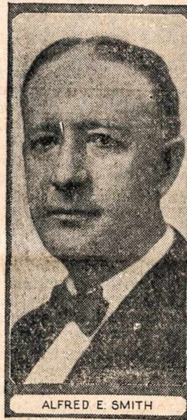
ALFRED E. SMITH

New York, spalio 5 — A. a. Alfred E. Smith, buvęs New Yorko gubernatorius, laidojamas šeštadienį, spalio 7 d. su iškilmingomis šv. mišiomis iš Šv. Patriko katedros 11 val. rytą. Velionio kūnas bus pašarvotas Šv. Patriko katedroje penktadienį, spalio 6 d. nuo 2 val. po pietų.