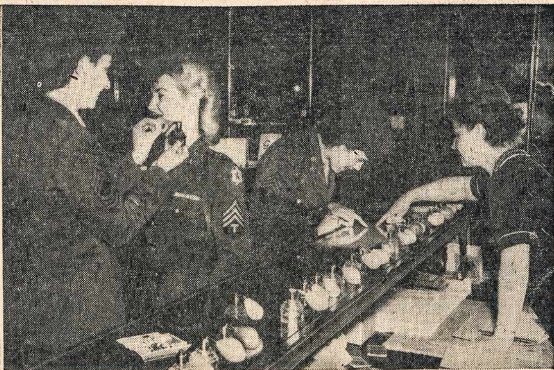
Šios Dėdės Samo WACS turėjo laimės užėti Paryžiuje į perfumerijos parduotuvę, kur joms suteikta malonumo apipurškiant Paryžiaus kvapai.

Kada Raudonojo Kryžiaus Komitetas gaus in-formacijų apie ieškomus asmenis, jo darbas bus baigtas. Raudonasis Kryžius negalės reparijuoti asmenis, negalės vėl su-vesti šeimas, ir panašius darbus. Atsiminkime, kad