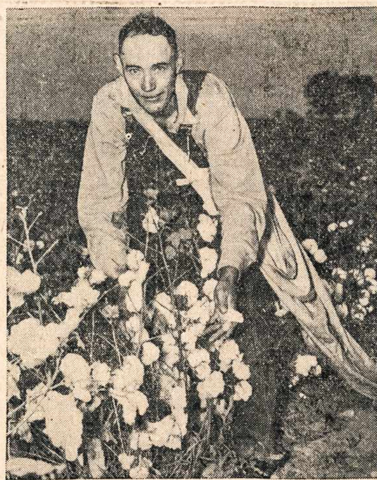
Šitas vyras gavo $1000 dovaną už ypatingai greitą vatos derliaus nurinkimą. Jis surinkdavo 102.6 svarų vatos į vieną ir pusę valandos, Blytheville, Tex.

Šiaip, vokiškoje spaudoje ir vokiškajame radio, lietuvių vardas, dažniausiai,