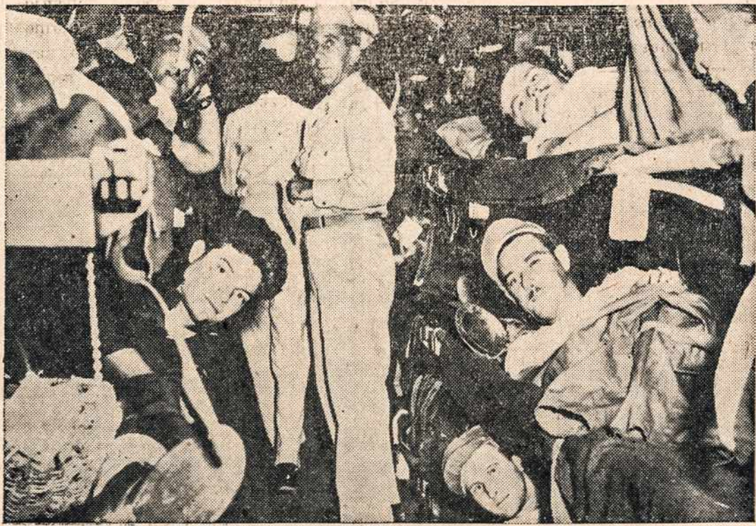
Šie Dėdės Samo lakūnai pirmieji atvyko išlaisvinti iš Bulgarijos į Egiptą. Jie ir vėl jaučiasi laisvi. Ten jų buvo 300 vyrų.

Andriejaus lietuvių par. bažnyčios šv. Marijos kapuose. Lai Dievas būna gailestingas velionių vėlėms.