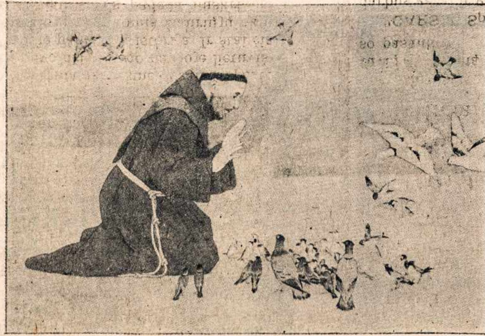
Šv. Pranciškus — “Saulės Giesmės” autorius ir paukščiai.