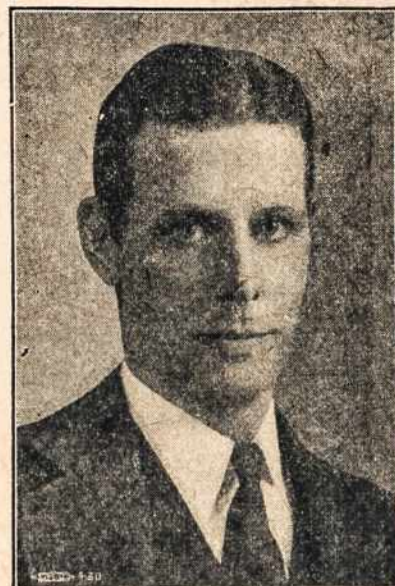
Maurice J. Tobin,