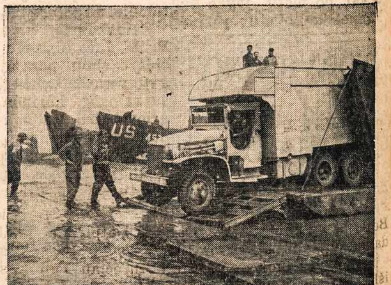
FIRST AMERICAN RED CROSS CLUBMOBILE to land in France the "Daniel Boone" drives off an LST onto the causeway.