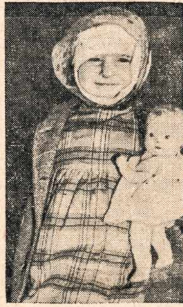
SMILIN' THROUGH — Despite wounds and loss of loved ones, this orphaned refugee smiles upon her arrival in the safety of America. Your gift to the Greater Boston United War Fund is bringing thousands of children like her to the peace of our country.

Praneša, kad Didžiojo Bostono Suvienyto Karo Fondo (Greater Boston United War Fund) vajų, (kuris prasidės spalio 30 ir baigsis lapkričio 22) pradės didžiule parada sekmadienį po pietų, spalio 29 d., Bostone.