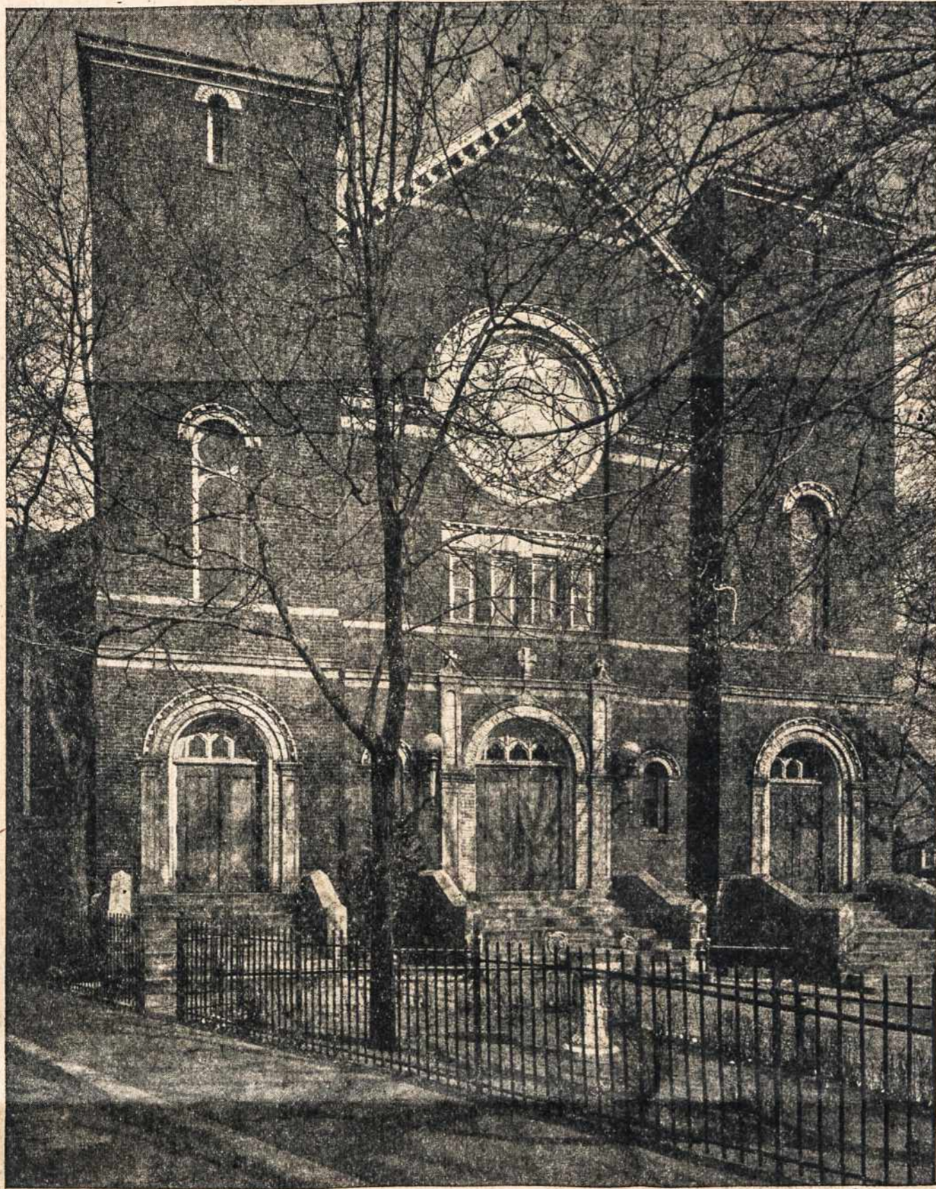
ŠV. JUOZAPO LIETUVIŲ PARAPIJOS BAŽNYČIA, WATERBURY, CONN.

Sekmadienį, spalį 29 d. š. m. Šv. Juozapo lietuvių parapija mini savo gyvavimo Auksinį Jubiliejų iškilmingomis pamaldomis bažnyčioje ir šauniu bankietu.