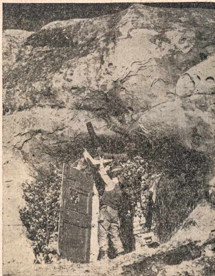
Karo laiko saugus namas kalne. Tai Italijoje, kur jau praužė karo banga, ten žmonės turėjo progos patirti ir šios rūšies gyvenimo.