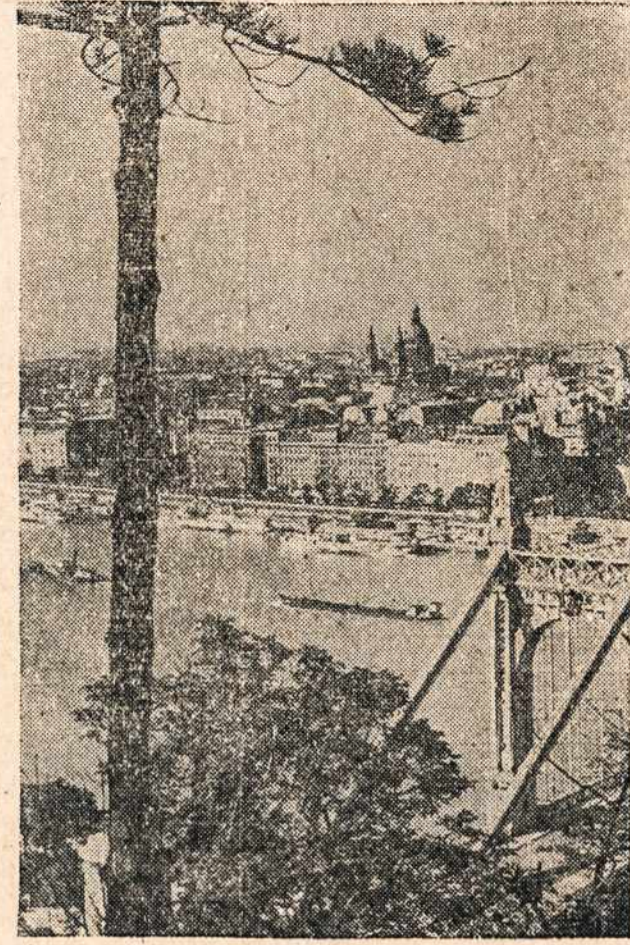
Gražiausias Europos miestas, Vengrijos sostinė Budapestas, iš kurio dabar naciai traukiasi, gi rusų - bolševikų raudonoji armija veržiasi į miestą. Kadangi tai ne Vokietijos ir ne Rusijos miestas, tai vieni puldami, kiti gindamiesi, gražųjį miestą griaua ir naikina.

Tad nestebėtina, kad didžiama aktyvių jaunesniųjų Rusijos gyventojų visai neturi laisvės pojūčio. Daugelis jų gimė jau po revoliucijos, gi kiti revoliucijos