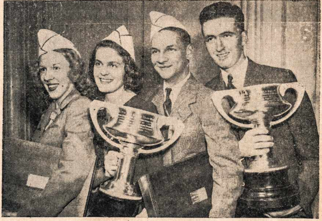
4—H klube jie laimėjo čempionatus už veiklą ir už mokslą kolegijoje laimėjo scholarships.