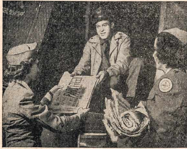
Three days after metropolitan newspapers leave the presses back in the States, hospitalized servicemen at Fort Richardson, Alaska, are scanning the headlines and keeping up with the latest antics of their favorite comic strip characters. Through the American Red Cross, the papers are rushed to these convalescing tanks the moment they leave Air Transport Command planes. Daily editions from New York City to Seattle and from Los Angeles to Vancouver are included in the daily bundles, collected by airline's cleaning crews after transcontinental and coastwise passengers have departed, leaving their once-read daily editions aboard.