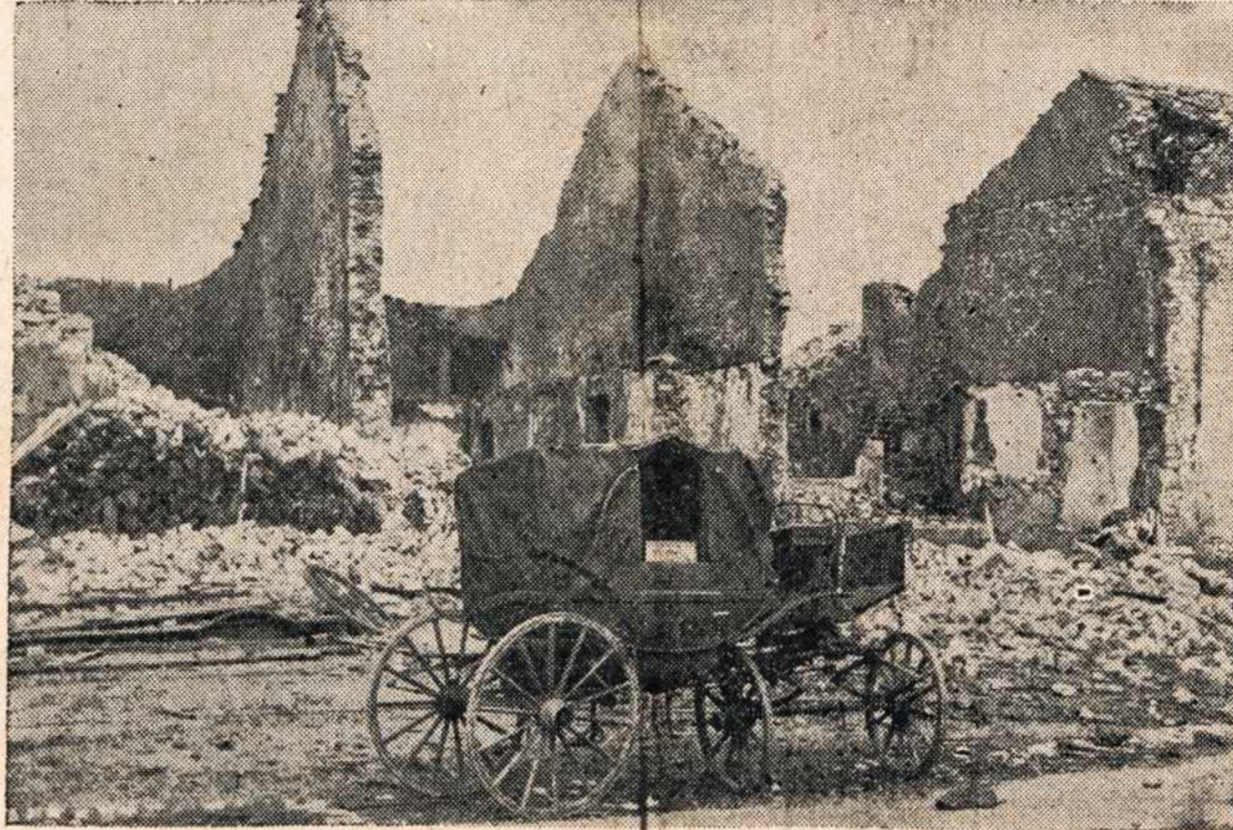
Kaip vokiečiai pasitraukė iš Sillegny, Prancūzijos, paliko tik šiuos griuvėsius ir matomai šią "karietą".

Laivyno sekretorius sako, kad nuo pradžios karo Amerikos submarinai nuskandino 3,500,000-tonų Japonijos laivų.