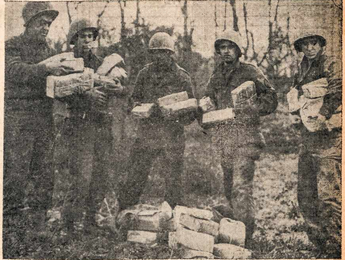
Vokiečių karo fronte mūsų kariai gerokai prieš Kalėdų šventes jau gavo jiems pasiųstas kalėdines dovanas.