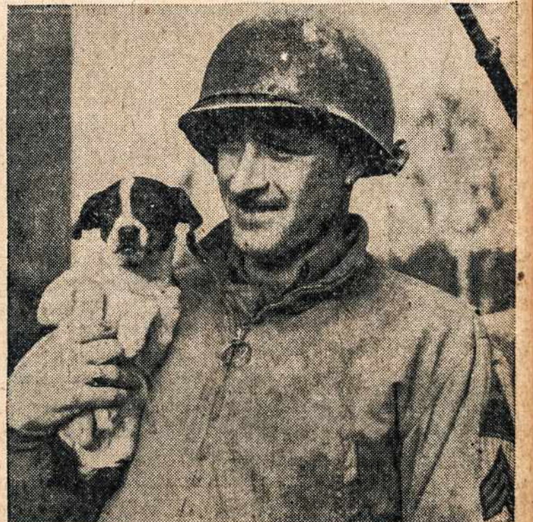
Kur nors Prancūzijoje šiam amerikiečiui patriotas prancūzas pafundino šį mažytį šuniuką. Karys labai patenkintas šia dovana, nes jis turi daug malonumo su šiuo šuniuku.

Darbininkas išleido "GYVOIO ROŽANČIAUS PASLAPTYS" knygutės formoje. Kiekviena paslaptis iliustruota paveikslais. Šioje knygutėje taipgi yra ir narystės mokesčių laveliai. Knygutės kaina 20c. Užsakymus siųskite: "Darbininkas", 366 W. Broadway, So. Boston, Mass.