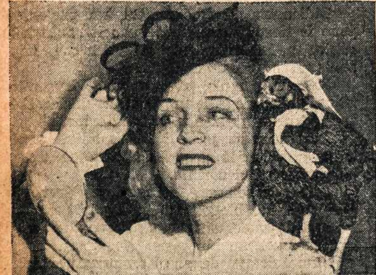
Matomai artinasi moteriškų kepurų moda su plunksnomis kepuraitėse. Si mergaitė net ir paukštį pasisodino ant peties, kad pamačius veidrody kaip atrodytų priedas.

Teko patirti, kad mūsų parapijos alumnai t. y. jaunuoliai, baigę parapijos mokyklą, yra užsibrėžę atlikti milžinišką darbą mūsų parapijoje, t. y. savo energingais parengimais auginti fondą priėmimui mūsų karių, grįžtančių iš karo tarnybos po karo. Alumnų tikslas yra, milijoniškų pagerbimo bankietu priimti grįžtančius karius. Be to, pažangūs alumnai, turi