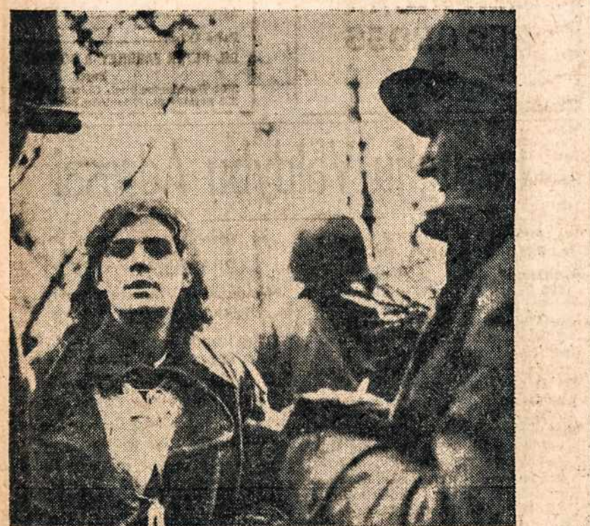
Amerikiečiai išlaisvino šią rusę, Raudonosios armijos moterį, iš nacių belaisvės. Kuri sako turėjusi nacių fronte kasti apkasus. Ten pat buvo išlaisvinta ir kitos 700 rusių moterų.

3) bus be reikalo sunaudojama daugiau medžiagos, negu toms prekėms pagaminti reikalinga;