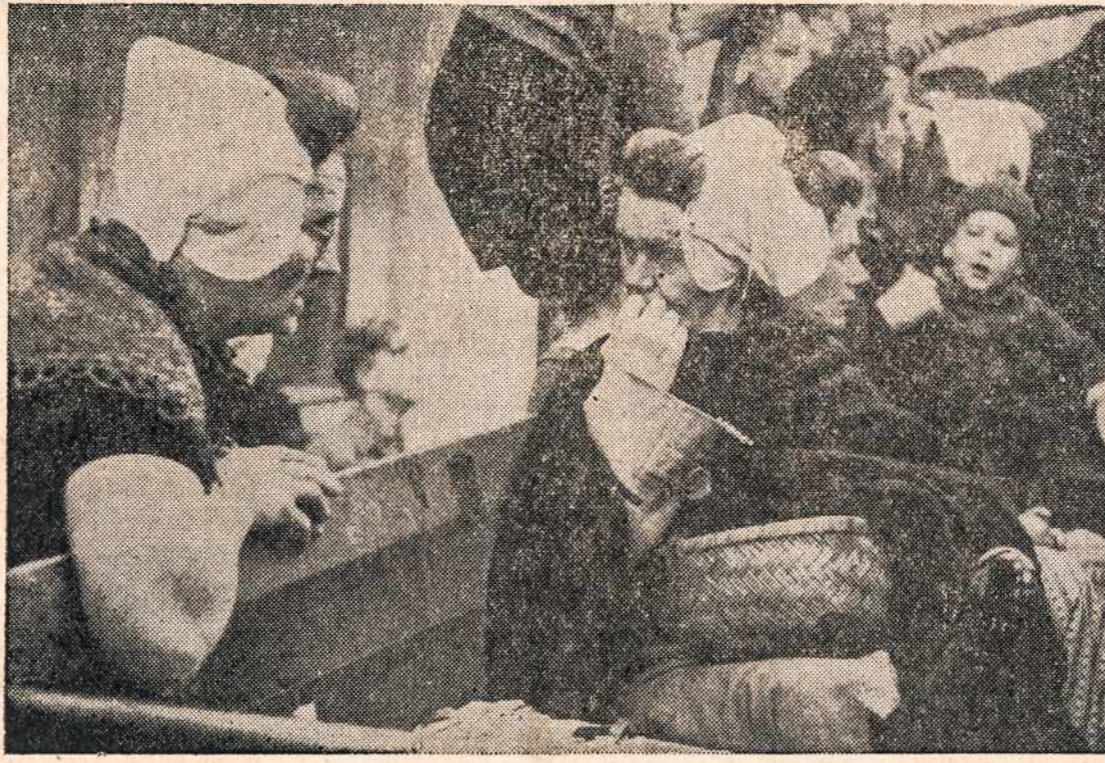
Olandietė su širdies skausmu sako sudiev savo gerai prietelkai, kuri buvo priglaidusi laike nacių okupacijos jos gyvenamą vietą. Dabar, kai gimtinė išlaisvinta ji grįžta atgal, pasakydama savo nuoširdų dėkui gerai tautietei.