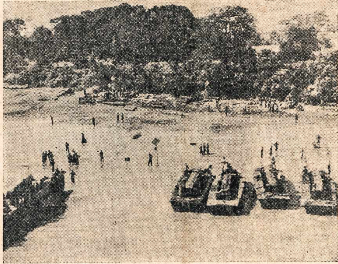
Alijantų karo jėgos įsiveržia į Akyab, Burmoje.

J. V. valdžios įstaigos reikalauja įvairių darbininkų — mechanikų. Dėl darbų kreipkitės į valdžios samdomo biurus. Daugiau informacijų galite gauti Jung. Valstybių pašto skyriuose.