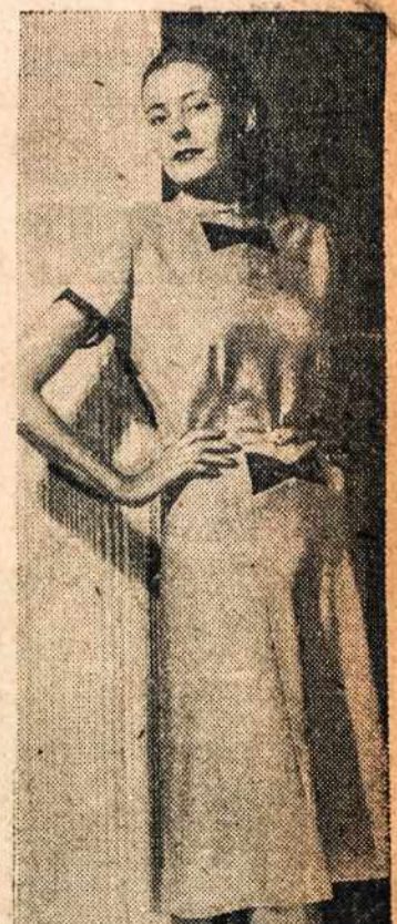
ALL-PURPOSE — Dignified simplicity of this steel-blue wool jersey dress shown at Waldorf-Astoria fashion show makes it suitable for around-the-clock wear. Brown grosgrain bow matches inserts at belt and neckline.

Limosinai dėl visokių reikalų Patarnavimas Dieną ir Naktį