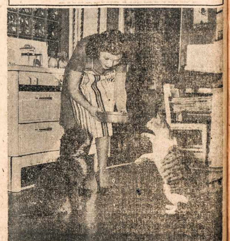
When you save and turn in used kitchen fats, you are doing a good turn for your household pets, because the by-products of used fat are necessary ingredients in prepared animal foods.