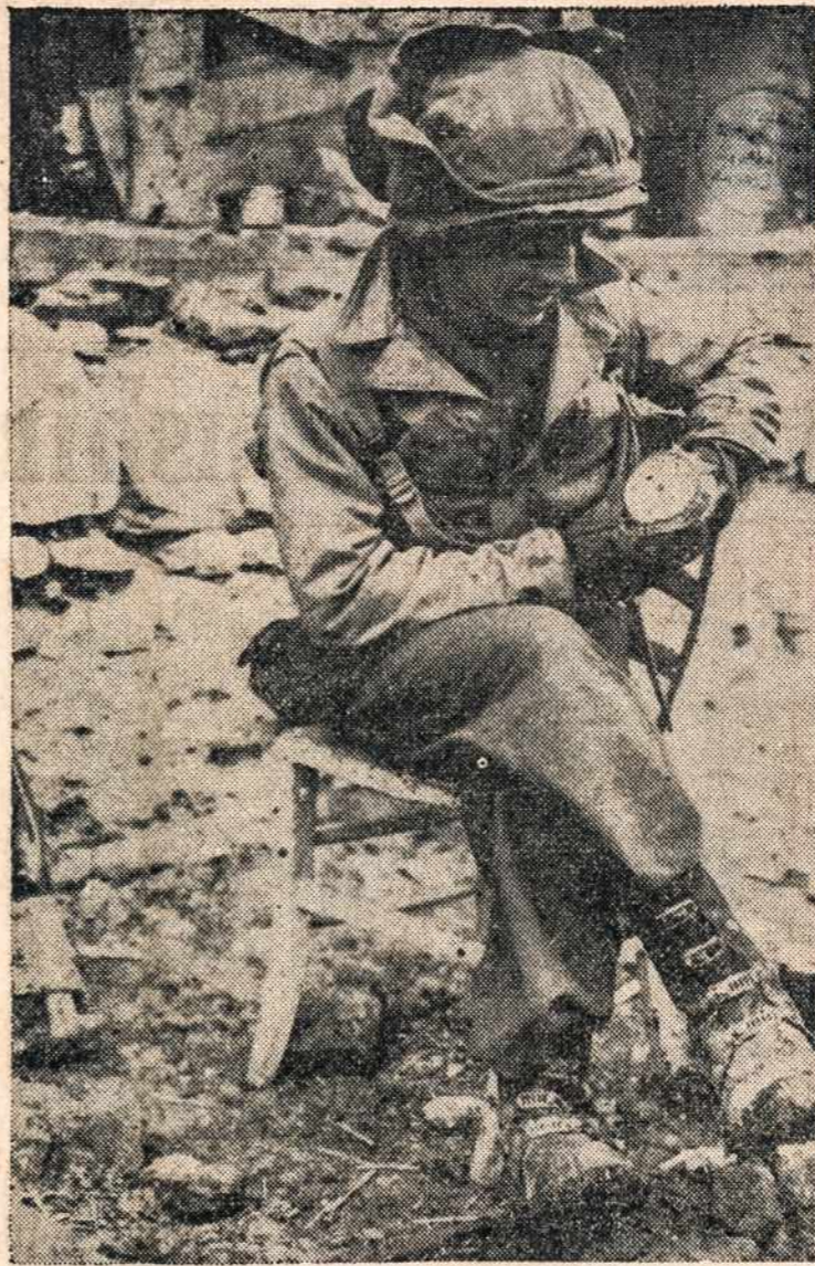
Mūsų karys vokiečių fronte atradęs nedidelį laikrodį atsargiai studijuoja jo turinį. Dažnai pasitaiko, kad įvairūs vokiečių smulkūs palikimai esti pilni dinamito ir tik pasukus kokį nors dalykėlių, eksploduoja.