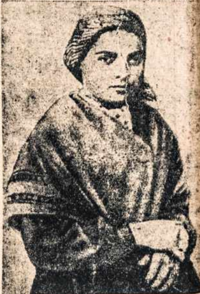
Šv. Bernadeta, kuriai 1858 m., vasario 11 d. pirmą kartą Švč. P. Marija apsirėškė Masabieliu olos angoje Liurde.

Tikėjimas ir dorybė plinta iš Liurdo po Prancūziją. Šiandien verkia ta gražioji tauta ir ieško sąžinės nuodėmių, norėdama už jas atgailauti. Dieve duok, kad ir mes gero iš prancūzų taip greitai išmokume, kaip išmokome nuodėmiauti".