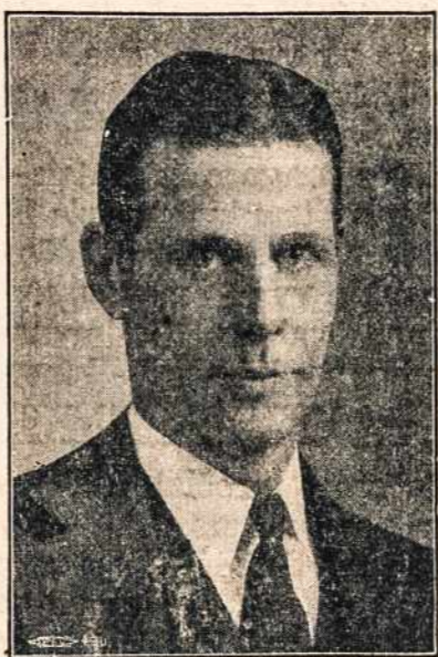
Maurice J. Tobin,

Massachusetts valstybės Gubernatorius, nuoširdus lietuvių ir Lietuvos draugas — rėmėjas, pasižadėjo dalyvauti ir kalbėti So. Bostone — Lietuvos nepriklausomybės minėjime.