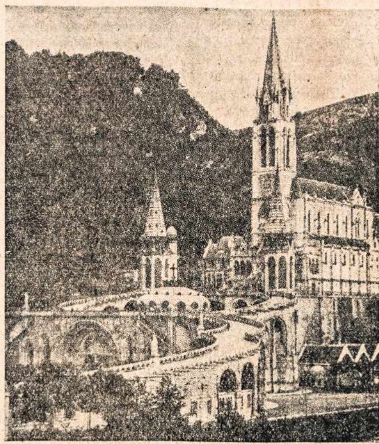
TRYŠ LIURDO ŠVENTOVĖS—BAŽNYČIOS Dešinėn apatiniame kampe matyti trys maldykklės, kuriose įvyko ir įvyksta daug nuostabių stebūklų.

Tuo tarpu tam suprasti nereikia nė galvos laužymo, nė ilgų aiškinimų. Dalykas matosi kaip ant delno. Prancūzų tauta po baisaus pralaimėjimo patrynė akis ir praregėjo, kad komunistinis sąjudis buvo privedęs Prancūziją prie medžiaginio ir dorovinio bankroto. Prancūzai nebenori, kad istorija pasikartotų ir naturaliai krypsta dešinėn. Tai paprasčiausia savisauga. DeGaulle dar neturi pajėgų aiškiai tą pareikšti. Jis delsia ir kiek įmanydamas vingiuoja. Bet vienas dalykas tai ryškėja be mažiausios abejonės: jis nesiduoda suvalgomas bolševikų košėj.