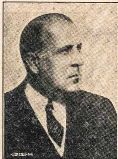
David I. Walsh,

Jung. Valstybių Senatorius iš Massachusetts, nuoširdus Lietuvos užtarėjas ir gynėjas, yra pasižadėjęs, jeigu tik nesusidarys kokių kliūčių, dalyvauti ir kalbėti Lietuvos nepriklausomybės minėjime, So. Bostone.