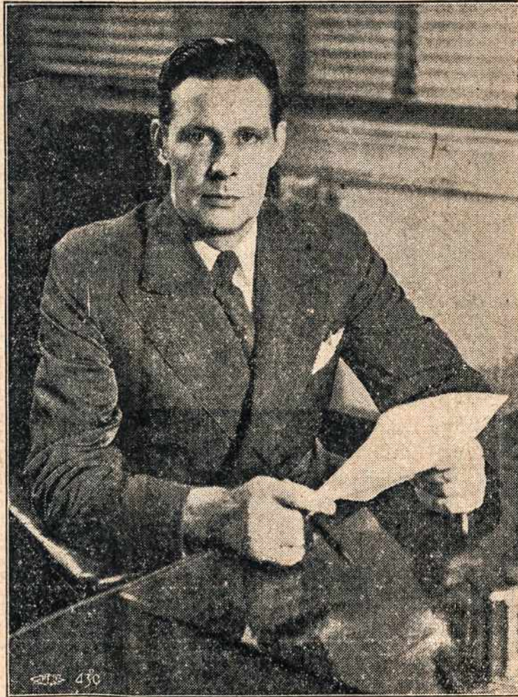
MAURICE J. TOBIN,

Pranešimas sako, kad ELAS, komunistų vadovaujama organizacija, sušaudė 3,300 graikų, o kiti žuvo laike kautynių.