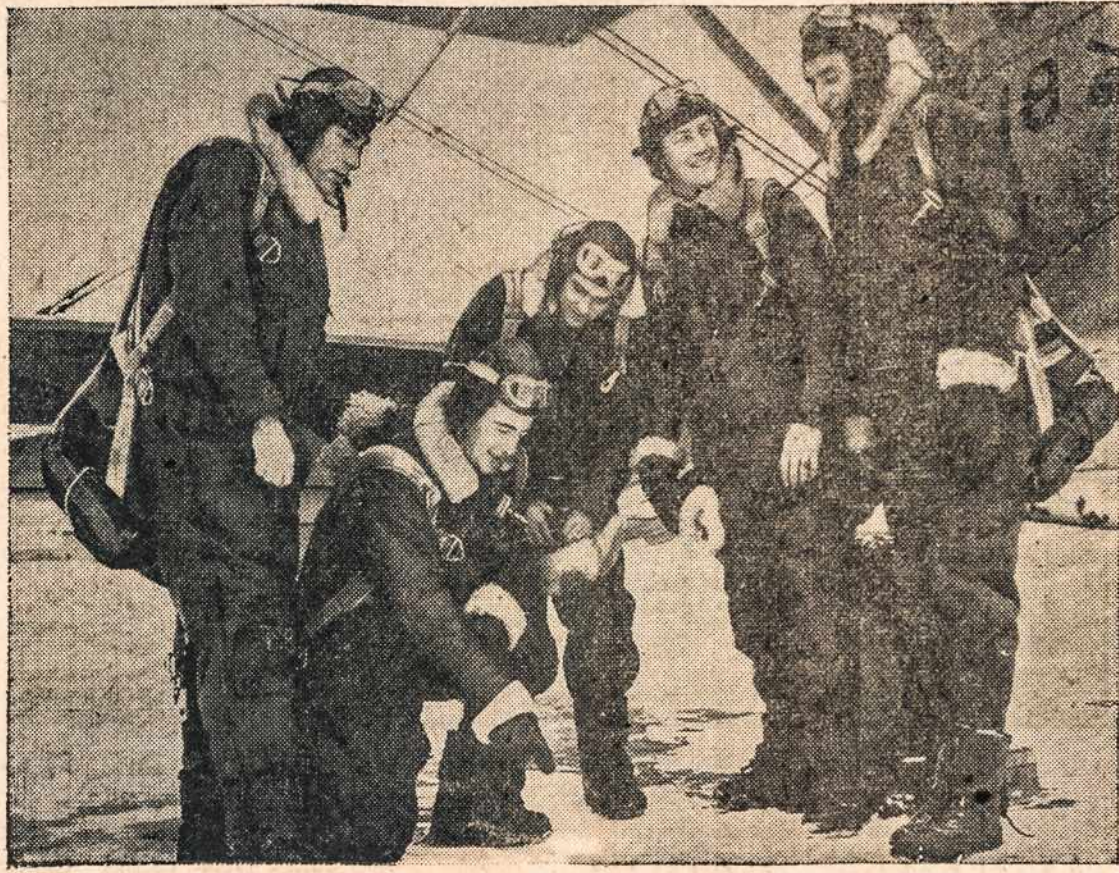
Aviacijos kadetai prieš pakylant į orą priima jiems suprantamas instrukcijas, kaip būti sėkmingu "basketball žaidiku".