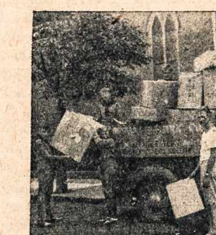
BALF I skyrius rūbus krauja ir siūnčia į BALF sandėlį, 101 Grand St., Brooklyn 11, N. Y.

Didžiausiu skyrium dar vis pasilieka Bostono skyrius su