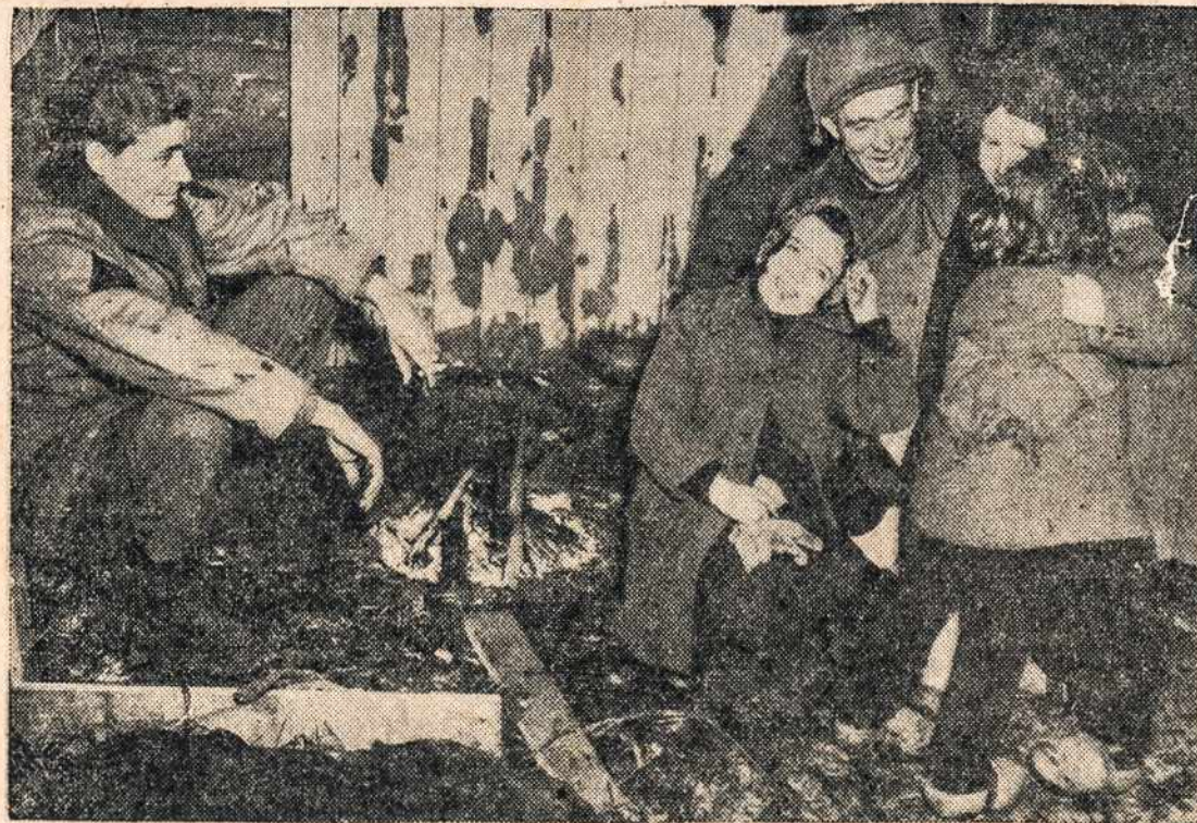
Belgijoj Dėdės Samo kariai šnekasi su belgais vaikučiais. Vaikai matomai jaučiasi kaip namie.

kyti lietuvių dvasią. Dėl to, jis per keletą metų kvietė Seseles Pranciškietes, kad atostogų metu katechizuotų mokyklinio amžiaus vaikus ir lietuviškai mokslingų parapijos jaunimą.