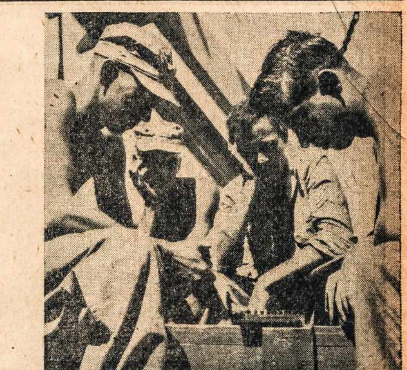
Yankiai, Luzon saloje, kai gavo laisvą poilsio valandėlę, žaidžia — Pocket-size chess.