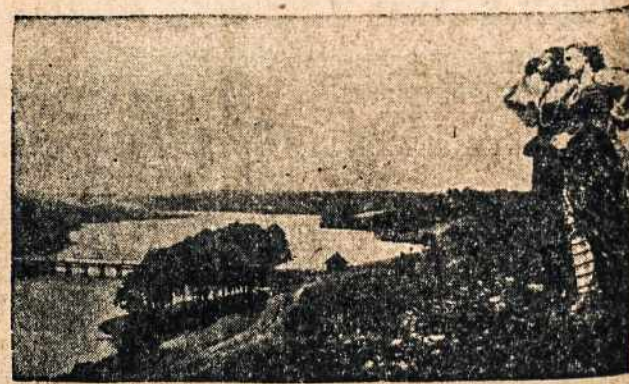
DAINUOJANTI LIETUVA. —Laisvos Lietuvos laikais lie-tuvų ir lietuvaičių dainos skambėdavo nuo ryto lig vakaro ir ten pareikšdavo savo viltį, ilgesį, džiugumą ar miltūdimą... — "Eik drąsiai, puiki skaitveide, ar užvilt lietuvius gali? Tas tė-singas, ant ko leido Dievas sunkią, kietą dalį..."

— Grįžkite laimingai ir kuo greičiausiai! Mes jūsų lauksime! (Bus daugiau)