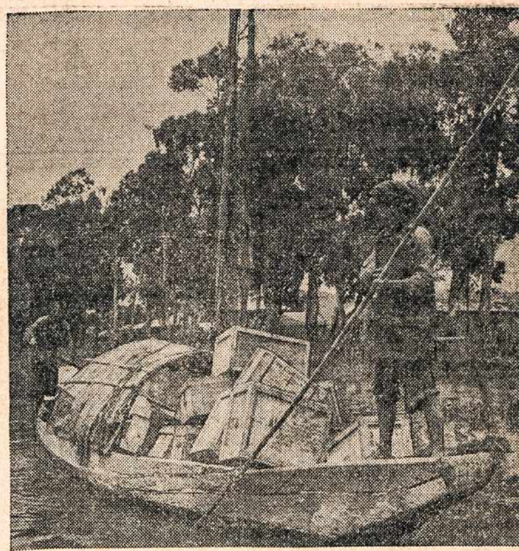
IN CHINA, WHEN going gets too rough for any other mode of transportation, ancient sampans carry American Red Cross supplies for servicemen to forward posts. In other parts of the world, equally primitive means are used when there is no other means available to distribute the comfort supplies American fighting men value so highly.