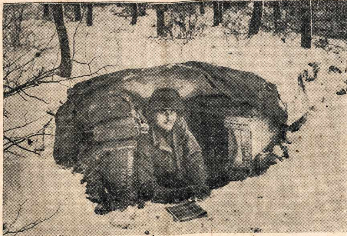
Dėdės Šamo karys, Luxembourg, fronte, Europoj, įsitaisęs sniego lauke gyvenamam namukui. Šio kario matomai ir ten linksmas veidas.