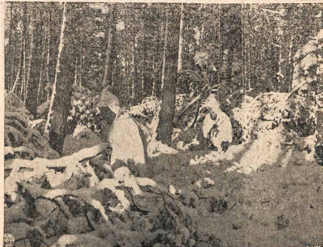
Vokiečių snieguotame karo fronte Dėdės Samo kariai per miško tankumynę slenka atlikti žvalgybos užduotį.