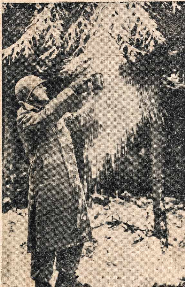
Amerikietis karys, Belgijos fronte prisikrečia sau su ir švaraus sniego į puoduką, kad pasigaminus kavos.

Sao Paulo mieste leidžiamas dienraštis Folha da Noite lapkričio 18, 1944