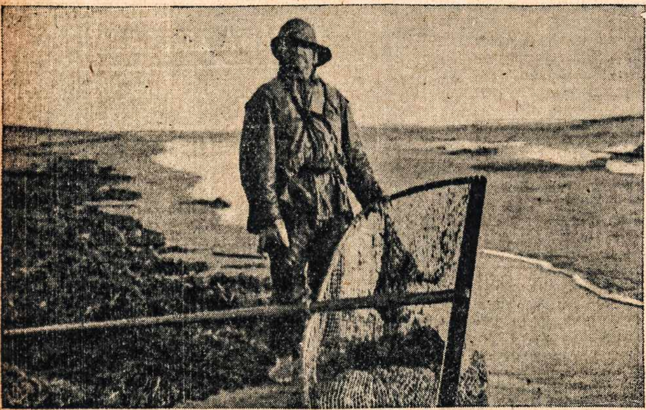
LIETUVOS MARIŲ ŽVĖJIS. — Jam buvo miela gintarus gaudyti Baltijos pu-tų bangose, kai Lietuva laisve kvėpavo. Gi šiandien, kai valstybė nusavino viską ir jis nuliūdo ir net patyrė ištremimą... Ir: "Šarpūs... rūsčiai sušvilpė vėjas ir sniego kalnus suka aukštai... mane daboja, lyg koks erelis, lūpas sučiaupęs gudas nuožmus. Vien tik iš tolo skamba varpelis, lyg laidotuvių ženklas baisus... Sudiev per amžius, gūžta savoji... stačiai žiemuosna neša mane, liki tu sveika, brangi tė-vyne, jau nematysiu daugiau tave..." Ir taip lietuvius blaškomas po ištremimo vie-toves ir šaukia: "Rankos sukaltos, kardo netekau, jaunas pritemo man žvilgesys, brangi jaunystė, rausvesnio veido — ir jus Sibiras greit užgesys."