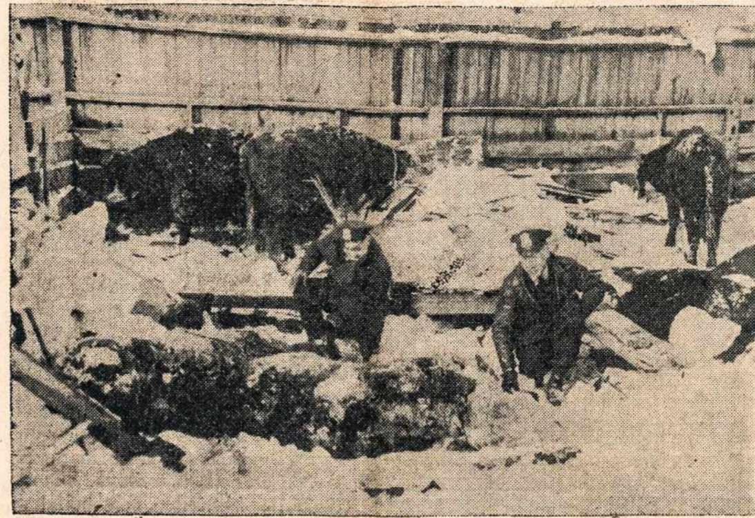
Didelis sunkumas sniego ant silpno gyvulių tvarto stogo Rochester, N. Y., sugriovė stogą ir užmušė daug galvijų. Kiti matomai keli išliko. Atvykę ugniagesiai atkasa užmuštus gyvulius.