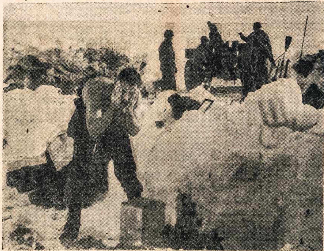
Amerikietis karys, narys matomos baterijos, kad ir žiema, bet perpus nusivilkęs prie mažos ugnelės prausiasi. Tai paveikslas iš vokiečių karo fronto, kur šalčiai ne kiek nelengvesni už amerikonišką žiemą.

Be to, reikia mokėti ir dažnai save persigalėti, pav., susiginčius arba nutylėti, arba visai pyktį paslėpti. Žinoma, tai yra nelengvas dalykas, bet būtinai reikalingas. Stenkimės daugiau juoktis ir būti linksmos, negu dejuoti ir skųstis, kad bėdos ir vargai mus spaudžia. Jeigu gyvensime dorai ir teisingai, galime būti tikros, kad Dievas mūsų neapleis; Dievas viską mato, Jis viską žino, Jis daro mums gerą arba šitam arba būsimajam gyvenimui. Nors vargai mus čia spaudžia, bet būkime tikros, kad jie praeis, gal būt dar ir šiame gyvenime. Tuo tarpu šis gyvenimas yra toks trumpas; tai yra tik žingsnelis, tik bandymas, tik proga užsitarnauti laimingą amžiną gyvenimą. Tad ko