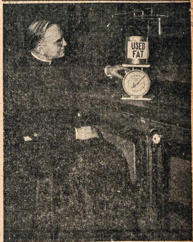
Rt. Rev. Msgr. Edward J. Flanagan, director of boys' home, Boys Town, Neb., makes sure every drop of used cooking fat is saved, weighed and turned over to Uncle Sam. Used fat helps supply medicines, munitions as well as home front essentials.