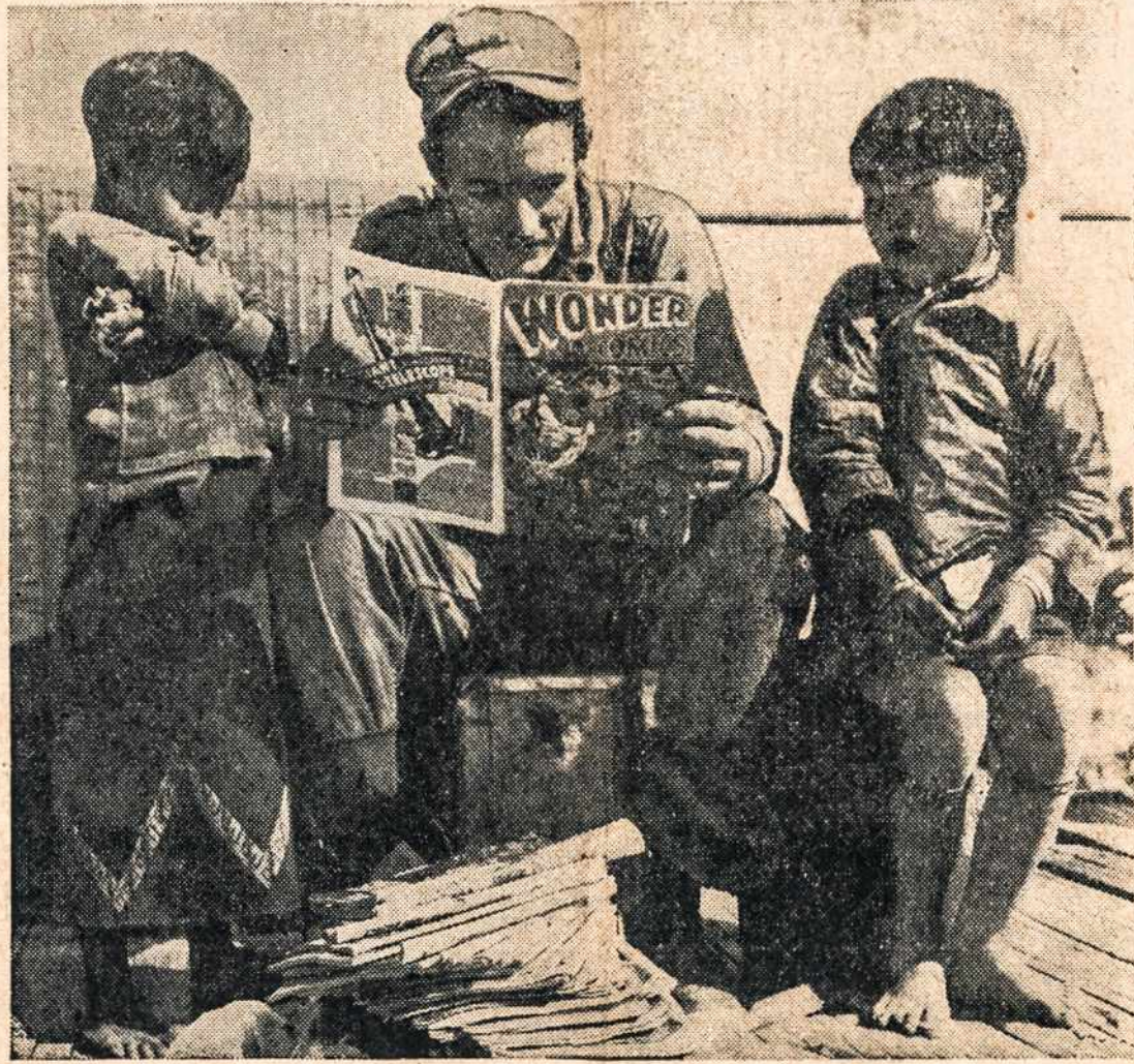
Eilinis Dėdės Samo karys, Burmos karo fronte, gavęs amerikoniškus "comic books", skaito ir burmiukams paaikina.