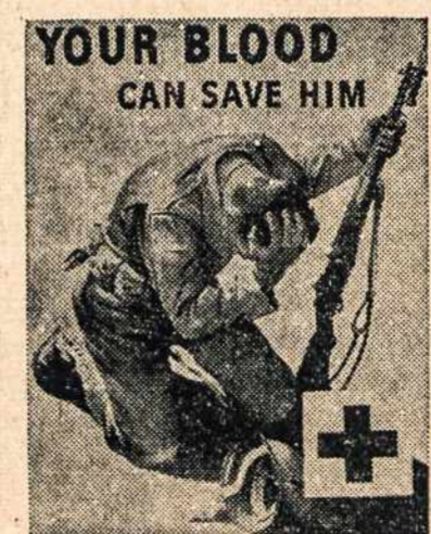
NEW POSTER: Shown above is the new poster appealing for volunteer blood donors which the Red Cross is distributing to its thirty-three blood donor centers and nearby chapters.

Londonas, kovo 5 — Oficialiai praneša, kad Šveicarijos ir Čekoslovakijos valdžios apsisprendė atnaujinti diplomatinis ryšius.