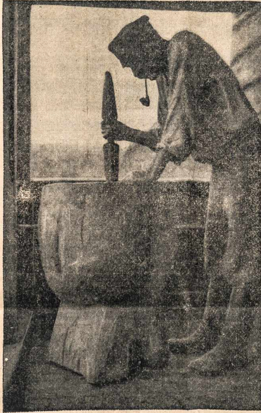
Karo metu lietuviai primityviška "mašina" pasigamina kruopas iš avių; šia "mašina" sugrūdamos aguonos, kanapės ir net prirengiamas grūdains aliejaus sunkiai išgauti.