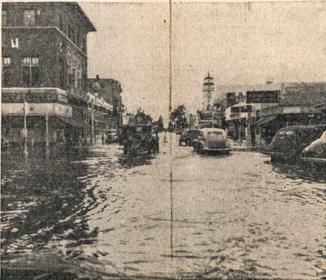
Patvinusi St. John's upė Kalifornijoje, užliejo artimus miestelius.