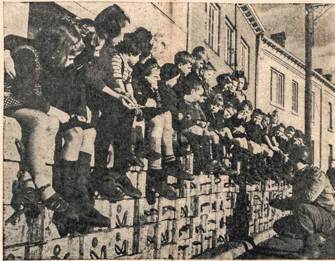
Įdomi vaikų audiencija Olandijoje, kur susėdę ant amunicijos dėžių klausosi amerikiečio kario paaiškinimų, o gal laukia saldinių ar kitokių dovanėlių.

Iš viso atrodo, kad Rumunioj negalės būti nei laisvų rinkimų, kaip buvo numatyta, nei laisvės, kol komunistai nebus sudrausti.