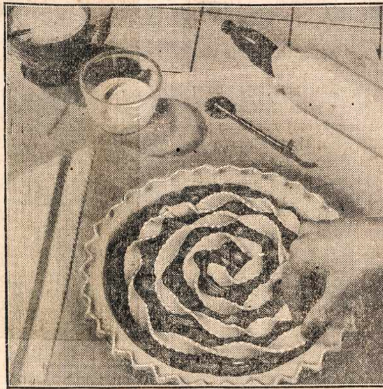
Spring—and rhubarb time! Let honey be "sweetening" in this luscious new dessert

When the first rhubarb arrives, treat the family to a honey Whirligig Rhubarb Pie! Don't hold back because sugar is short—just make your pie extra delicious with honey for sweetening, and freshly-grated orange rind for a new flavor-filling! Make your pie "Whirligig" by twisting and swirling narrow strips of fine pastry on top—an easy trick for other fruit pies, too, when you want something different. Clip the recipe—and let Honey Rhubarb Pie sing a spring song on your menu.