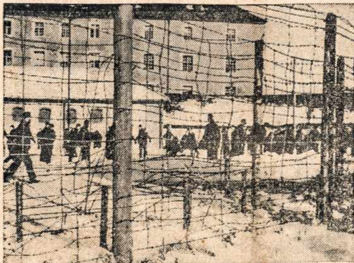
Thousands of War Prisoners would be forgotten. That they have not been abandoned to their fate in this war is the achievement of your Red Cross, which has constantly reached them, even in Japan, with morale-building parcels of food, extra clothes, medicines, cigarettes and other comforts. More and more of your dollars are urgently needed to keep our men in life, health and hope until they can be brought safely home!