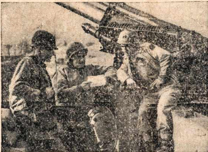
Thousands at front would be tormented by home worries. Millions of fighters bless the Red Cross for relief from anxiety. Each week thousands of messages pass between Red Cross Field Directors with the troops and Home Service workers in home towns—emergency questions about wives, children, sweethearts or parents. Your dollars will bolster fighting spirit.