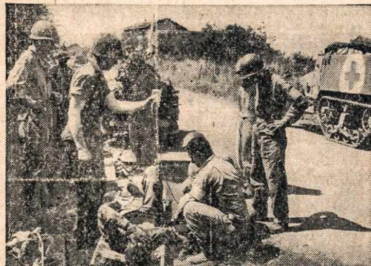
Thousands would die from loss of blood where they fell. This is the first war in which the folks at home actually saved lives at the front. Surgeons General of the Army and Navy say blood plasma has been the foremost life-saver in this war. The Red Cross, through your blood donations and money, has collected and distributed millions of pints to the medical services.

Give your dollars now—give more than ever before!