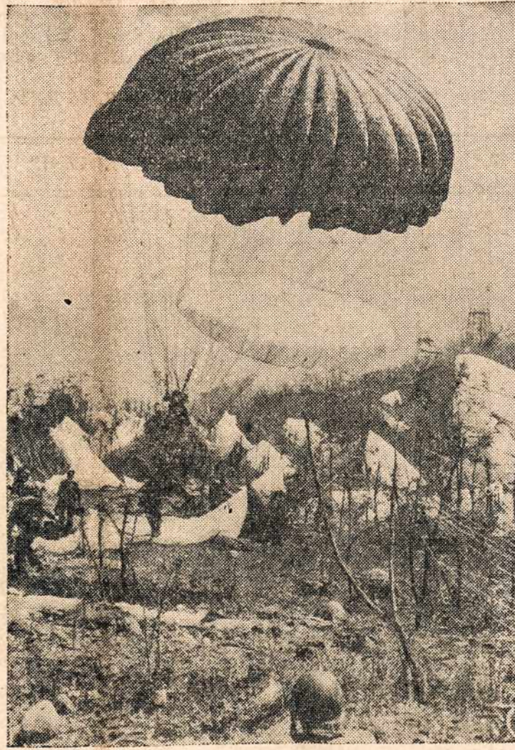
Amerikiečiai, kaip milžiniški grybai, nusileidžia ant Corregidor tvirtovės akmenuoto paviršiaus, kad iš ten iškrapščius priešą-japonus.