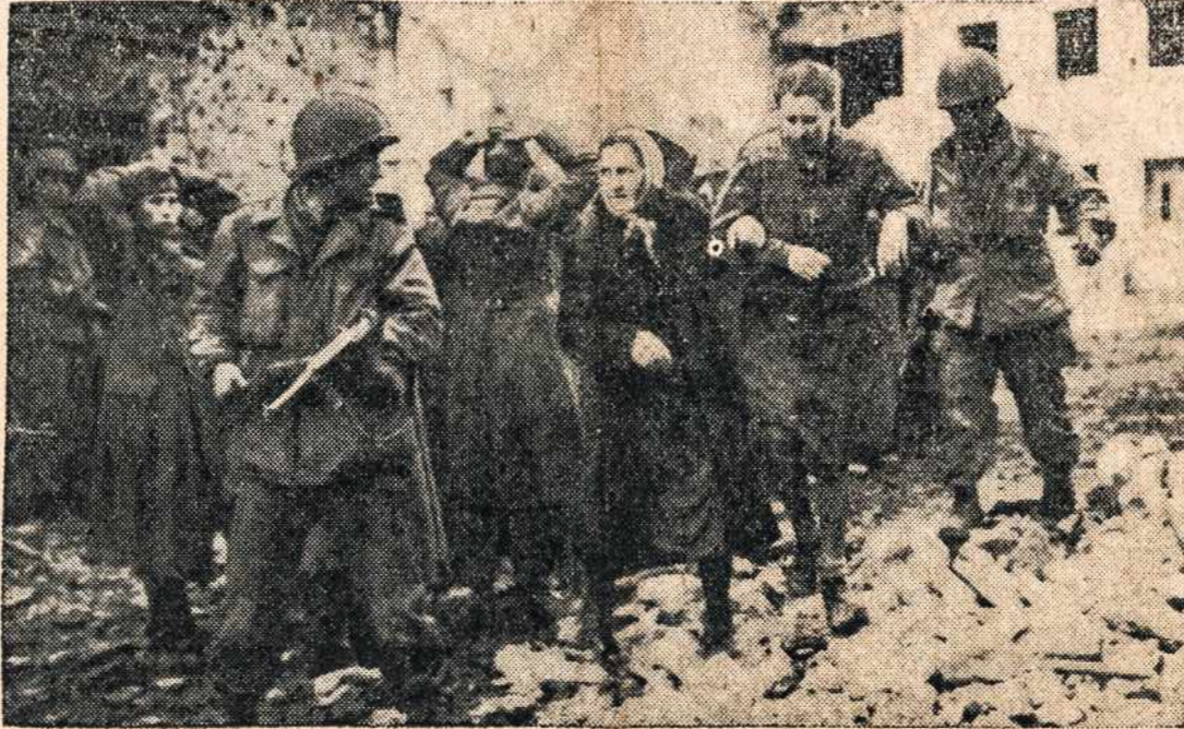
Amerikiečiai išvalo užimtą vokiečių kaimą nuo nepatikimų asmenų. Vaizdas parodė ant galvų rankas belaikancius vokiečių karius paimtus į nelaisvę ir moteris išvedančias iš griuvusių vietos.

būtų Bostono diecezijos čempionai. Brocktono laikraštis plačiai ir prielankiai rašo apie lietuvių sportininkus. Valio lietuviai! Į čempionatą! Raporteris.