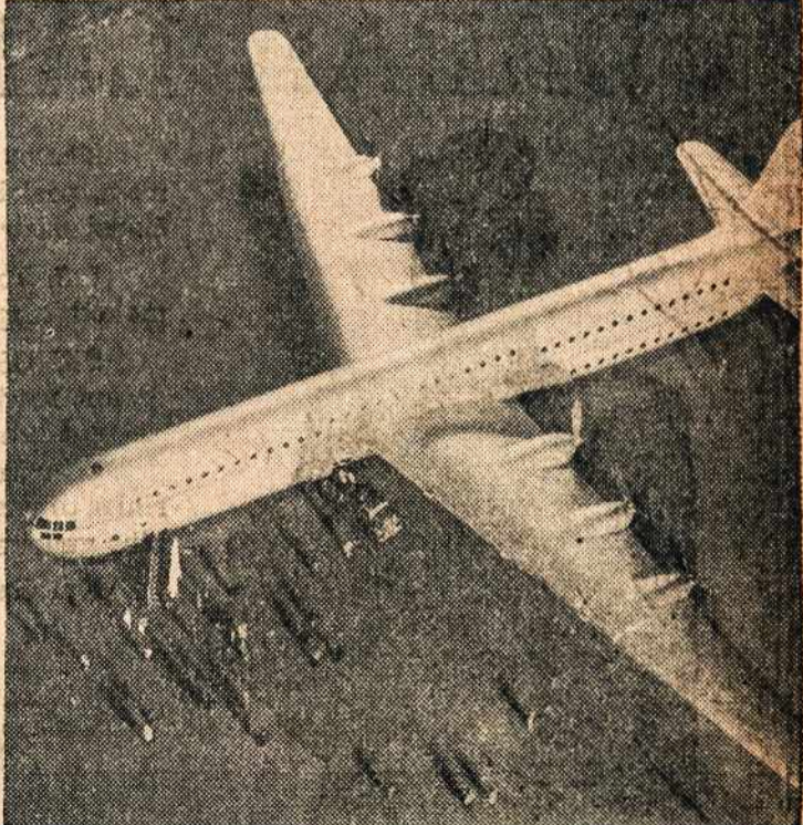
Didžiausias pasaulyje transportinis lėktuvas. Tai Vultee orlaivis, kuris gali vežti 204 pasażierių ir 15,000 svarų bagažo paštos siuntinių. Jį varo šeši motorai, kurie pagamina 353 automobiliams lygią jėgą. Orlaivis turi 182 pėdas ilgio.

FRANCISCAN FATHERS Mount St. Francis Greene, Maine.