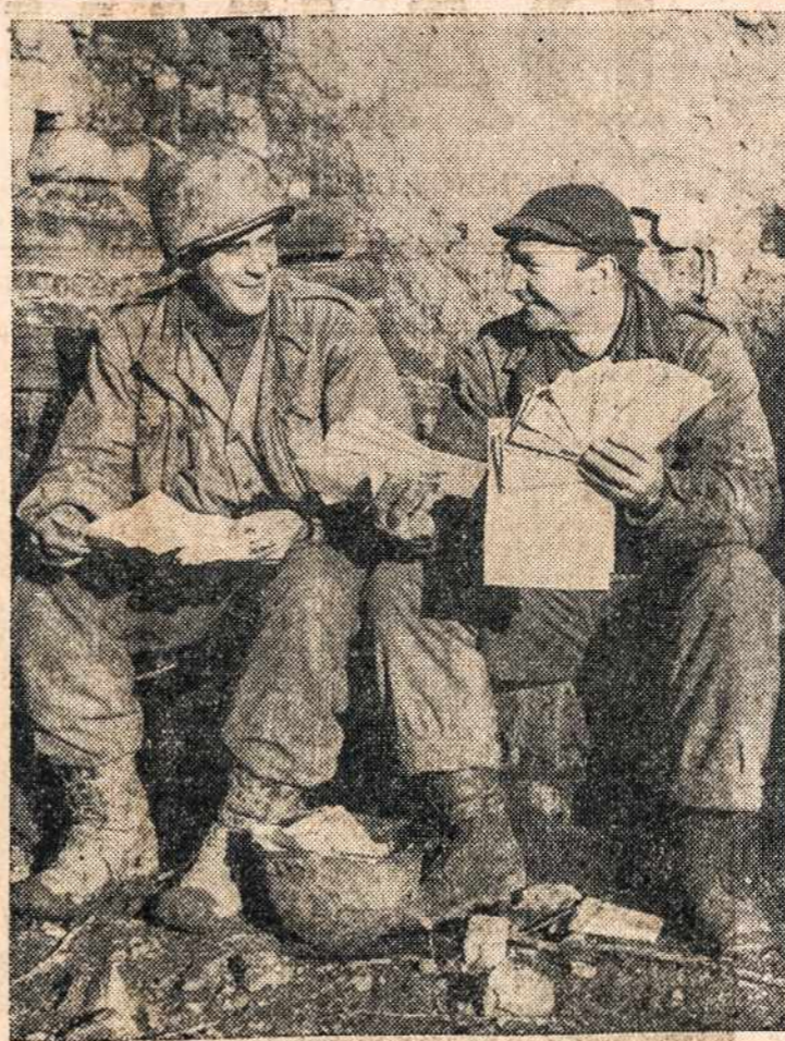
Kariai, Vokietijos fronte, linksmi gavę po dešimtis laišku nuo savųjų.