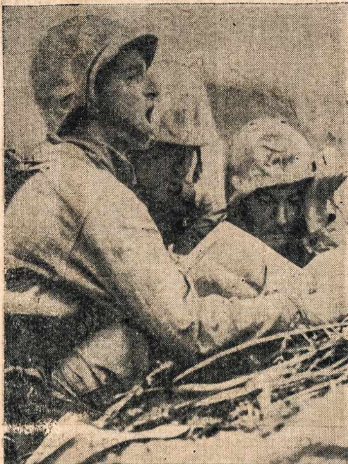
Trys marinai Iwo Jimo saloj, seka japonų karių judėjimą ir duoda signalą saviškiai artilerijai pliekti tam tikra linkme į priešų pozicijas.