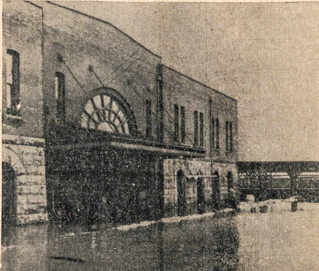
Patvinus Ohio upei ir užliejus apylinkes ir susisiekimo kelius suparaliziavo. Vaizdas parodo Central Railroad Station in Louisville, Ky., užlietą vandeniu.

"Jis pats, matyt, nesusi-pranta. Jam patinka gyventi krašte, kur gali tūkstančius uždirbti ir į bankus pinigų krauti "juodai dienai". Tie jo "uždirbti" tūkstančiai yra surinkti iš darbo žmonių, kuriems tokie Bridges ir kiti komunistų aktivistai vergijos pančius norėtų užnerti. Patys nenori gyventi komunistų įsteigtoje Rusijos "rojuje", tačiau darbuojasi, kad kitiems tą nelaimę užtraukti".