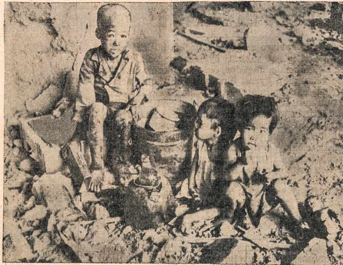
Trys išbadėjusieji ir sužeisti Philipinų vaikai, kurių motinos liko karo auka, kai Japonai traukėsi iš Manilos.