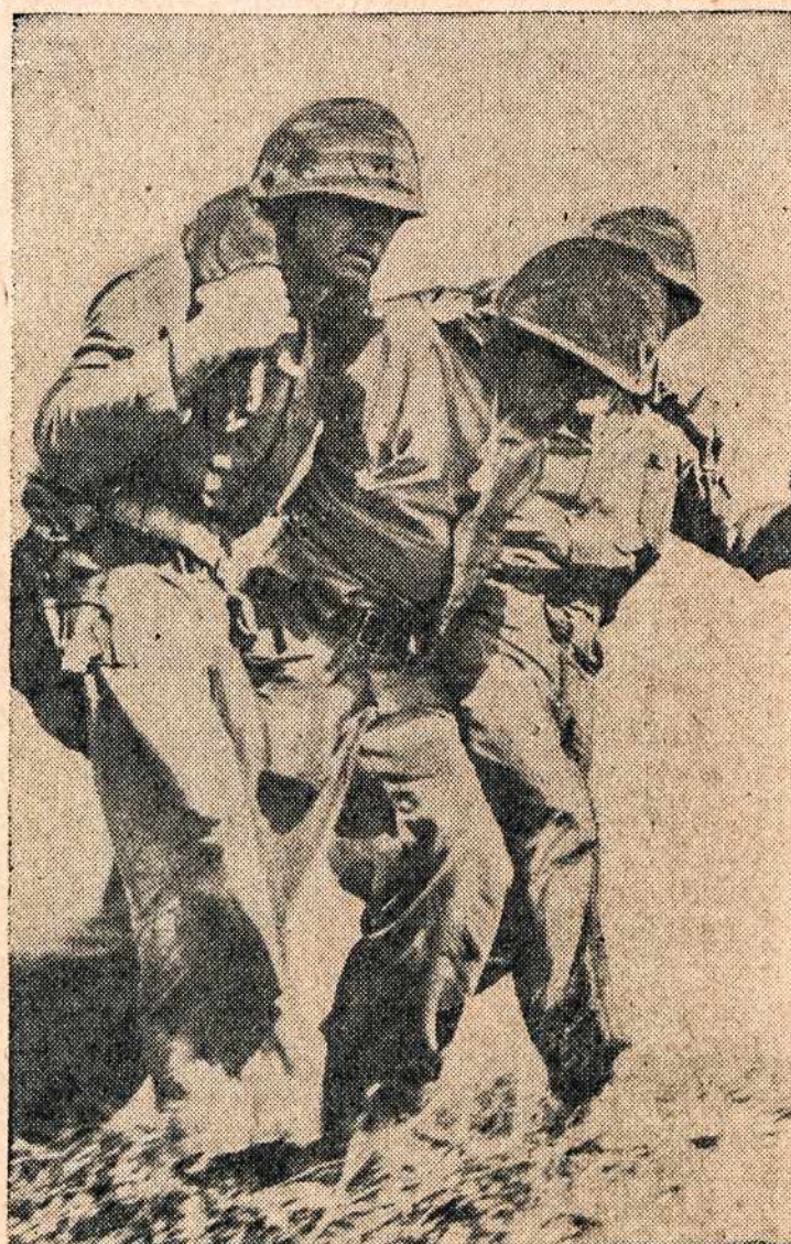
Vedamas brolis marinas, kuris buvo sužeistas sunkiose su japonais kovose, Iwo Jima, Pacifike.

Štai akyse pasirodė viena stambi ašara. Greit ją nubraukė, bet tuoj pasirodė antra, trečia,