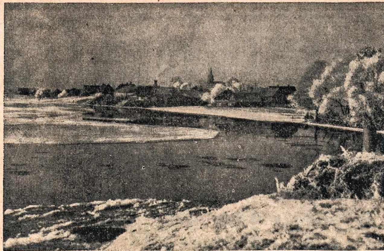
Poeto Maironio noras buvo — prikelti nors vieną senelį iš kapų milžinų ir išgirsti nors vieną žodelį iš senovės laikų! — Jis troško išklausti, kur tos kanklės auksinės Vaidilotų garsų; kad sudrebėtų kapai... ne kapai didžiavirų, bet užmigusių mūsų krūtinų — be idėjos... Gal suprastų tada, ką jiems Nemunas šneka, kai nakčia mėnuo teka; ko tos tamsiosios girios graudingai vaitoja? Apie ką bedūmoja?.. Poetas didžiujasi — ten užaugau, iškentėjau aš kančias visas ir pamėgau, pamylėjau vargdienio dūmas.

leidimai. Pastarame, penktame, dainų skaičius pristatas iki šimto.