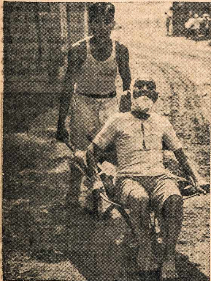
Sužeistą Philippinietį Maniloj, laike kovų su japonais, kaimynas veža į Amerikiečių Medikale stotį.