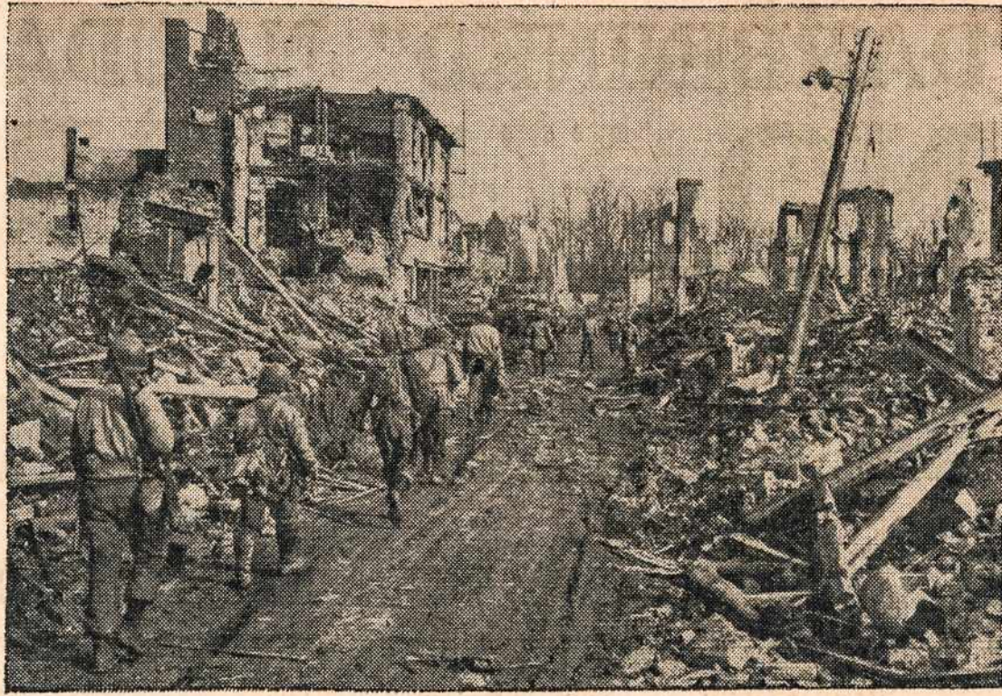
Po smarkaus bombardavimo vokiečių miestelio Juelich, amerikiečiai atsargiai žygiuoja tēmūdami ar nepasimatys kur kokio likusio snaiperio. Galima pastebėti kokia tragiška scena palikus — tik krūvos griuvėsių.