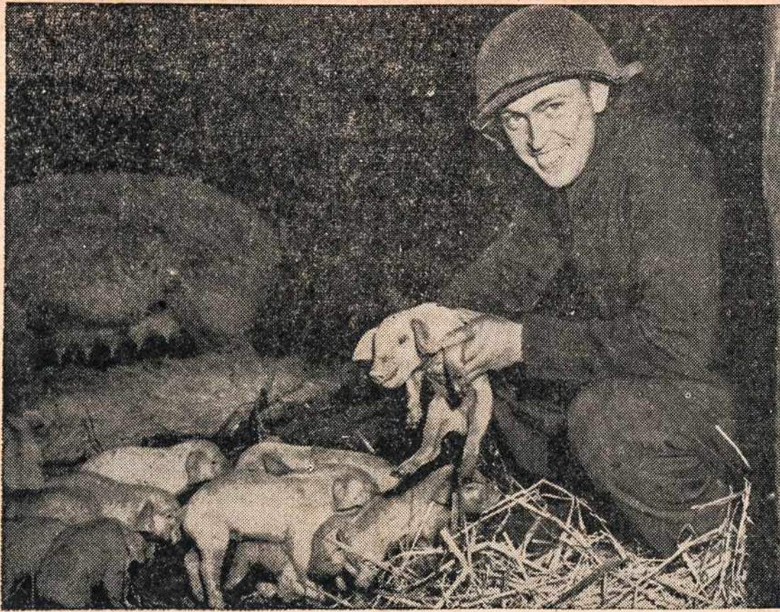
Amerikietis karys išgyiavęs į Sindorf, Vokietijoje, surado gražių kiaušinių. Jis sako, kad kiaušelis visur atrodo kaip kiaušelis ir jauniklis iškepus būtu tik vienas malonumas užkasti su obuolių košele.