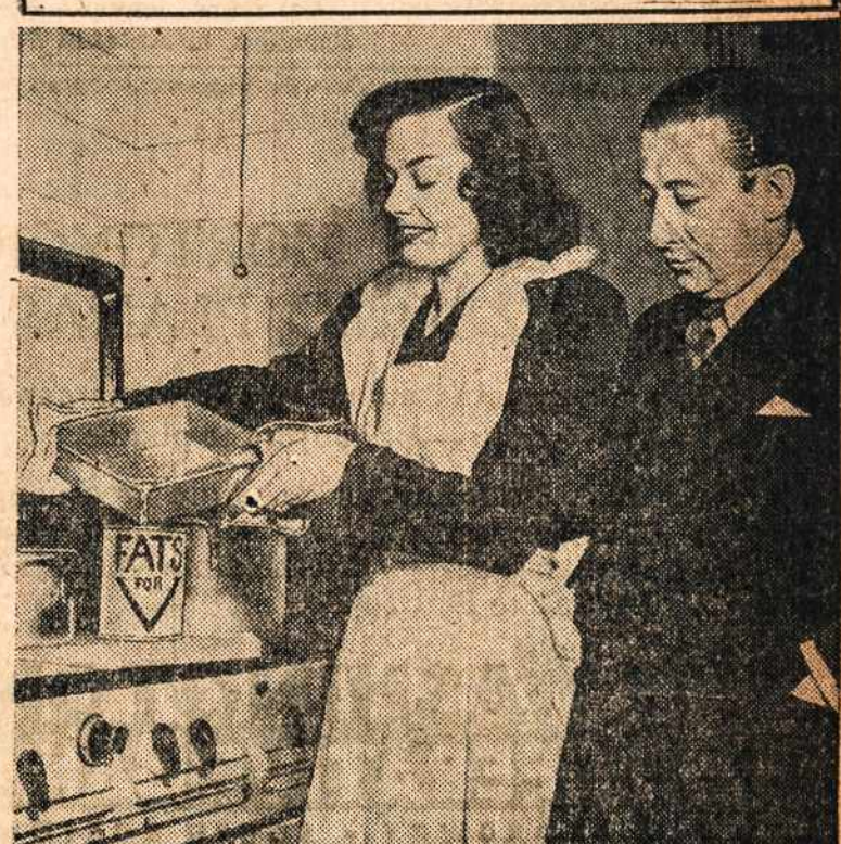
Billie Rose, New York nightclub owner, and theatrical producer, helps his wife, Eleanor Holm salvage used cooking fat. Any time—all the time, the Rose's say—is the time to save used fat. It's needed now more than ever.