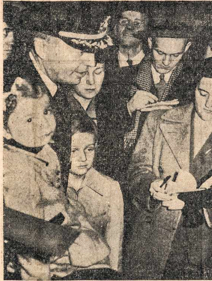
Commander Harold E. Stassen pasakoja laikraštiniams apie savo užsibrėžimą, kad jis sieks visuomenės nuomonės dėl daromų taikos žygių. Jis yra buvęs Minnesota gubernatorium ir jam tik ką sugrįžus iš Washingtono, kai jį patiko šeima, patiko ir laikraštiniškai St. Paul stotyje.

Popiežius Pijus XII niekad nėra kalbėjęs apie neapykantą arba kerštą arba sadistinį sunaikinimą, kaip kad kalba totalitarinių valstybių vadai. Jis kalbėjo ir kalba kaip vyriausias tėvas ir Krikščioniškos civilizacijos globėjas.