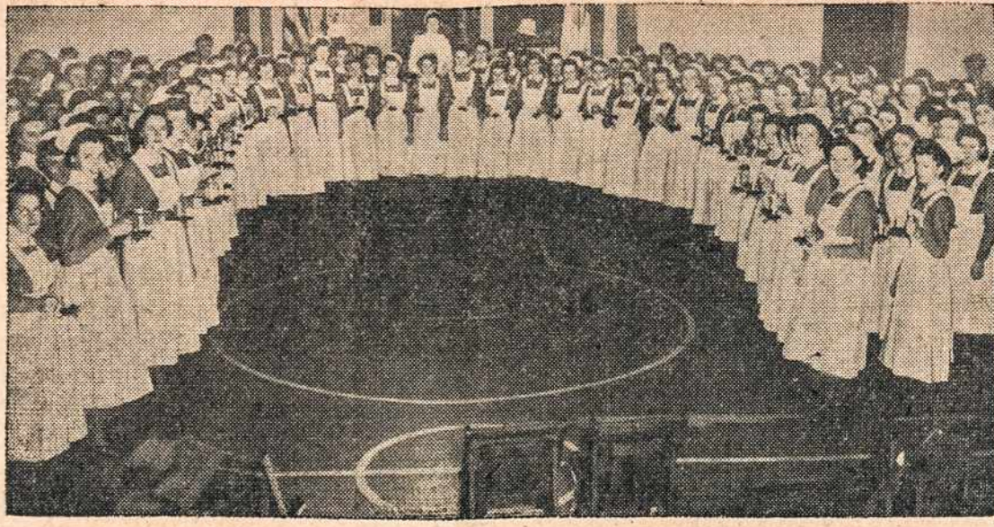
Michael Reese Hospital, Chicagoje, slaugės, turi savo "žvakės uždegi- mo" ceremonijas. Jos visos įstojo į U. S. Cadet Nurse Corps, kad prisidė- jus darbu karui laimėti ir gelbėti sužeistuosius.