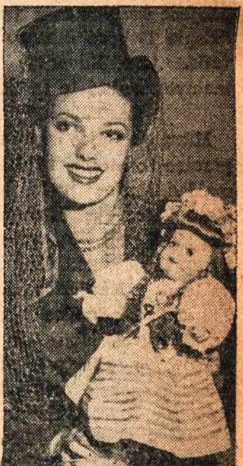
POSTWAR PLANNING — When Hollywood's lovely Linda Darnell, in Pittsburgh recently on a bond sales tour, revealed that her first postwar project would be a baby, members of Pittsburgh War Finance committee presented her with doll dressed in Polish costume.