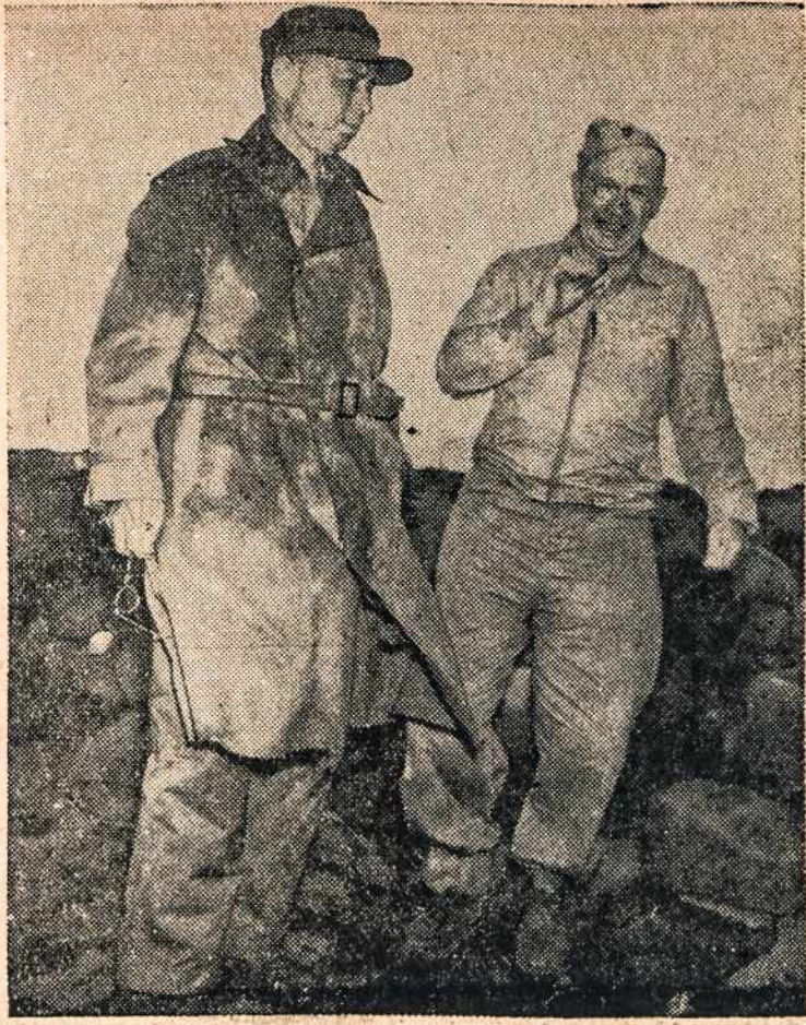
Marinų vadai Iwo Jima saloj, dešinėje — Lt. Gen. Hollan M. Smith, Commander of Fleet Marine Force in Pacific area, ir Maj. Gen. Clifton B. Cates, commanding the 4th Marine Div.

mano, kad kompeticijos bei ekonominio lenktyniavimo sistema reikia pakeisti "ekonominiu planavimu". Bet ar gi tai ne traginga, kad mes beplanuodami padaryti ko daugiausia gero, savo nepdirumu atsiekiame kaip tik griežtai priešingų pasekmių? Savo tikslui atsiekti "planuotojai" nori sutverti ko didžiausią pajėgą, sukoncentruotą ko mažiausioj asmenų grupėj. Demokrati-tija tam priešinasi. Čia tai ir kyla susikirtimų tarp demokratijos ir planuotojų.