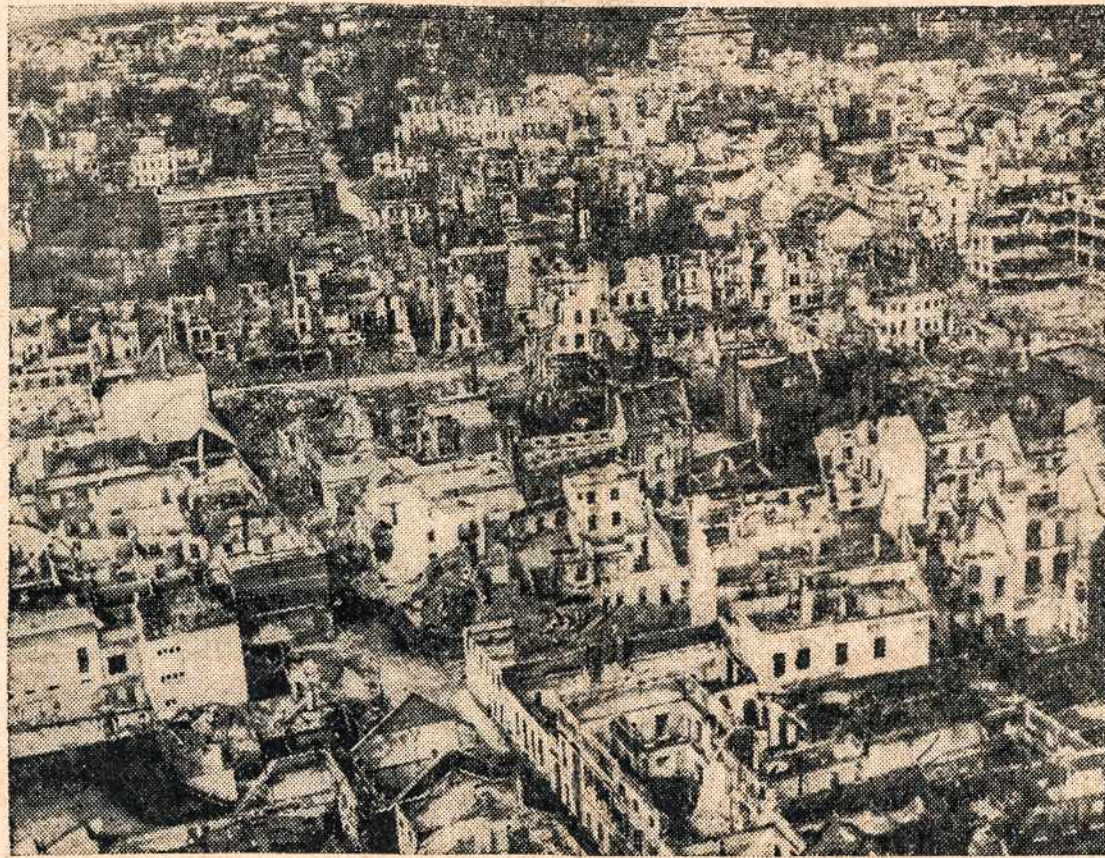
Garsios industrinės vokiečių Ruhr srities, Dusseldorf miestas, kuris skaudžiai subombarduotas laike Alijantų puolimo.

Visi kviečiami darbuotis ir melstis, kad Lietuvių Maldos Diena Katedroje, Bostone, pavyktų. Parodykime savo malda ir darbais, kad nuoširdžiai norime pagelbėti pavergtai Lietuvai ir pasauliui teisingos ir pastovios taikos. Laikas trumpas. Visi ruoškitės ir dalyvaukite.