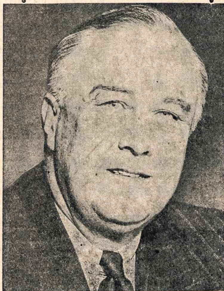
Prez. Franklin D. Roosevelt