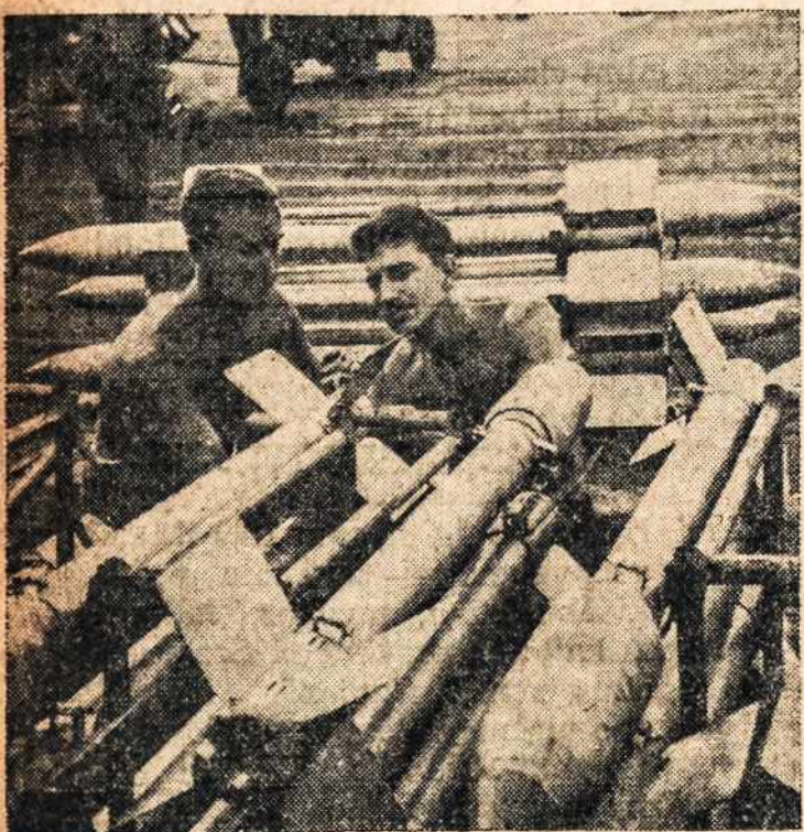
Dėdės Samo Laivyno kariai grupuoja bombines raketas, kuriomis norima užfunderi japonų laivynui iš karo lėktuvų.

MT. WASHINGTON CO-OPERATIVE BANK 430 BROADWAY • SOUTH BOSTON