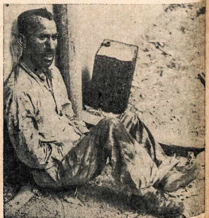
Šitas Philipinietis buvo gyvas palaidotas laike Manilos išvadavimo, kai jis buvo užgriautas slėpykloje. Po iškasimo iš griuvėsių jis sėdi saugiai ir ilsisi.

Knygutė, kurioje randasi labai gražūs skaitymai kiekvienai dienai per visą gegužės mėnesį. Knygutė buvo išleista šv. Kazimiero Draugijos, Kaune. Ji yra 184 pusl. Kaina 40c. Užsisakydami šią "Gegužės gražių muzikališkų duetų ir solo" knygutę, prisiųskite: "Darbininkų dainelių. Tikrai bus šaunus ir linksmas. O gal jau ir karas bus pasibaigęs, tai ir daugelį svečių site.