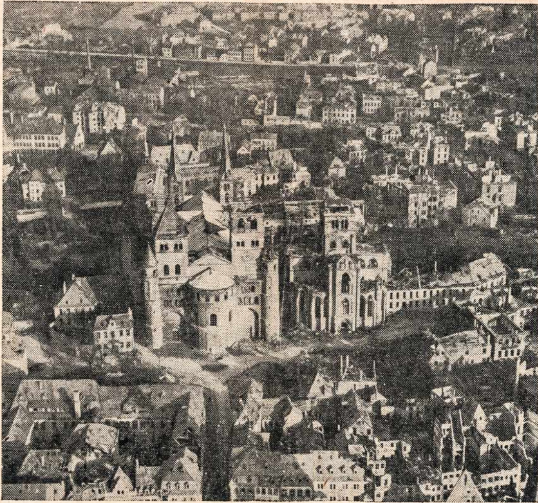
Nors šitas Trier miestas ir labai buvo bombarduotas Vokietijoje, bet po to, kaip miestas buvo okupuotas ir šitas vaizdas pagautas iš oro, atrodo, kad daug pastatų ir bažnyčios dar stovi.