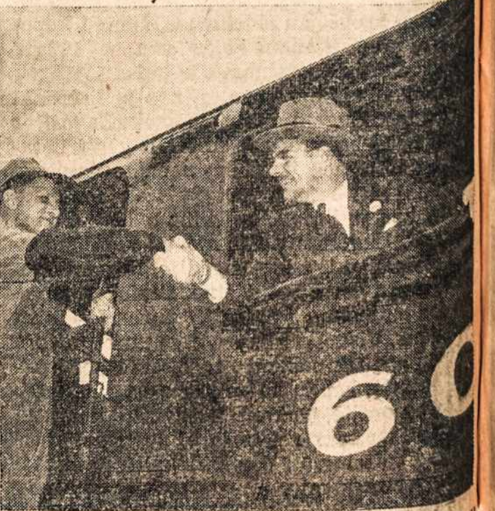
Gubernatorius Thomas E. Dewey, sveikinasi naujai paleisto į bėgius garvežio inžinierium, New York Central. Tai buvo laike dedikacijos to garvežio ceremonijų. Naujasis traukinys traukia 100 mylių valandą.