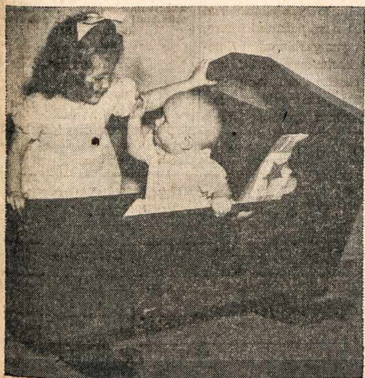
Mažoji nori būti didelė mama mažajam kūdikiui.