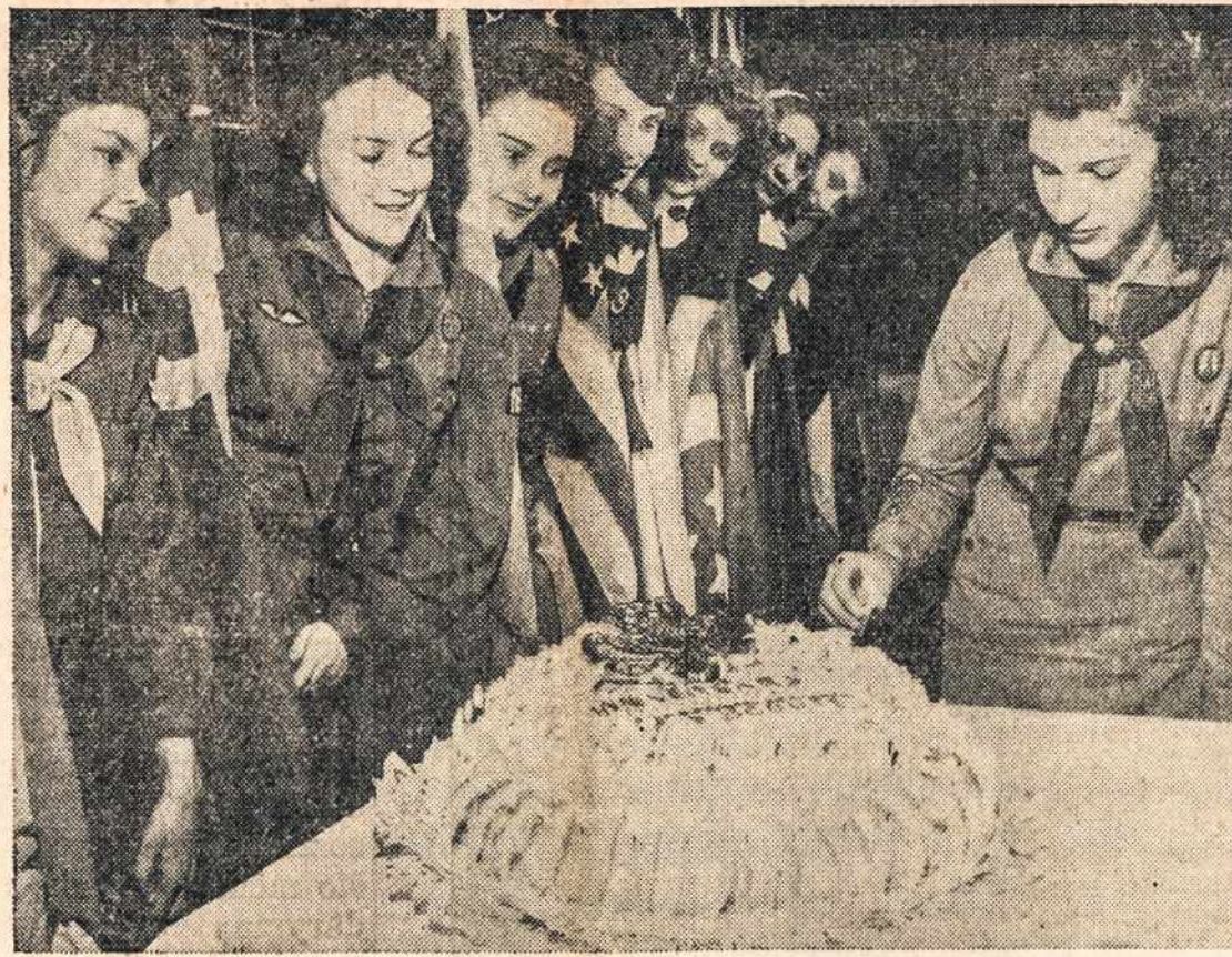
Chicagos skautės laike savo 33-jų metų gyvavimo sukakties minėjimo uždega žvakutes ant puošnaus torto. Šios skautės reprezentuoja įvairias tautas.