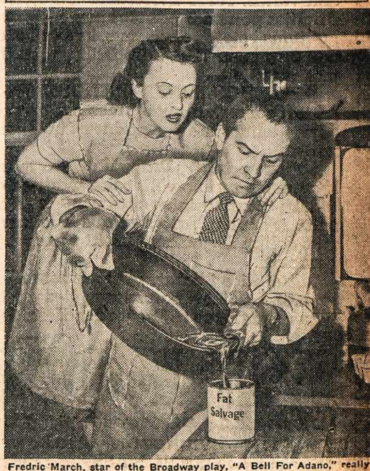
Fredric March, star of the Broadway play, "A Bell For Adano," really concentrates as he pours used cooking fat into the salvage container while his wife, Florence Eldridge, speculates what low point meat cuts those used fat points will buy!