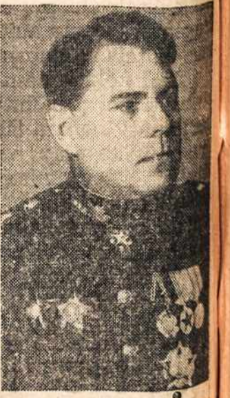
FORMER CHIEF of the General Staff of the Red Army, Marshal Alexander M. Vassilievsky is now in command of the Third White Russian Army. Announcement was made by Marshal Stalin, Marshal Vassilievsky directed the siege of Sevastopol in May, 1944