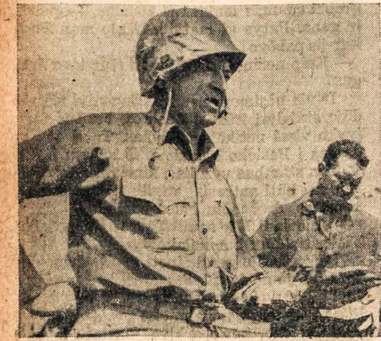
Marinų Majoras Gen. Graves B. Erskine, trečios Marinių Divizijos komandierius, seka marinų puolimus Iwo Jima saloj. Dabartiniu laiku toji sala užimta, nors amerikiečiams kainavo labai brangiai.