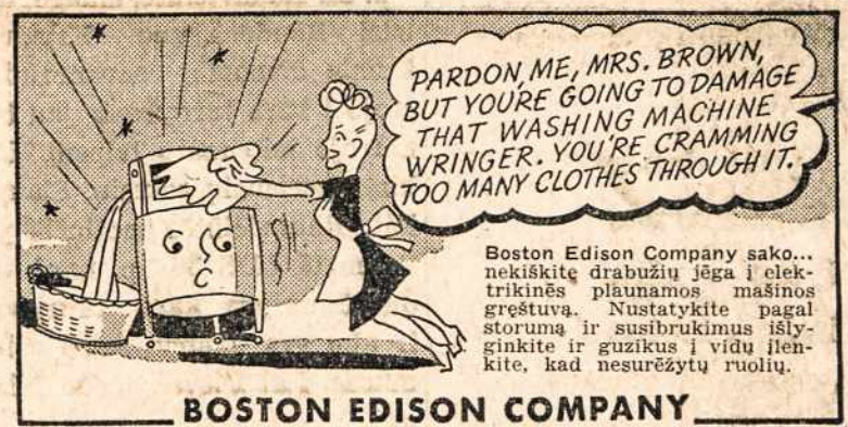
BOSTON EDISON COMPANY