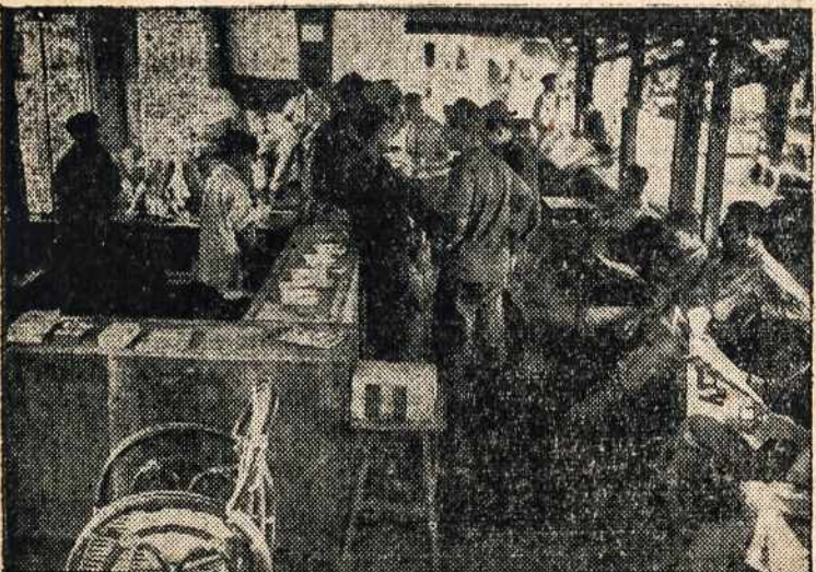
TIME OUT FROM BATTLE—American fighting men read and relax at a Red Cross canteen and club in the Rosario sector on Luzon. A Filipino volunteer acts as librarian and dispenser of gum, candy and recreation supplies brought in by Red Cross field men.

Knygutė, kurioje randasi labai gražūs skaitymai kiekvienai dienai per visą gegužės mėnesį. Knygutė buvo išleista šv. Kazimiero Draugijos, Kaune. Ji yra versta Kun. Pr. Žadeikio. Turi 184 pusl. Kaina 40c. Užsisakydami šią "Gegužės Mėnuo" knygutę, įdėkite 40c į konvertą ir prisiųskite: "Darbininkas", 366 W. Broadway, So. Boston, Mass., ir tuojau ją gausite.