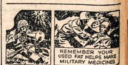
REMEMBER YOUR USED FAT HELPS MAKE MILITARY MEDICINES

Sia proga nuoširdžiai sveikinam Sv. Pranciškaus draugijos valdybą ir narius ir iniciatorius, kurie dar yra gyvi, ir linkim sulaukti progos švesti dar daug jubiliejų. Taigi ilgiausių metų, geriausių laimės sutraukti visus šios kolonijos vyrus po savo vėliava. M.