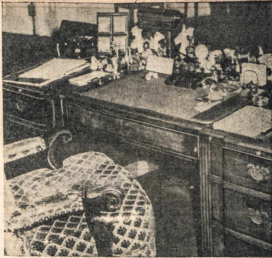
Baltuose Rūmuose, Washington, valandėlei buvo palikęs tuščias prezidentinis kambarys. Šiame kambary miręs Prez. Rooseveltas planavo tautinę ir tarptautinę politiką.

Bet gi ir šiame dalyke, kaip ir visuose kituose, motinos kasdieninis rūpestis, ne mažėja, bet didinasi. Kasdieninio jos darbo pasidaro tik ilgesnė tąsa. Jos pareiga rūpintis savo vyrą ir visa šeima tol, kol bent vienas žmogus rasis jų namuose. Tas visuomet neišvengiamai atsitinka dėl to, kad žmona visuomet kaip yra sakoma, yra „namai“. Šeima palaiko tautą, o pastaroji — šeimą; gi visa Krikščionybė, — ilsisi ir klesti