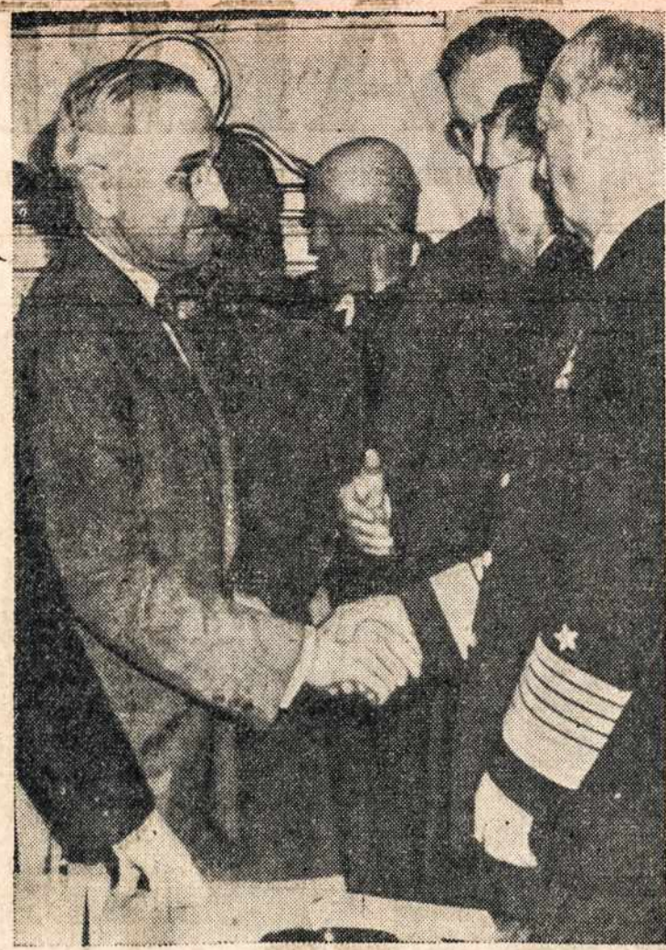
32-tras Prezidentas, Harry S. Truman sveikinamas Admirolo Leahy, Washington, kaip tik jis priėmė prielaidą, kaip šios šalies Prezidentas.

The cause of your beloved fatherland, my dear Lithuanian friends, may appear hopeless.