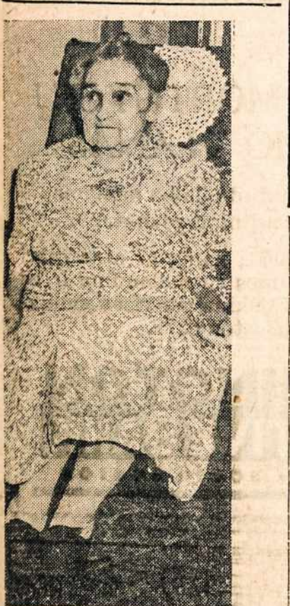
MOTHER — Mrs. Martha E. Truman who lived to see 61-year-old son become the 32nd President of the United States, is shown at her home in Grandview, Mo. Mrs. Truman's homespun philosophy has greatly influenced the President.

"Kirmėlaitė į tai nieko neatsakė. Tik žirnius go-