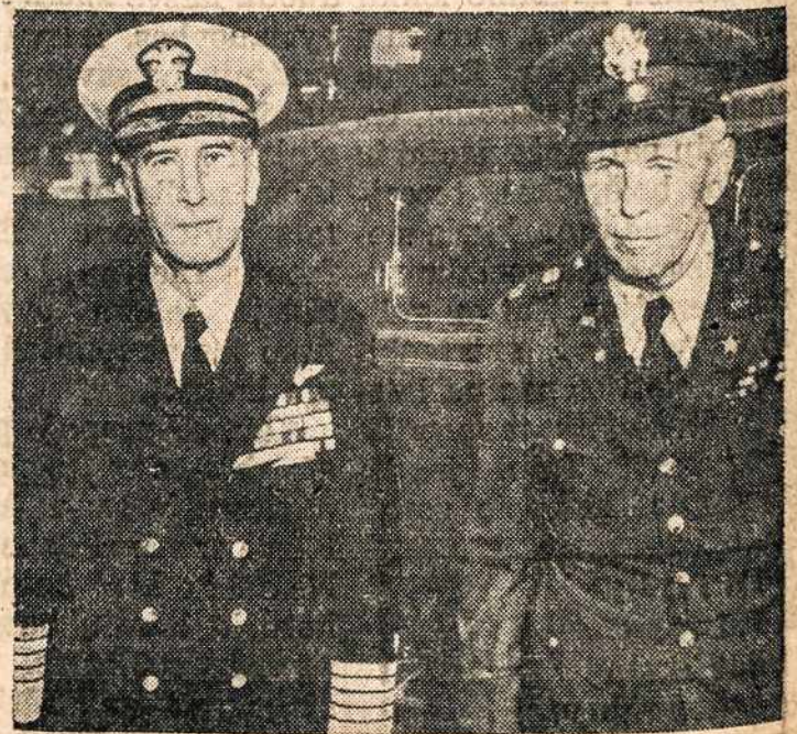
Admirolas Ernest King ir Generolas George C. Marshall, kelyje į konferenciją su Prez. Truman.