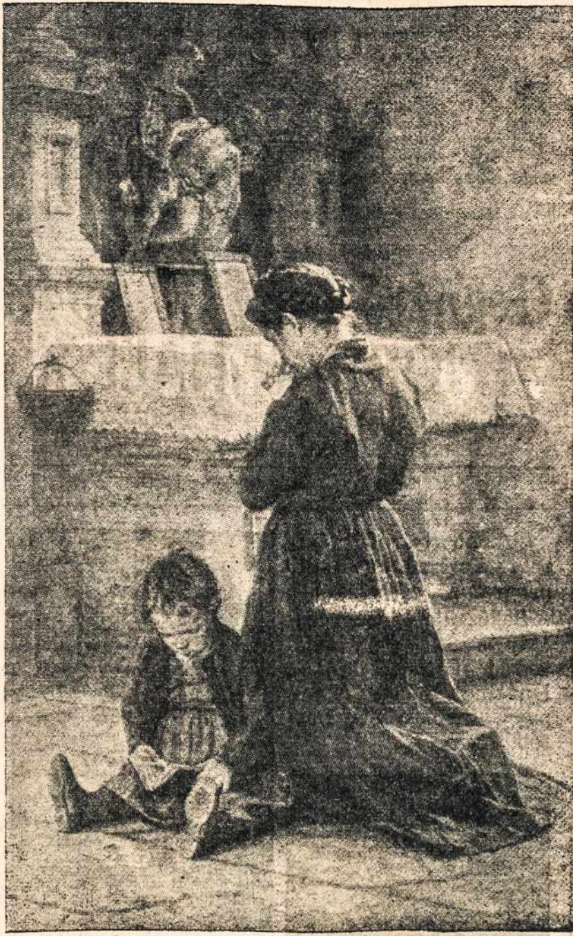
Motinos meilės begalinė... Jos širdis jaučia kiekvieną pavojų; jos širdis jaučia kiekvieną jos vaikų laimę ir nelaimę... Štai mieloji motinėle suklupus ir valandėlei susikaupus maldauja Aukščiausiojo, kad jos mylimasis sūnus ir duktė karo audrų blaškomi būtų Apvaizdos globoje.

Štai, atėjo medžioklės diena. Suaidėjo ragų balsai, sūnų lojimai, arklių žvangimai, ginklių skambėjimai. Visi žvėrys išsigandę bėginėjo. Liūtą į kilpas įvyjo, surišo ir žandus surakino; briedžiui ant ragų virvę užmetė, sulaukė ir gyvą nusivedė; šernui iltis ir galvą su kulkomis sutrupino; arelis pašautas ant žemės nukrito. Tik lapė gudrioji kalno urve išliko gyva. Tai pasaka, bet iš jos galima pasimokyti, jog nesame taip galingi prieš skelbiamus bėdrus pavojus.