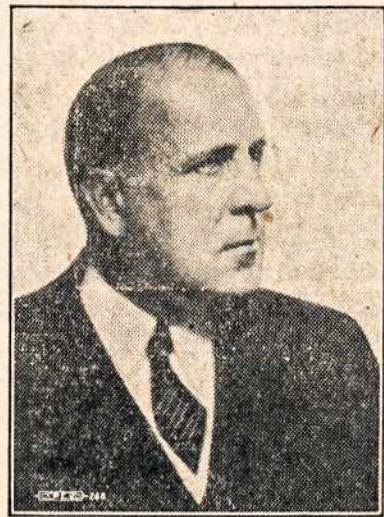
Senatorius David I. Walsh