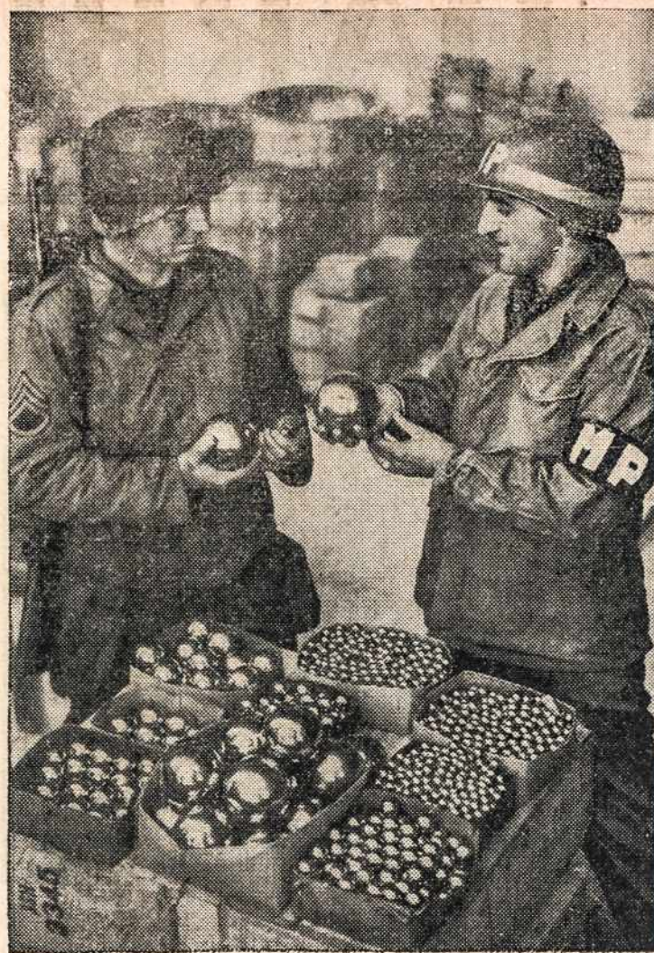
Militariai policininkai egzaminuoja įvairaus dydžio "ball bearings". Šios metalinės bolės buvo pagamintos nacių dirbtuvėse karo reikalams ir šiuo momentu jau randasi mūsų kariuomenės žinioje.

New England Historic Genealogical Society, The Catholic Historical Review, The Presbyterian Historical Society, The Holland Society of New York, ir kitos istorinės organizacijos pažadėjo knygą recenzuoti. Ann