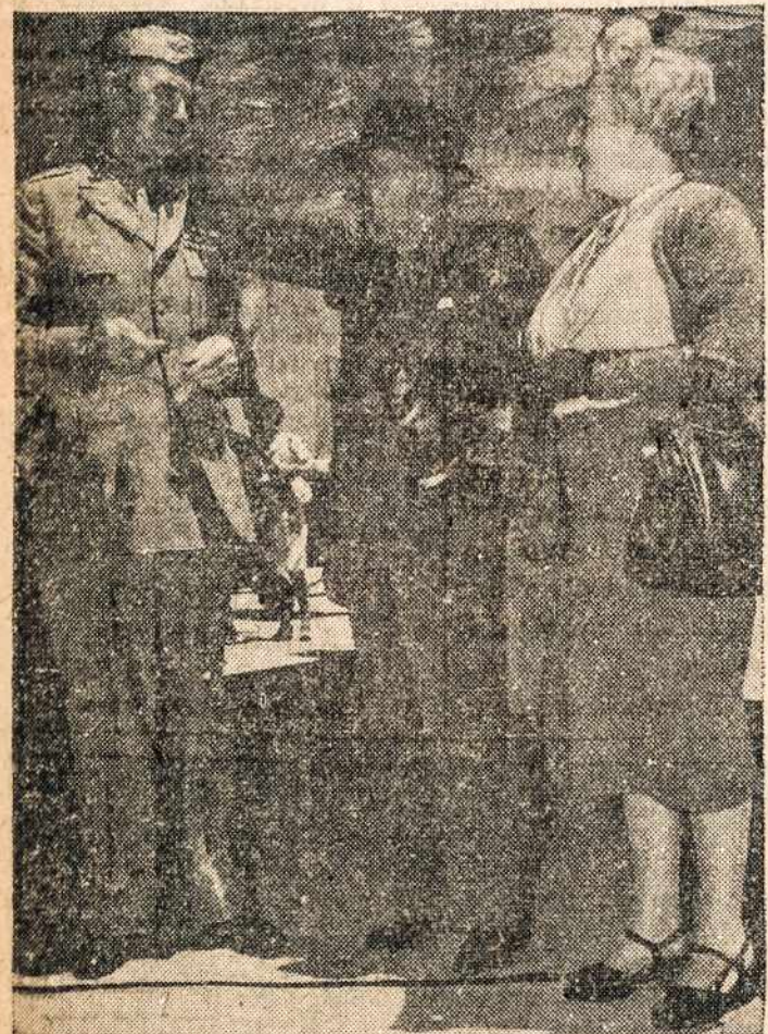
Brazilijos Užsienių Reikalų Ministeris su žmona kelyje matomas kaip vyko į Tautų Konferenciją, San Francisco.