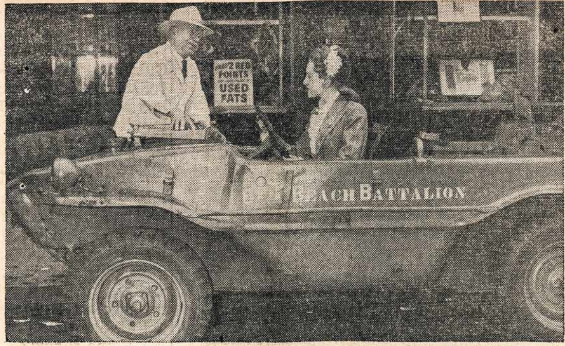
Šis automobilis tai buvęs nacių specialis 'jeep'. Dabartiniu metu jis tarnauja New Yorko mieste rinkimui riebalų, iš kurių gaminama sprogstamosios medžiagos karui laimėti.

Nemažas muzikos mylėtojų būrys vyksta į Darbininkų radio KONCERTĄ, sekmadienį,