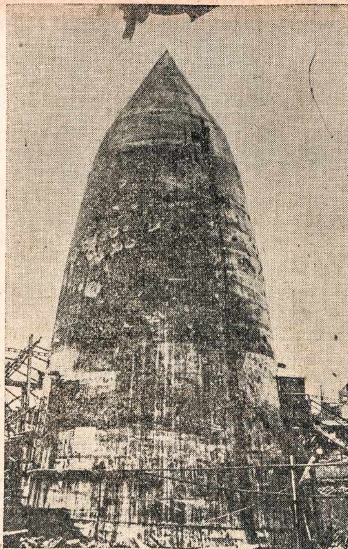
Naciai besigindami nuo bombardavimo pastatė vi-sokių pastatų. Štai ir šis matomas slėptis nuo bombų pastatas irgi buvo vienas iš daugelio, kuris vistiek bu-vo bombų apgriautas.

Stockholm (LAIC) — juos išrūšiuoti ir kas rasis Tiek lietuviai tremtiniai kaltas pagal tai nubausti". (370), tiek latviai (apie 5000), tiek estai (per 20,000), gali pasidžiaugti šve-dų socialdemokratų spauda — socialdemokra-tai sudaro daugumą Riks-dagų visuomenės ir įstaigų palankumu ir rūpesniu. Bet švedų komunistų spauda žiauriausiai puldi-nėja pasprukusias vokiš-ko-rusiška imperializmo baltiečius pabėgėlius iš-aukas. Komunistai gyvu-liškai koluoja atbėgėlius ir reikalauja, kad jie visi bū-tų gražinti Sovietų Sąjun-gon, NY DAG, vyriausios vietinės Maskvos dūdos. Suprasdamas kur tas pa-tezė yra, kad ne švedų rei-sakymas siekia, Riksdago kalas yra spręsti kas tarp-tų pabėgėlių gali būti "fa-sistas" ar "karo nusikaltė-lis": juos visų sąrašius, kad švedų socialdemokra-sovietų valdžia "mokės