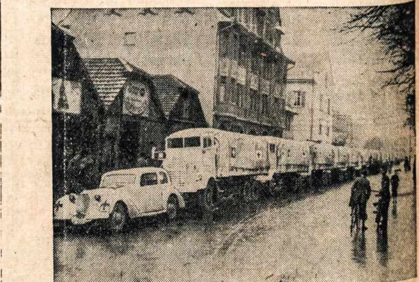
GERMANY—A Red Cross prisoner of war supply truck convoy about to cross the Swiss border into Germany. Trucks, supplied by American, British and Canadian Red Cross societies and by Allied military authorities are now used by the International Red Cross Committee to supplement scarce railroad rolling stock, thereby assuring feeding of Allied prisoners of war in Germany. Gasoline and other supplies are also supplied by the national Red Cross societies. The trucks are painted white to increase their visibility and insure protection. They carry the emblem of the Red Cross and the flag of the Swiss Federation.

Villa Joseph Marie, Holland Road, Newtown, Bucks Co., Pa.