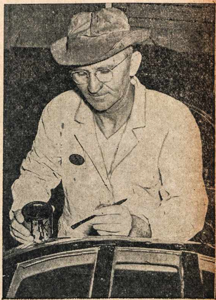
Šis Karo darbų darbininkas sako: reikia melstis ir dirbti, kad karą laimėti. Jis tą ir daro.