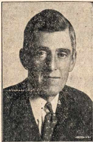
Senatorius Leverett Saltonstall