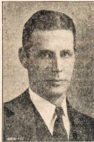
Gubernatorius Maurice J. Tobin