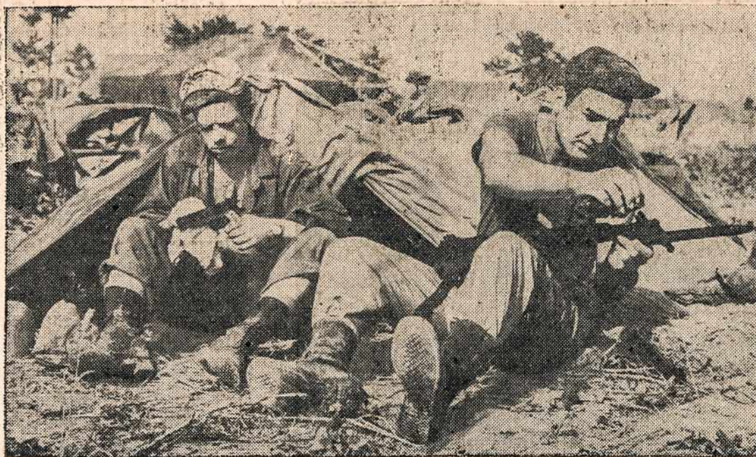
Okinawa saloj amerikiečiai netik žiauriai kaujasi fronto linijose, bet ir jau užimtose vietose pasidalinę po laukus ir kalnus saugo, kad nenusileistų japonų parašutininkai už fronto linijų.