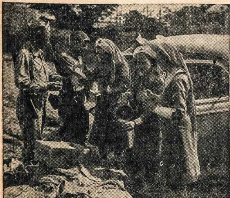
CANTEEN SERVICE TO FLOOD FIGHTERS — Red Cross canteen workers provide coffee and sandwiches to soldiers guarding prisoners at war sandbagging Pineville, La., levees during April floods.

Kita Sovietijos milijonierių rūšis susidaro iš filmų ir teatrų artistų. Filmų direktoriai, kaip antai Sergej Eiznotin, Vsevolod Pudookin, broliai Vasiljevai, skaitosi tokiais pat milijonieriais — galinčiais, kaip ir Hollywoodo bosai. Maskvos ir Leningrado tenorai — Kozlovskij, Lemechov, Konstantinovich, Kečkovskij ir baritonai Pirogov ir Riezin gauna po keliatą tūkstančių rublių už kiekvieną pasirodymą. Randasi milijonierių išradimų ir inžinierijos srityse: Aviacijos generoliai Iljušin ir Lavočkin ir antitankinių kanuolių išradė-