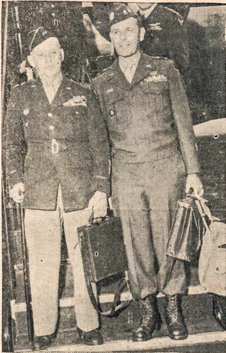
Aukštieji Amerikos kariai sugrįžta iš Europos laimėję pergale.