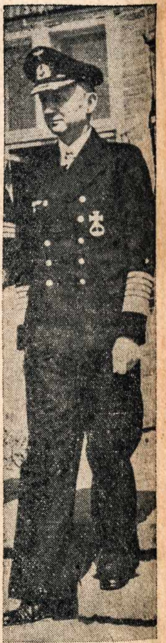
FUEHRER NUMBER TWO, Adm. Karl Doenitz leaves the headquarters of the vanquished German High Command at Flensburg. The self-appointed successor to Adolf Hitler has changed the theme of the former dictator's policies.