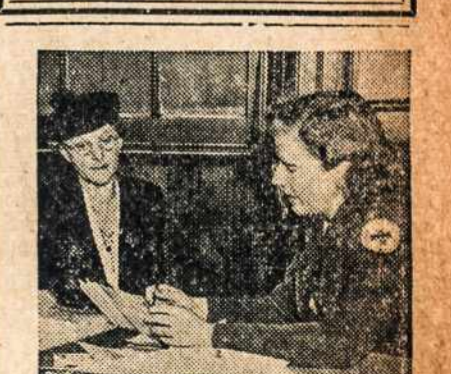
IS THERE A PROBLEM in the family of the serviceman or veteran? The American Red Cross Home Service department operates especially to assist these families, and to keep up the contact between the hometown clan and the fighting man. Here a Home Service worker offers guidance to a member of a serviceman's family.