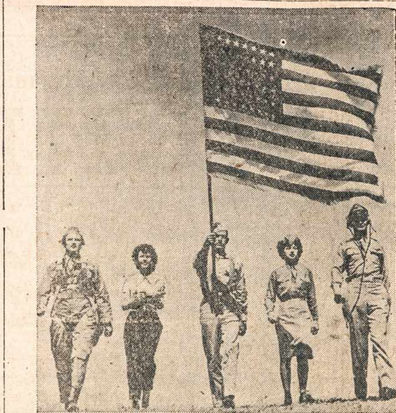
1945 metų Karo dvasia. Šalia armijos, laivyno ir oro jėgų karių stovi karė moteris ir moteris darbininkė.

Taip nerangiai įsivėlęs į girios vagystę ir negarbingą susirėmimą su ponais, Andrius buvo labai susikrimtęs. Jo riteriška savimeilė degė dėl tokio negarbingo įvykio.