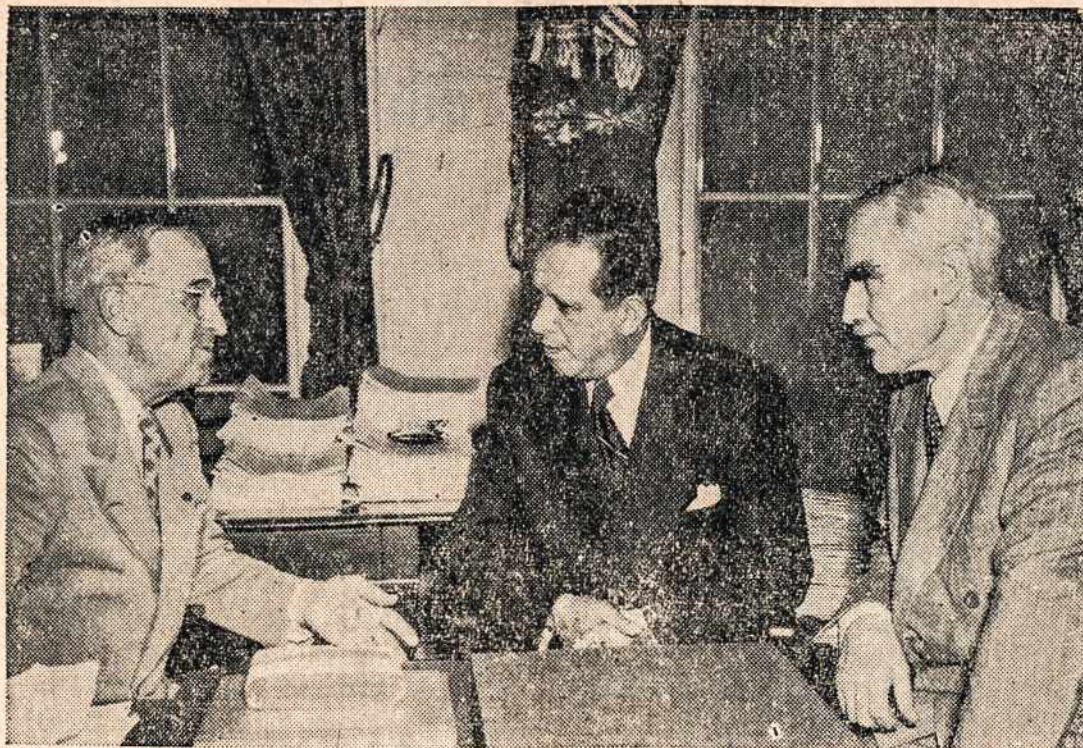
Prezidentas Truman, kairė, ir einąs State Sekretoriaus pareigas Joseph Grew, dešinė, konferuoja su Meksikos užsienių ministru, Meksikos pretenzijų prie žemės El Paso, Texas, sklypo klausimu.

Tas didysis altorius turi du šalinus padestalus su geltonais iš Siennos marmuro protarpais. Viršutinės protarpių dalys iš Fleur de Peache marmuro susi-