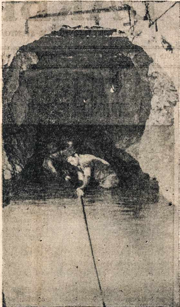
Karo žinovai geologistai surado, kad Guam saloj yra po geroku žemės sluoksniu gero gėrimui vandens. Šie vyrai jau pasiekė norimą vietą, išsikasę gilų tunelį.