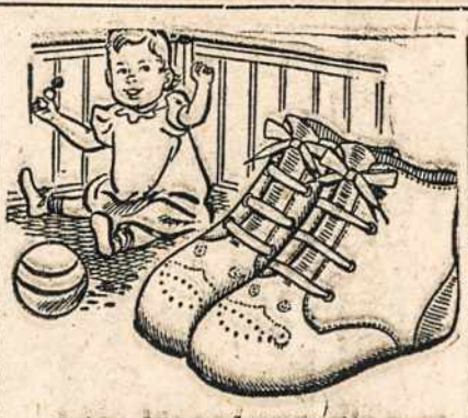
Jeigu Jūs padovanosite porą batukų šiam mažiui, ir jis bus Jums dėkingas.

Lietuvos žmonės dėl baisaus karo ir okupantų žiaurumo buvo priversti slapstyti ir bėgti į svetimą šalį, kad išgelbėtų savo gyvybes. Apskačiuojama, kad Europos įvairiose šalyse — Amerikos ir Anglijos zonoje yra apie 350,000 lietuvių pabėgėlių, kurie šaukiasi pagalbos ir toji pagalba jiems desperatiškai reikalinga, kad išgelbėtų savo gyvybes nuo bado, šalčio ir ligų.