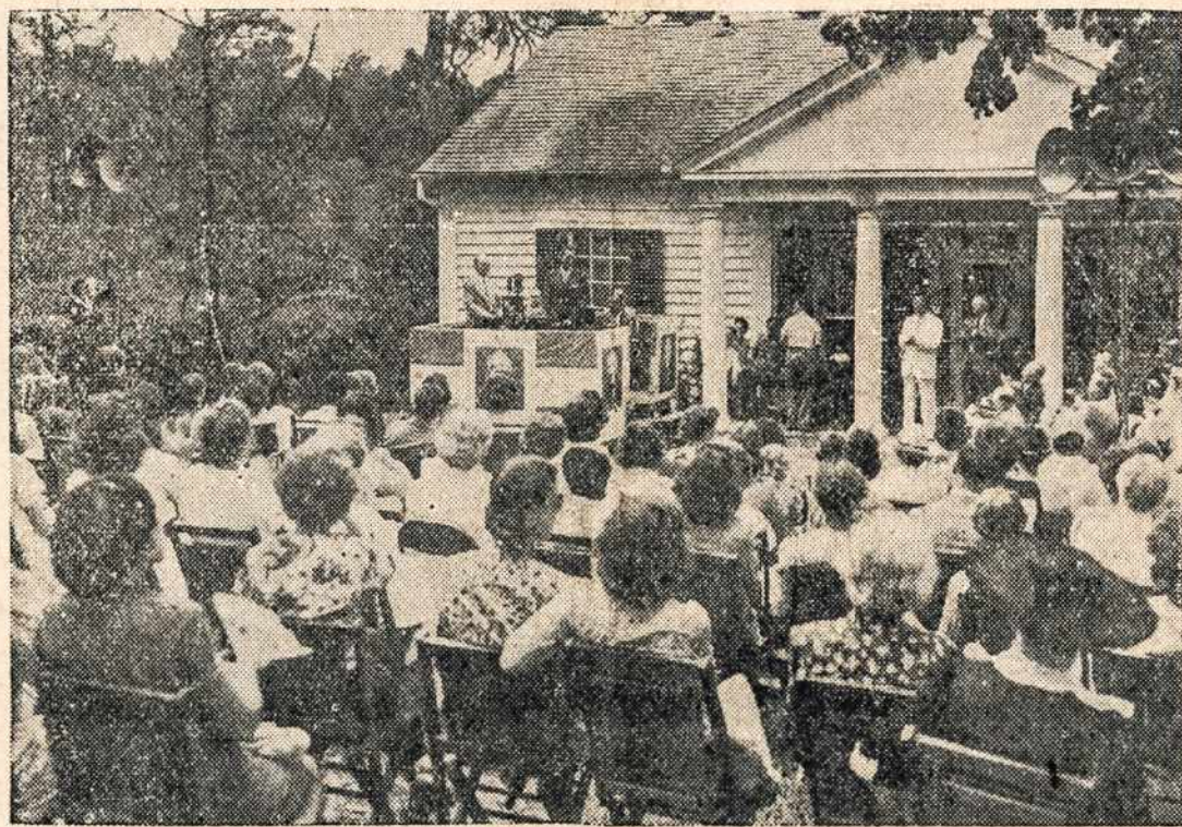
Warm Springs, Ga., piliečiai, kai pagerbimui Rooseveltui buvo išleista dviejų centų pašto ženklas padarė iškilmes to įvykio ir tuomi pagerbė mirusį prezidentą, kuris ten dažnai lankydavosi.

Kalbėdamas apie Potsdamo nutarimus, priminė, kad Karaliaučiaus perleidimas Rusijai reikėtų palaidojimą Nepriklausomos Lietuvos, Latvijos ir Estijos.