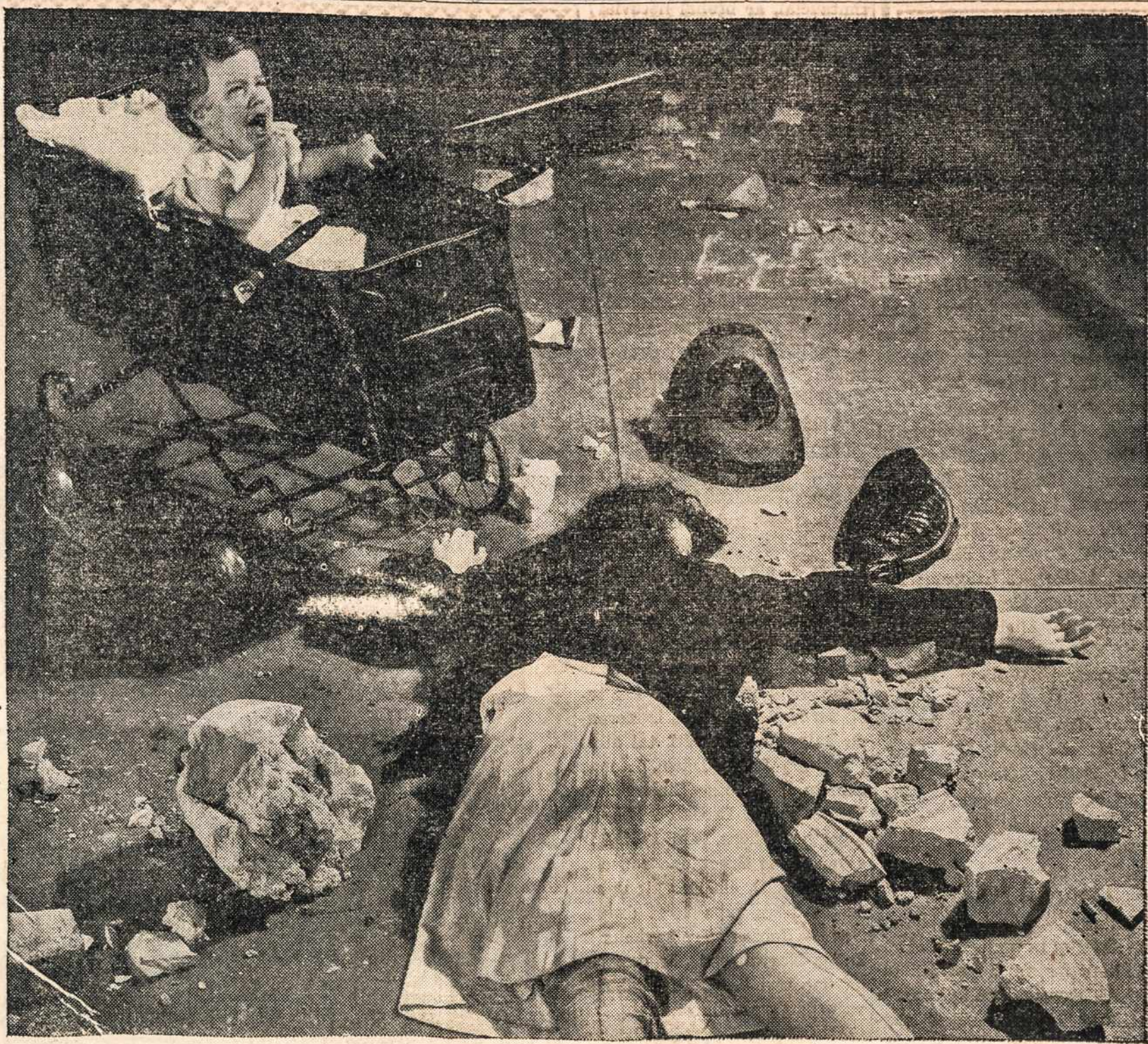
Tarp žuvusių milijonų žmonių, žuvo ir ši motina — gal jūsų artima, ar pažįstama... Liko kūdikėlis. Jį kam nors reikia globot, išlaikyt. BALF siunčia nuo karo nukentėjusiems lietuviams pagalbą. Siunčia pagalbą ir kūdikėliams. Siunčia viską ką iš jūs gauna, kas galima naudoti. Rinkite, patys aukokite drabužius, avalynę ir patalynę ir siųskite į United Lithuanian Relief Fund Warehouse, 101 Grand Street, Brooklyn 11, N. Y.