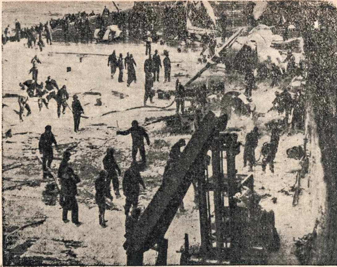
Gesinamas gaisras ant laivo USS Enterprise, kurį japonai skelbė net šešiais atvejais esant subombarduotu ir nuskandytu. Tai vienintelis Pacifiko karų orlaivių - nešėjas užsitarnavęs Presidential Unit Citation. Jis numušė prieš 911 orlaivių ir nuskandino 71 laivą. Jam besikaujant su priešiu susilaukta ir karo pabaigos.

švietimą, kad jie sudarytų teisingą ir pastovią taiką;