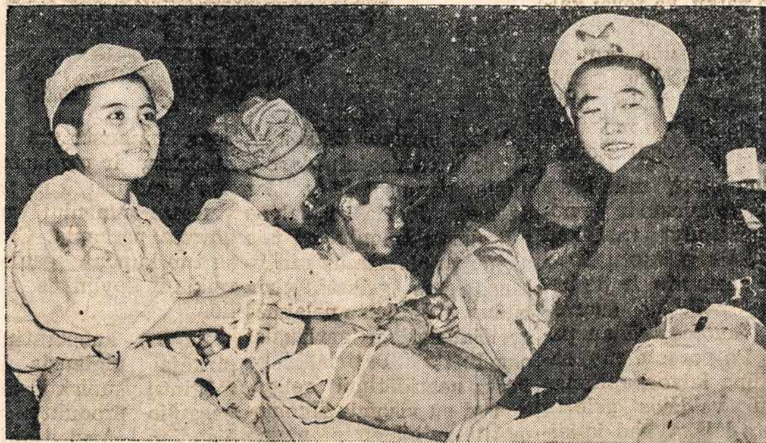
Japonai belaisviai paimti Okinawa saloj atrodo labai jauni. Bet jie sa-vo amžiaus nepasisako.

Prisimena garsusis rašytojas Ruskinas ir jo žo-džiai apie netiesą ir melą. “Niekad nebandykime skelbti netiesą. Nemašty-kime, kad vien tiesa yra nekenksminga ir kiti daly-kai mažmožis. Atstumk vi-są į šalį, jei nori būti ne-reikšmingu ir atsitiktinu; bet abelai imant melagystė yra biau-rūs suodžiai iš dūmų šulinio; ir daug geriau yra, kad mūsų širdys būtų išvalytos nuo tų purvų, nežiūrint kuri yra didesnė ar juodesnė. Nie-kas taip neduoda smūgio prietelystei, kaip susekima netiesos. Melagystė kerta į šaknis mūsų pasi-tikėjimo ir palieka savo žaizdą iki grabo lentos. Nebereikalo žmonės, ku-