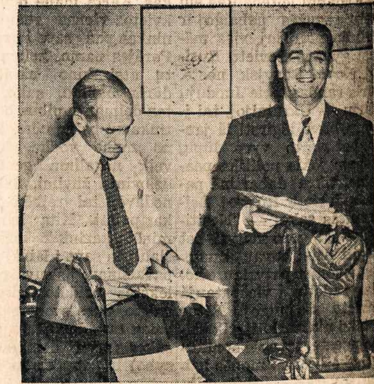
William O'Dwyer, (dešinėj) pasitraukė nuo prokuratoriaus pareigų Kings County ir kandiduos į New Yorke mayorus demokratų ir Amerikos Darbo partijų tikietu.