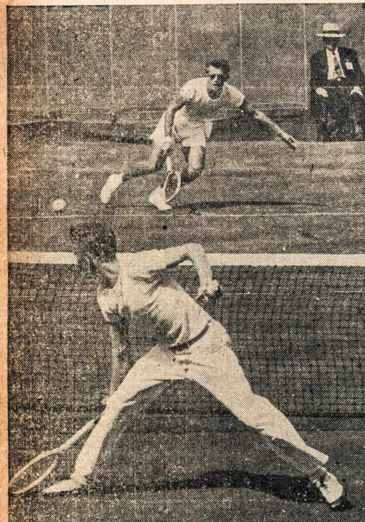
Tennis žaidėjai pačiame įkarštyje. Gražus ir malonus sportas. Jaunimui tikrai sveika pramoga. Sportas atitraukia mintis nuo blogo ir lavina prąta greitai orientuotei, taipgi mankšta fiziškai sveiku.