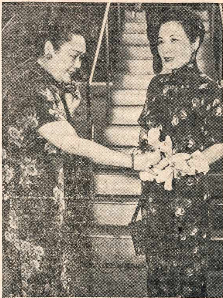
Generalissimo Chiang Kai-Shek žmonai atvykus į Washingtoną, viengentė įteikia jai gražų „corsage“. Abi pasipuošusios Kinijos tautiniais drabužiais.

Milžiniškoje savo daugumoje mes, Amerikos lietuviai, pritarėme visa širdžia tiems taikos principams, kuriuos Vakarų demokratijų vadai išreiškė Atlanto Čarteryje, pripažindami teisę kiekvienai pavergtai tautai atgauti savo laisvę ir, pasmerkdami svetimų žemių grobimus bei valstybių sienų keitimus be gyventojų sutikimo. Šituose pareiškimuose mes matėme išsigelbėjimo viltį mažoms, nekaltai karo vėsulos ištiktoms tautoms ir jų tarpe mūsų gimtajam kraštui, Lietuvai.