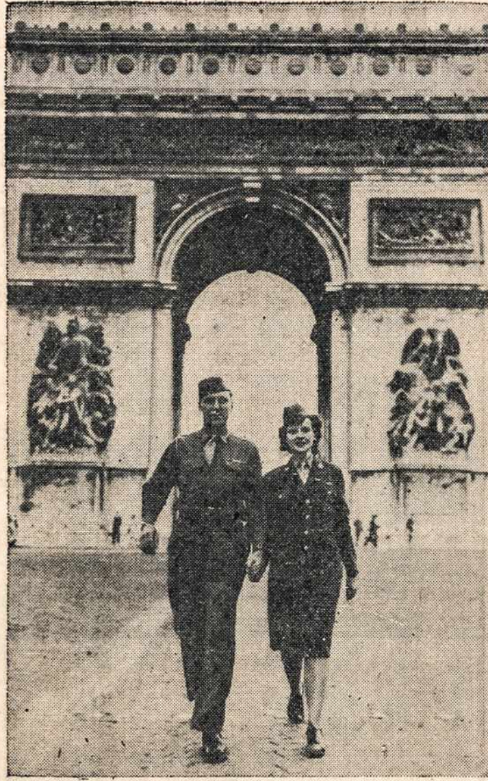
Prancūzijoje Dėdės Samo karių porėlė, kuri suskaičiavo, kad turi po 87 taškus. Diena iš dienos jie laukia savo eilės grįžimui į Ameriką. Sakoma, kad tai vienintelė vedusių porėlė turi tokį aukštą taškų skaičių.

Lisabona (LAIC) — Mūsų korespondentas praneša, kad portugalų spaudoje simpatinga mini Lietuvą. Tokie laikraščiai kaip "Voz", "Jornal do Comercio" ir kiti įdomaujasi Lietuva ir savo skiltyse pareiškia nusivilimo, kad Potsdamo konferencija neužstojo Baltijos valstybių. "Voz" rašė: "Apie tris mažas Baltijos valstybes, apie tas tris narsias tautas, kurios buvo pasiekusios daug aukštesnį kultūros ir gerbūvio laipsnį, negu brutališkos sovietų režimo valdomos šalys, komunikate nė vieno žodžio."