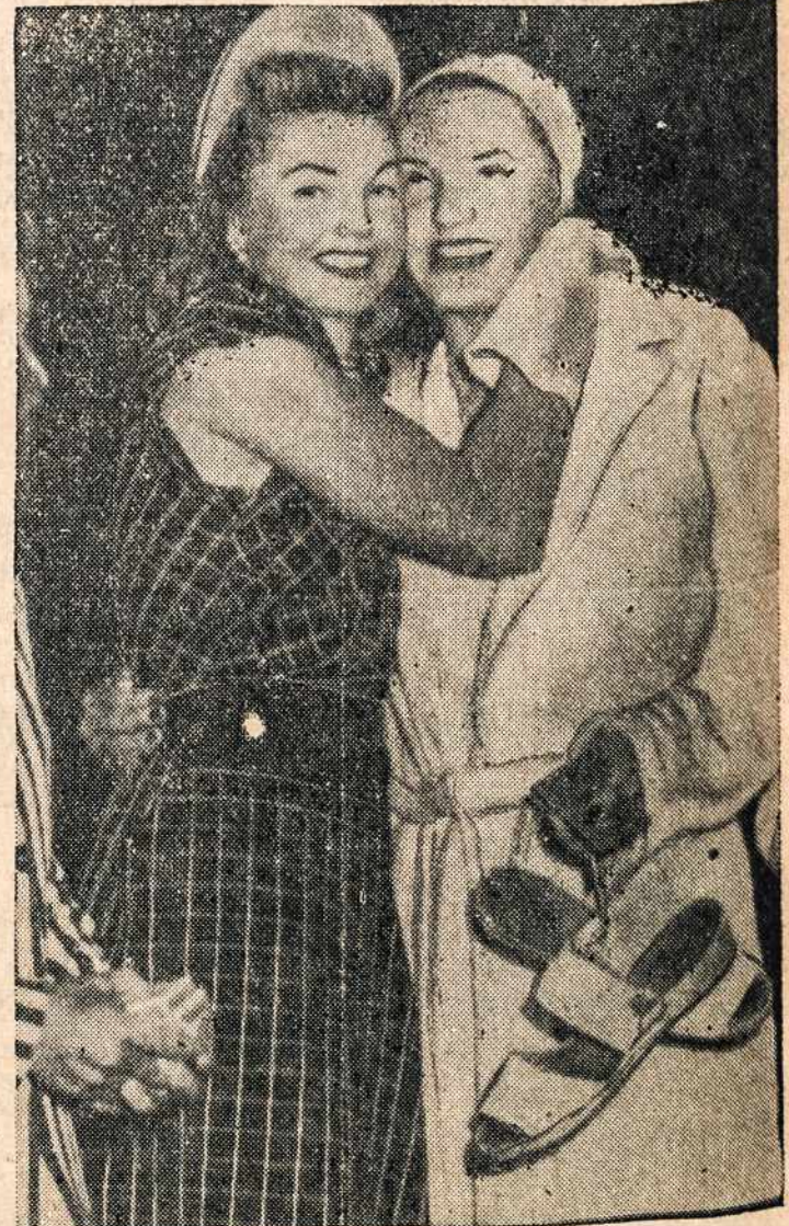
Ji meiliai sveikina jį už laimėtą plaukimo čempionatą. Tai 400 metrų titulo varžytinių laimėjimas, kuris įvyko National A. A. U. Women's swimming meet at Los Angeles.