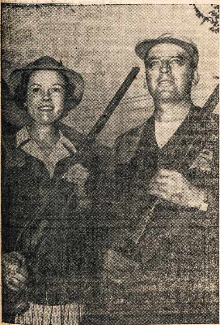
Vyras ir žmona laimėję "Trapshooting" čempionatą, Kenosha, Wis.

Jeigu Jūs padovanosite porą batukų šiam mažyčiui, ir jis bus Jums dėkingas.