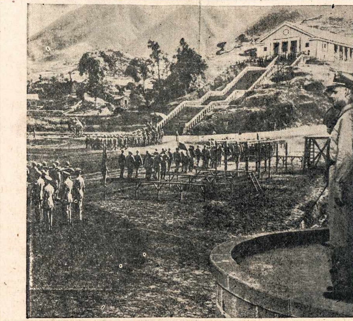
Rear Adm. Milton E. Miles, Amerikos Laivyno komandierius Kinijoje peržiūri ten esančius amerikiečius marinus, kurie jau 1942 metų kariavo kiniečių tarpe prieš japonus.