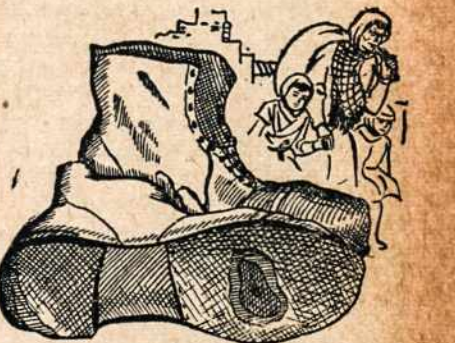
Kad ir nuplyšusiais batais, bet Lietuvos dukra eina apsaugos ieškodama, vedina dviem mažyčiais. Tamstos atlikusieji batukai gali padėti jos varge...

Minėtame straipsny yra ir daug daugiau įdomių ir teisingai nušviestų faktų ir argumentų. A.