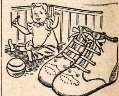
Jeigu Jūs padovanosite porą batukų šiam mažyčiui, ir jis bus Jums dėkingas.