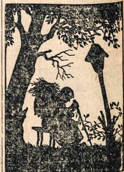
Tūno senas kryžius...daug čia išklūpota Daug čia gilaus skausmo... rymastim apkliota..