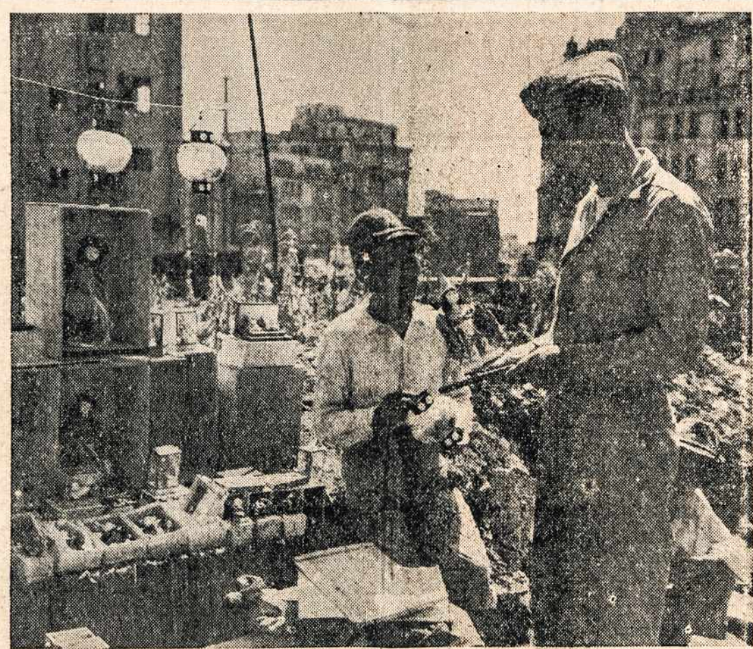
Amerikietis karys apžiūrinėja japoniečio krautuvėje suvenirus, kad galėtų nusipirkti ir pasiųsti saviesiems. Bet japonietis už lėlę prašo 100 yen'ų ($6.50). Tolujomatosi Tokyo parko aikštė.

Pranešama, kad Jung. Valstybėse streikierių ir dėl streikų sutrukdyto bedarbių darbininkų skai-