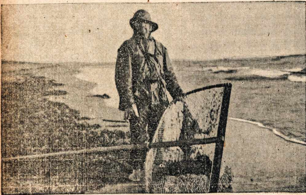
Palangos žvejys, išmetęs gintarų valk stę, sutinka svečius žvejįšku šypsniu..