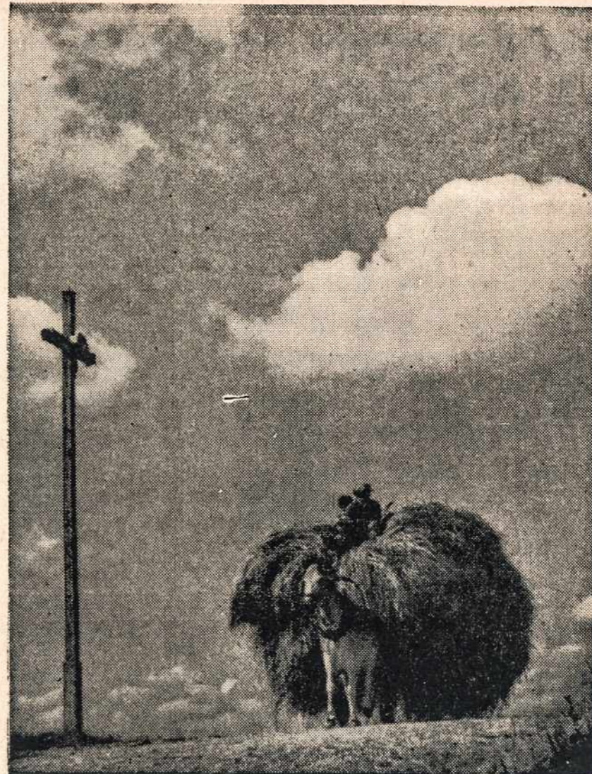
Vienišas kryžius — Ilgu senajam kryžiui vienišam nuspurus — kaip atsiskrėlis, jis Lietuvos lauke. Praeivis retkarčiais jam nukelia kepurę net nežinodamas, kas ilsis čia...

Tuo tarpu, kol Vilnius buvo svetimos rankose, mūsų knyga buvo persikėlusį Kauną. Šis miestas lietuvių raštų istorijoje užėmė tvirtą vietą. Paskutiniaisiais laikais Lietuvoje išeidavo apie 1000 knygų kasmet. Didelė jų dalis būdavo spausdinama Kaune. Ten pat negirdėto ligtol