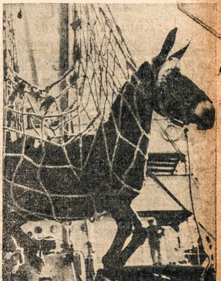
Nukeliamas vienas iš 1000 mūlas į Graikijos uostą, kur jie siunčiami UNRRA organizacijos, kad užvadotų trūkumą ūkinės jėgos.

— Man malonu pranešti, kad Amerikos lietuvių visuomenė, nežiūrint politi-