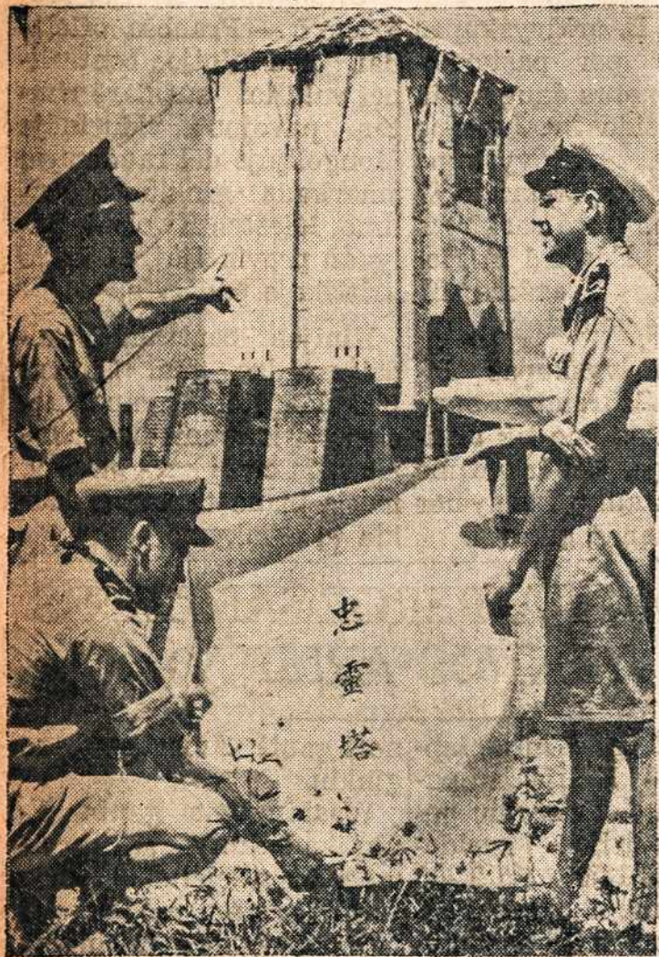
Japonų neužbaigtas statyti paminklas Hong Kong kolonijoje, dabar nagrinėjamas ir svarstoma, kas su juo padaryti. Čia daug japonų mirė pasidarydami sau galą — hari-kari.