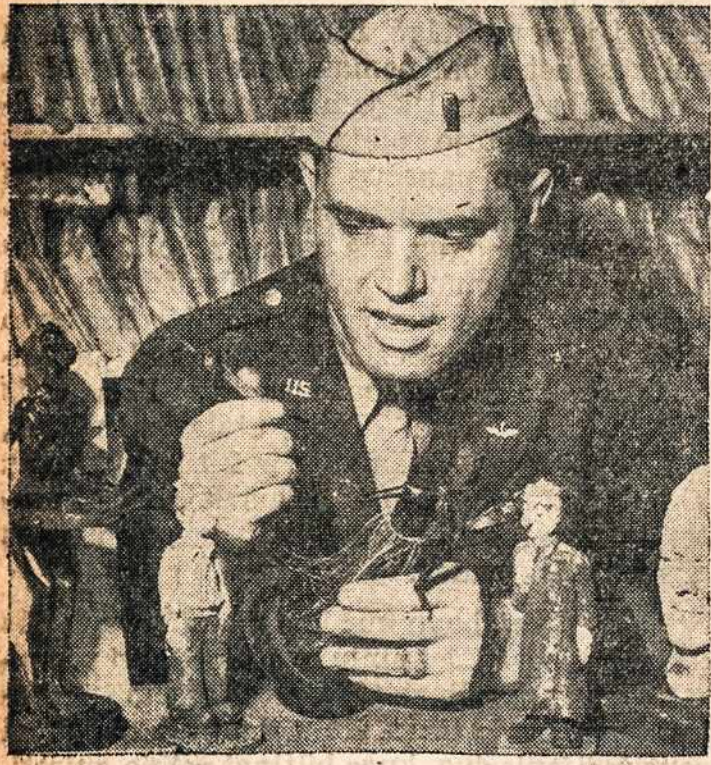
Vaidzas parodo mažytes stovylėles ir Amerikos karį, kuris ir kurie būdami Vokietijoje nelaisvėje, tas stovylėles padirbdino.