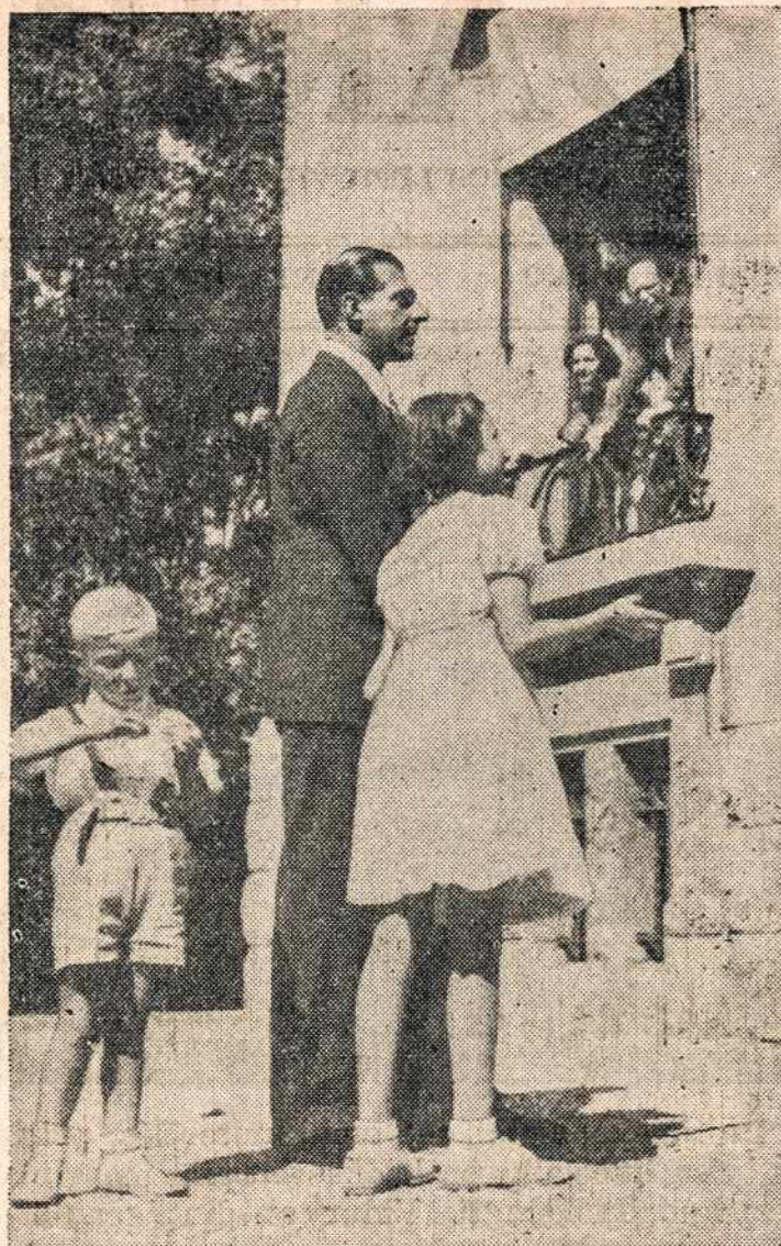
Barcelonos kunigaikštis Don Juan su dukterim, kuris sakosi, jam priklausąs Ispanijos sostas. Šis vaizdas pagautas Lausanne, Šveicarijoje.

Kam šerei širgelį, Kam šveitei kardelį, Kur josi, broleli, Baltas dobilėli? Aš josiu, sesele, Į karo laukelį, Į karo laukelį, Į prieš šalelę. O kad aš jojau Per Vilniaus miestelį, Visos miescionkėlės Manimi gėrėjos. Į karužę jojau, Į glitelę stojau, Garsiai nusižvengė Bėrasis žirgelis.