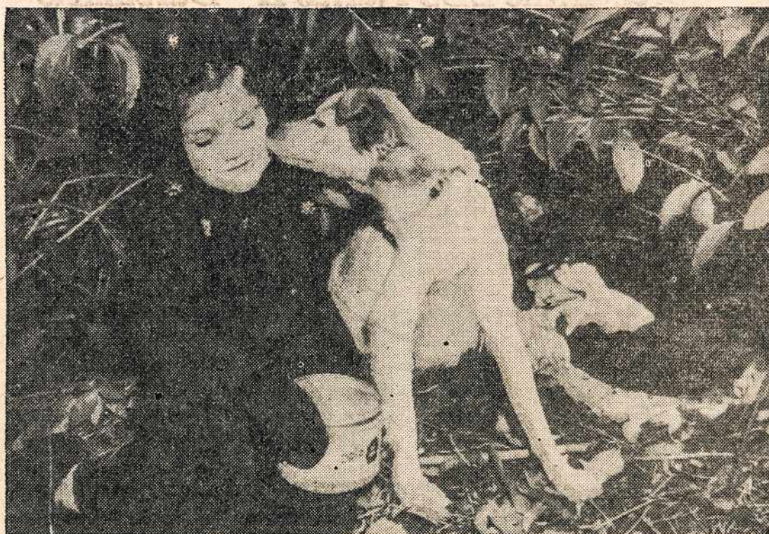
Benamė šuo-motina buvo valgiu sušelpta šios mažytės mergytės. Tai gi jai atmokama "bučkiais".

Hannover (britų zonoje). Čia susidarė Hannover-Braunschweig apygardos lietuvių Komitetas. Kai