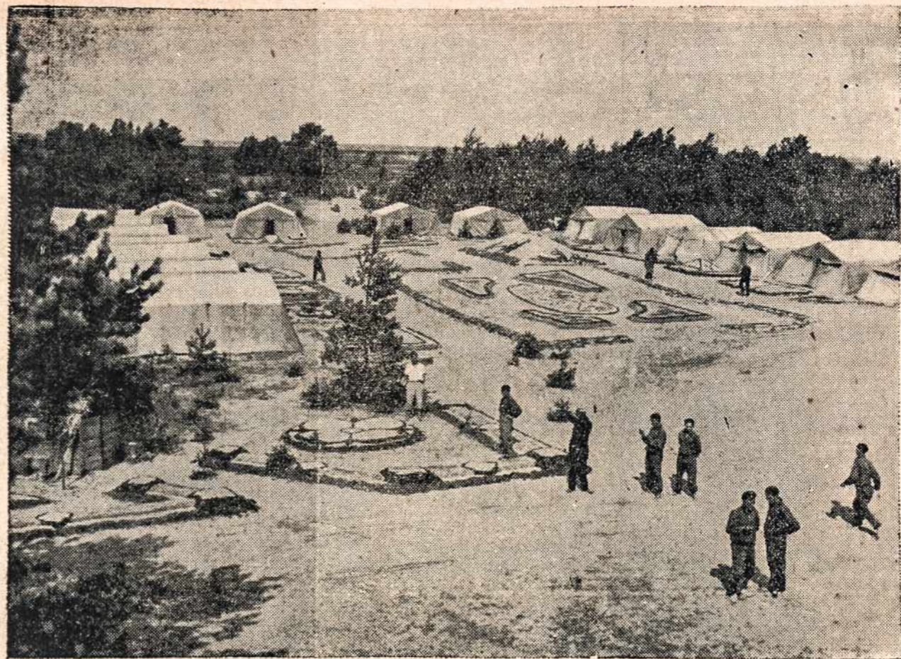
Vaidzas iš laisvos Lietuvos laikų kariuomenės vasaros stovyklų. Lietuvos karių vasaros stovyklose, kam buvo proga ten pabuvoti, galėjai pajusti gamtos grožio ištryškas, kurios buvo meniškai karių išdabintos jų stovyklos aikštėje.