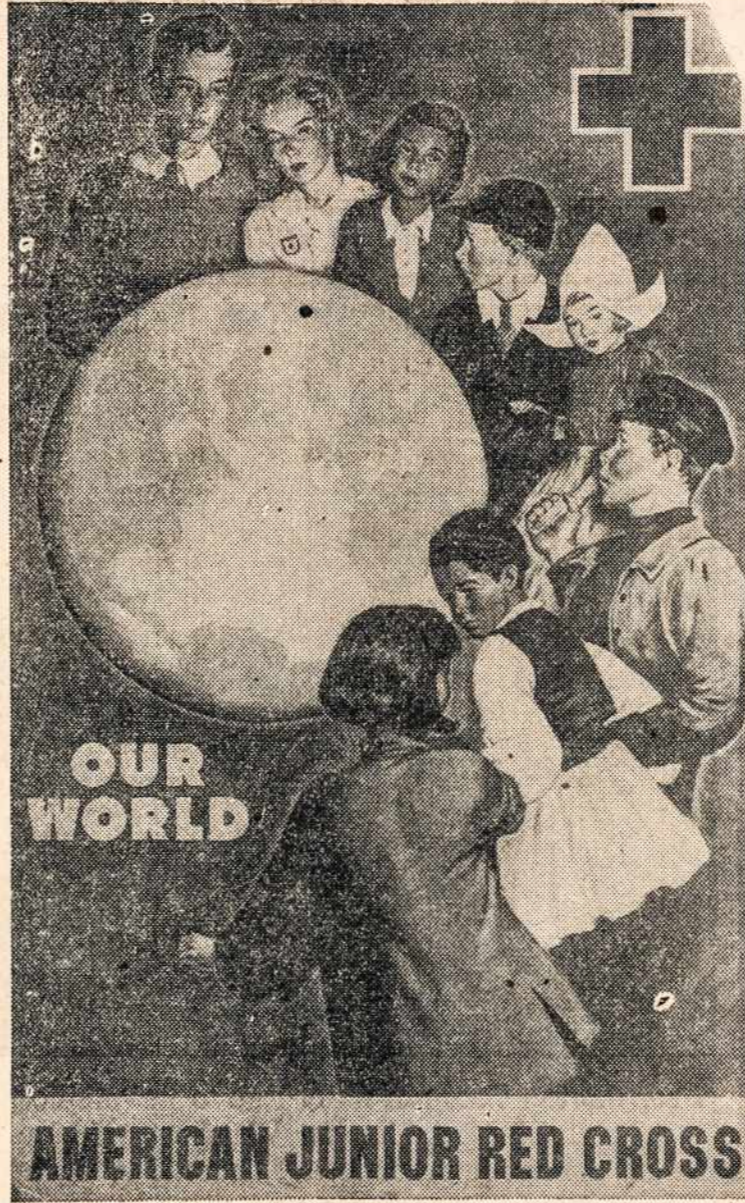
WASHINGTON, D. C.—World cooperation actually performed by the children of many countries is one of the major themes to be developed during the coming months by the American Junior Red Cross. This new poster is part of a campaign to recruit 60,000,000 world wide members within two years.

Dėka savolaikiai ir energingai amerikiečių karininko intervencijai, abu lenkus pavyko išgelbėti.