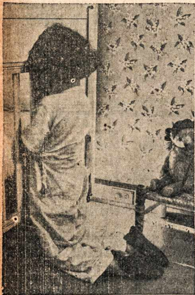
Mažytė mergytė, prieš einant gultų, sukalba nuoširdų poterėlį, dėkodama už praleistą linksmą dienele.