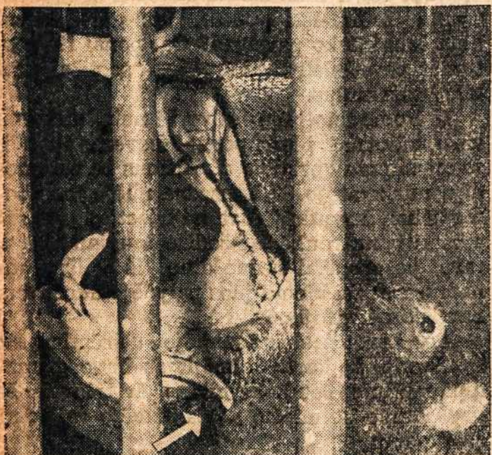
Matome šio žvėries nukrypusį ilgą dantį, kuriuo jis mėgino išlaužti geležies užtvartą. Nors ir geležis buvo įlenkta, bet ir jo dantys buvo išverstas iš vietos ir sako, kad jam reikės maistą krinti jau be to danties pagalbos.

Dvasioje draugiškumo, mes siunčiame jums nuoširdžius Linkėjimus. Lai Kalėdų Taika Nušviečia Žmonijos Širdis!