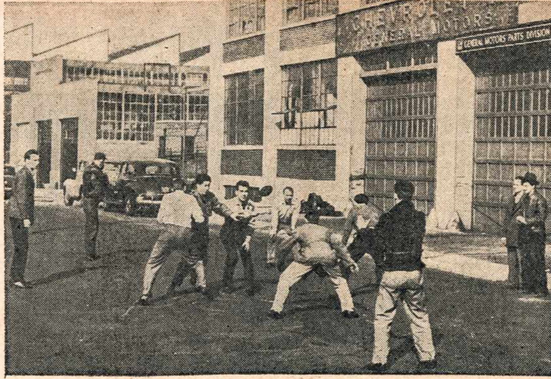
Philadelphijoje General Motors Parts Plant darbininkai išėję streikuoti atėjo prie dirbtuvės ir vietoj pikietuoti žaidžia football. Jie priklauso United Automobile Workers (CIO) unijai.

466 West Broadway, South Boston, Mass Telephone SOUTH Boston 2680