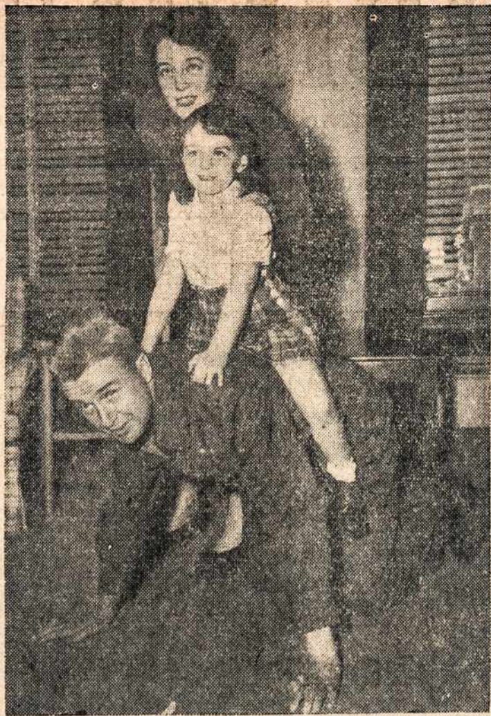
PIGGY-BACK — Sakoma, pirmas prašymas mažytės, tai "piggy-back", kai ji sulaukė savo artimojo šeimininko.

Visuotinas Amerikos Lietuvių Kongresas, susi-