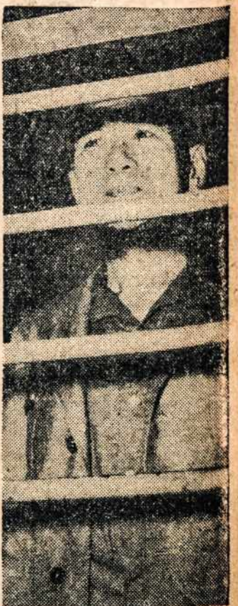
BEHIND BARS — Adm. Shegetora Shimada, Jap cabinet member at time of Pearl Harbor, looks through the bars of his cell in Yokohama jail where he is held for trial.

Limosnal dėl visokių reikalų Patarnavimas Dieną ir Naktį