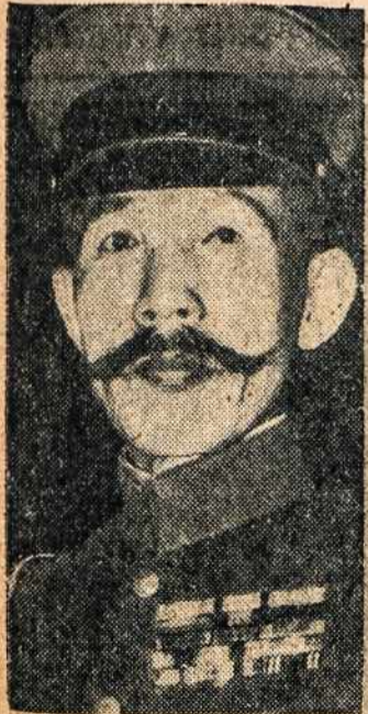
ARRESTED—Former Japanese War Minister, Baron General Sadao Araki, was arrested in Japan and charged with being a war criminal, according to an announcement from Gen. Douglas MacArthur's headquarters.

Atsakymas. Pinigai turi būti paskolinti iš bankos arba kitos paskolų įstaigos arba asmens. Valdžia, per veteranų Administraciją garantuos dalį užgirtos paskolos. Veteranų Administracija garantuoja 50% paskolos iki $4,000. Jeigu paskola viršytų $4,000, valdžia daugiau $2,000 negarantuos.