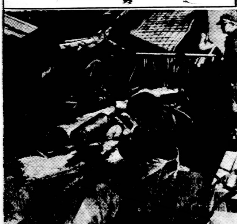
Besides supplying enough fat to produce approximately half of the toilet bar soap in 1945, used cooking fat turned over to the meat dealers helps keep the wheels of many other industries spinning. Kitchen fat salvage replaces industrial fats and oils that still cannot be imported from the South Pacific. Besides soap, used fat helps make paper out of these logs being fed into a southern paper mill.