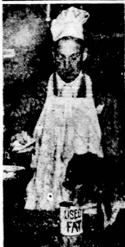
Leo Durocher, manager of the Brooklyn Dodgers, finds that Willie, the raccoon, has beaten him to the used fat can. Even Willie seems to know that fat salvage is vital in peacetime as well as war and that conservation in America, makes more fats and oils available for the rest of the world.