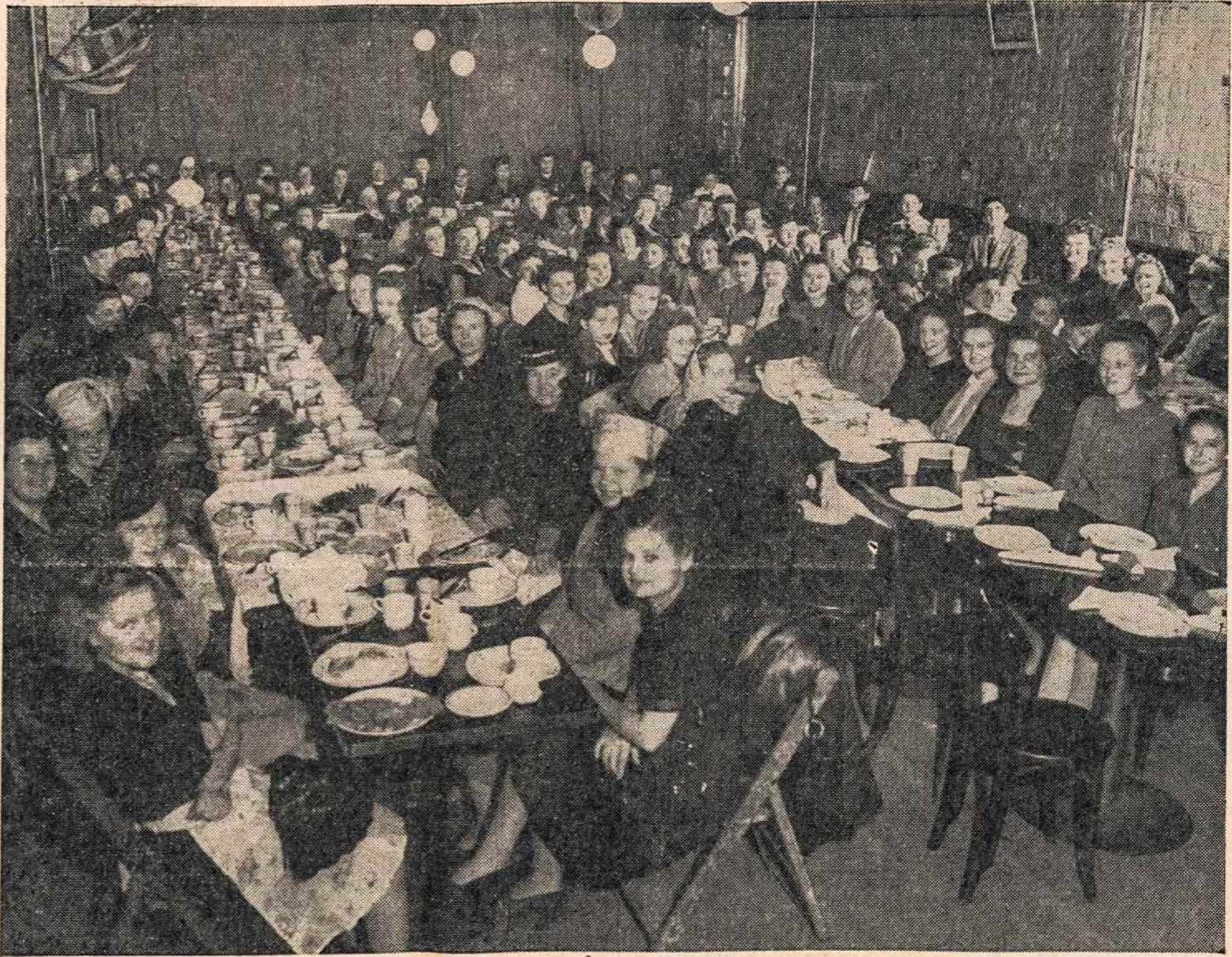
Vaidas iš bendrų Sodalicijos pusryčių. Vedusių moterų yra 78; vyresnių merginų 24; jaunesnių merginų 32, ir berniukų 30. Jų bendras komitetas jau pradėjo organizuoti planus šių metų New Jersey - New Yorko SODALIEČIŲ SAJUNGŲ bendram suvažiavimui, kuris įvyks gegužės 18 d. Harrison - Kearny, N. J.