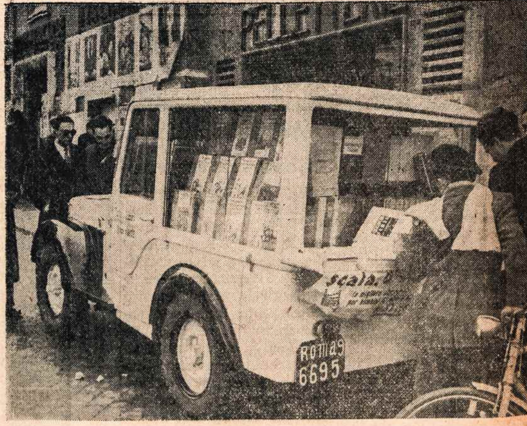
Knygynas ant amerikoniško "jeep". Tai Italijoje pritaisyta vaikščiojanti knygų parduotuvė. Tikrai gana praktiškas dalykas.