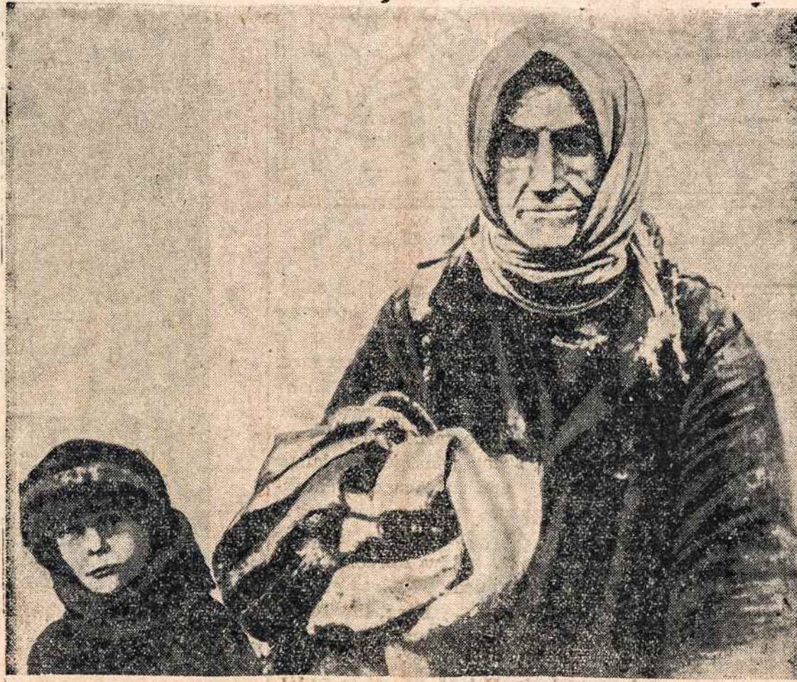
Jie badauja. Baisus badas siaučia Sovietų Rusijoje ir jos užgrobtose šalyse. Iš pavergtos Lietuvos yra žinių, kad bolševikai viską atima savo kariuomenei ar išveža į Rusiją, todėl ir lietuviams gresia bado šmėkla.

Visiems aukotojams nuoširdžiai dėkojame, "Darbininko" Administracija.