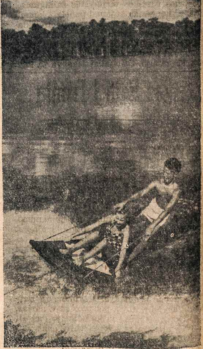
Kai šiaurėje Amerikos siaučia sniego audros, tai tuo pačiu laiku pietinėje Amerikoje žemės paledžia gražiausią laiką stiprindami sveikatą jūrų pakraščiuose.