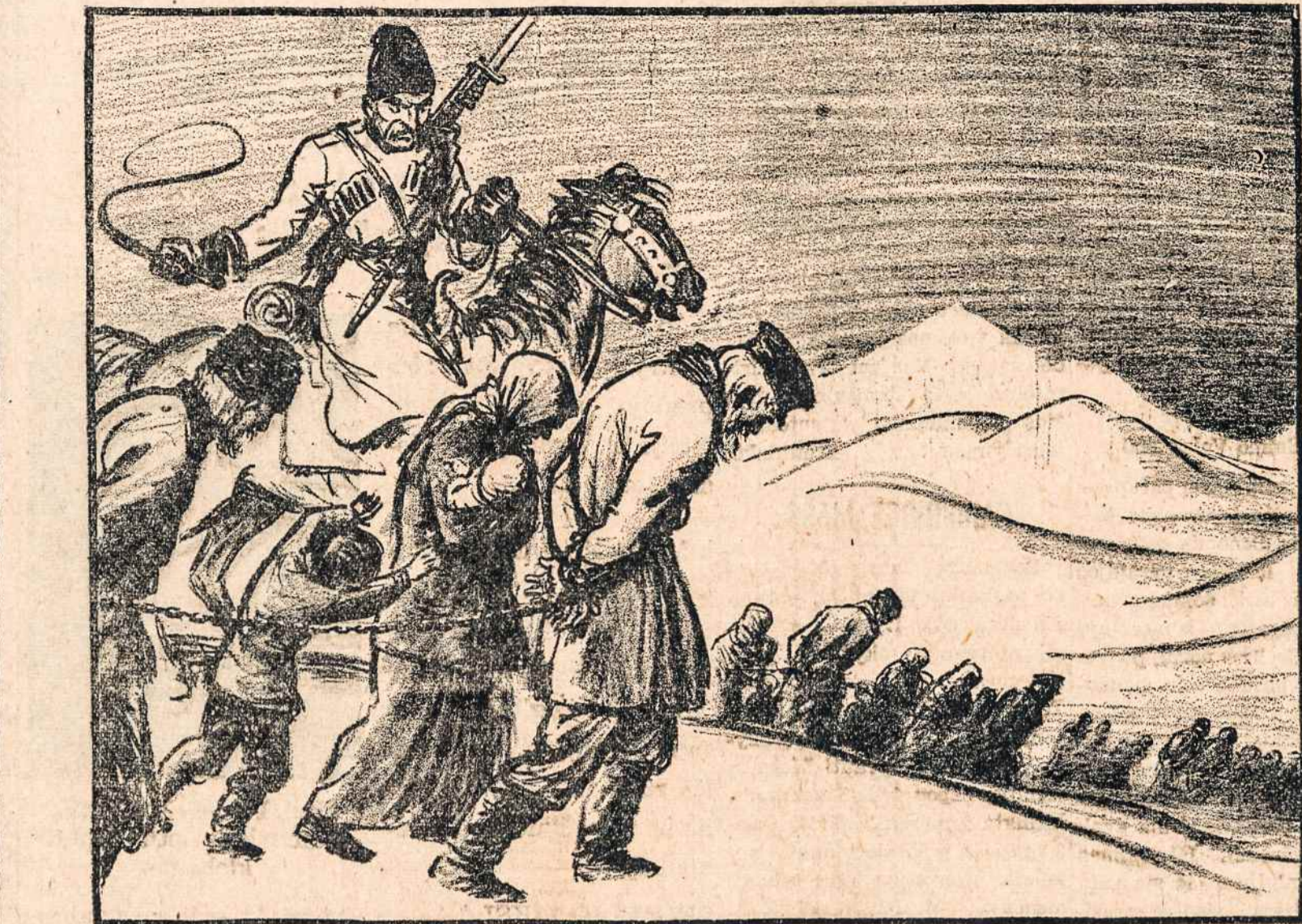
Mirties kolonos į Sibirą. Kaip iš Londono pranešama, bolševikai, naikindami lietuvių tautą, tiek daug jos gyventojų tremia į Sibirą, kad jiems išvežti trūksta net gyvulinių vagonų. Nelaiminguosius varo pėsčius, kaip carų laikais. "Dvėskite greičiau, sako juos mušdami ir šaudydami budeliai. — Greičiau plaukus ant savo delno pamatysit, kaip savo kraštą."