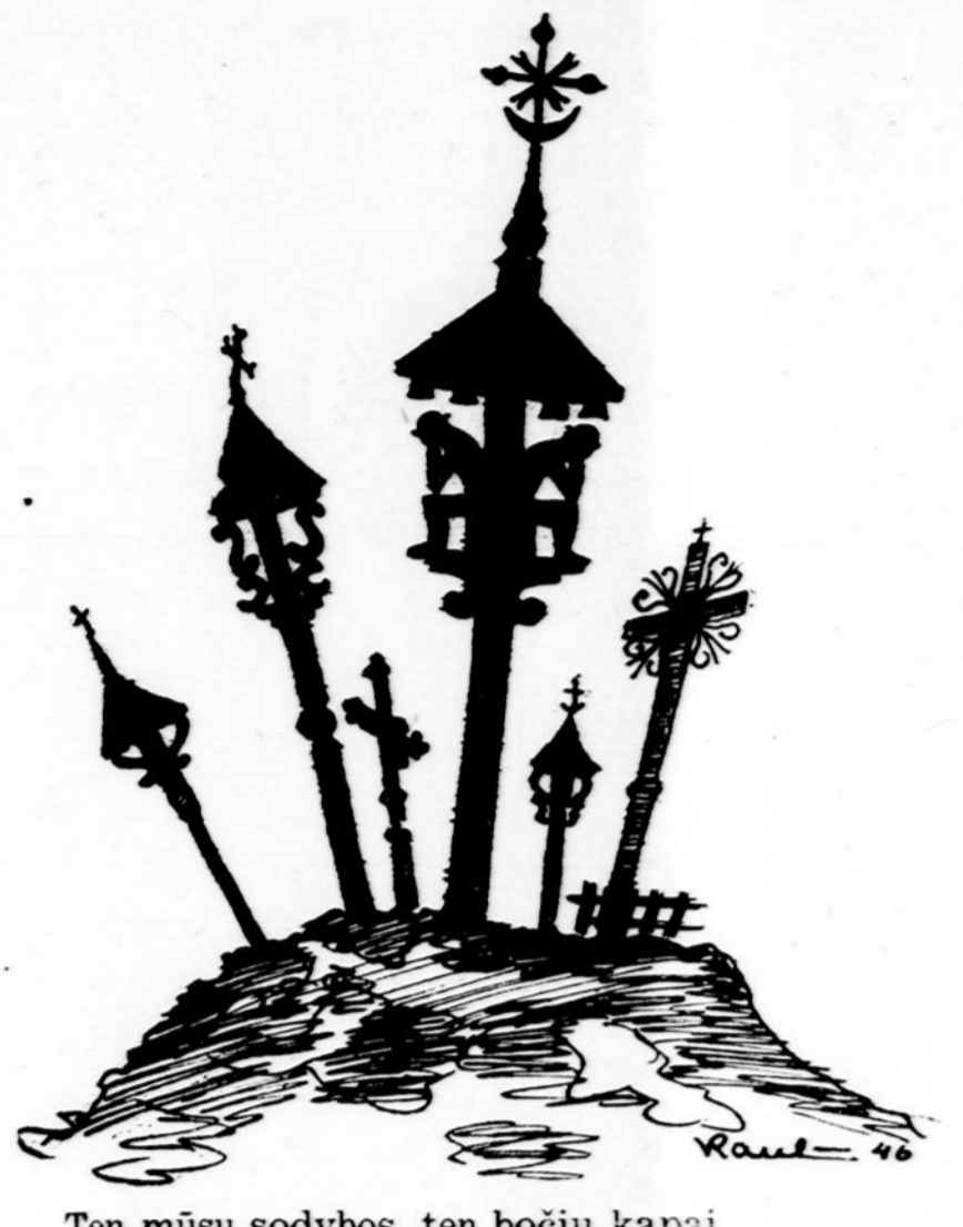
Ten mūsų sodybos, ten bočių kapai...