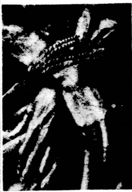
Surištos rankos už žmonijos išlaisvinimą.

— Trys šūviai į akį, kam norėjo apginti sužadėtinę. — Ką pasakoja vengrė, pabėgusi iš raudonųjų teroro. — Moterys rusų armijoje. — Komunistai mielai priima nacius į savo partiją. — Raudonarmiečiai kalba apie žygį į Ameriką. — "Vengrijoje tėra tik vienas vyras, ir tas su siju". — Kardinolas, kalintas nacių lageryje. — Raudonieji tiek mušė vyskupą, kad tas susirgo proto liga. — 140,000 vyrų į Marijos šventovę. — Elgeta išžeidė: kam jam davė tik milijoną pengų.