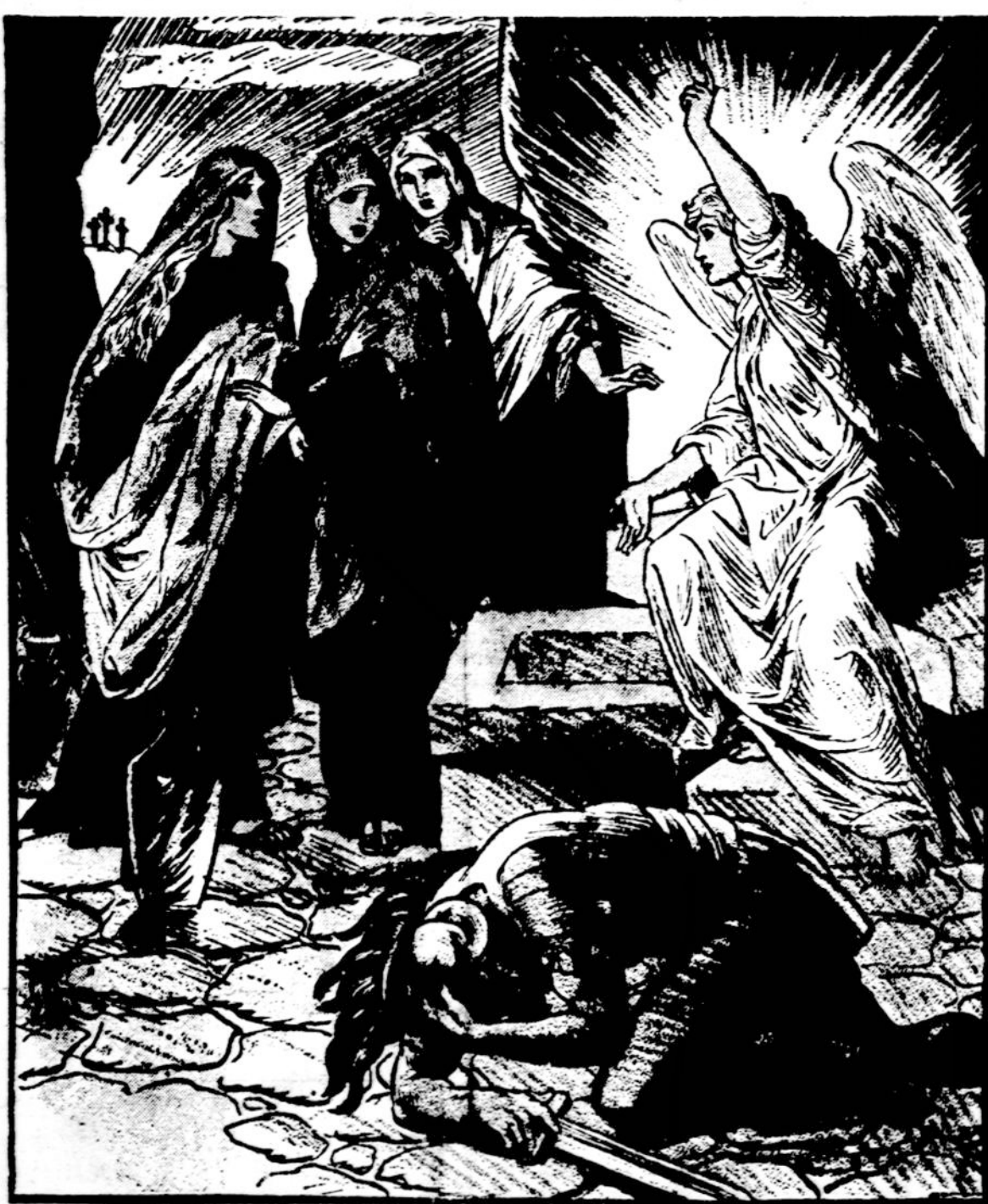
Jėsus į kapą, jos pamatė jaunikaitį, sėdinti dešinėje pusėje, apvilktą baltu drabužiu, ir nusigando. Jis joms tarė: Nenusigaskite; jūs ieškote Jėzaus Nazareno, kurs buvo prikaltas ant kryžiaus; jis atsikėlė, jo nėra čia: štai vieta, kur jis buvo padėje. (Morkaus 16, 5-6)

gotos sutemų ateis giedrusis Prisiškėlimas. Džiaugsmingų išsilaisvinimo vilčių jums, broliai partizanai, jums, ryžtingieji tremtiniai, jums, to išsilaisvinimo pagreitiniui dirbantieji, visus neištikimus pareigū-