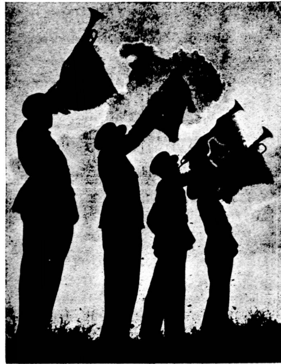
Laisvės šaukliai: kelkite, kelkite, kelkite...

Vėl sulaukėm šv. Velykų, kurios džiaugsmu pripildo kiekvieno gero kataliko širdį. Beveik prieš du tūkstančius metų įvyko didžiausioji žmonijos drama, kai žmogus savo nupuolimo baisume ir pykty nužudė iš dangaus žmonią gelbėt nužengusi Dievo Sūnų.