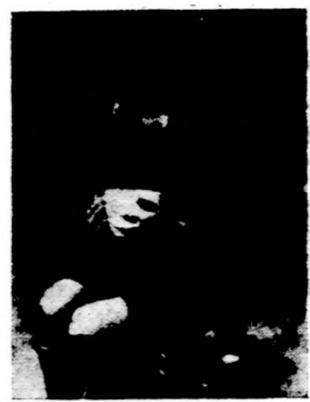
Nėr pieno! Tūkstančiai tremtinių vaikučių net Velykose nebus užtenkamai pavalgę. Remkime BALF vajų.

Kaikurie kunigai, kaip vienas iš mano pažįstamų, jaunas kunigas, kuris senajame režime buvo kaltinamas esąs radikalus (kairusis) ir socialistas, dabar slepiasi tariamose komunistų šeimose.