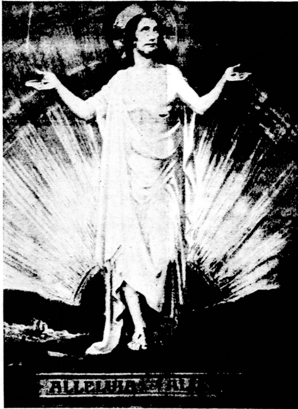
Kristus kėlės, mirtis krito, Aleliuja!

Visi yra Tavęs reikalingi, net ir tie, kurie to nežino, daug daugiau už tuos, kurie žino! Išalkusis įsivaizduoja, kad ieško duonos ir Tavęs alksta; ištroškęs mano, kad nori vandens, o jis Tavęs trokšta; liguistas svajoja apie sveikatos atgavimą, o tuo tarpu jo liga yra Tavęs stoka. Kas ieško pasauli-