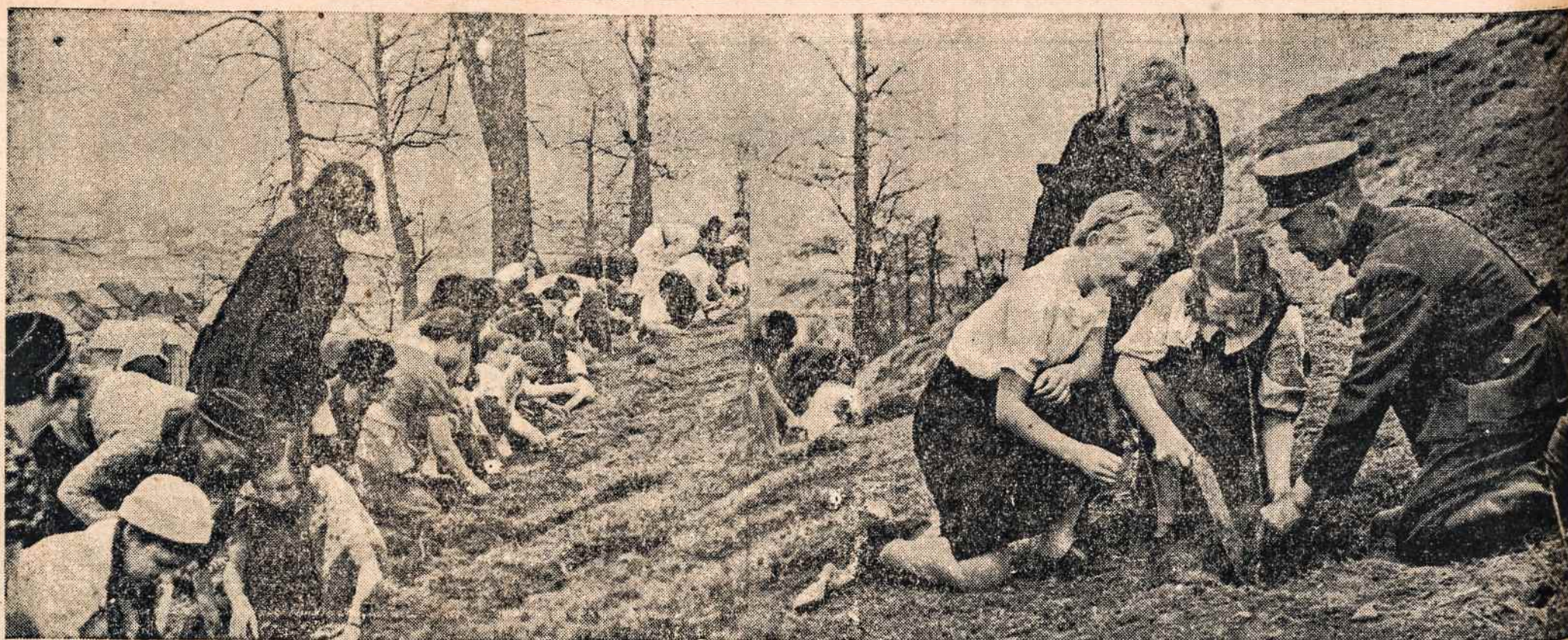
Medelių sodinimo šventė. Seniau laisvoje Lietuvoje anksti pavasarį moksleiviai vieną dieną išeidavo tėvynės laukus apsodinti medeliais. Dabar Lietuvos miškuose su žiauriu pavergėju kovoja d šimtytys tūkstančių partizanų.