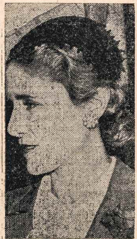
Clare Boothe Luce, viena iš žymiausių Amerikos moterų.

Štai kaip reporteris aprašo jos dienos eigą: — Jau septintą valandą