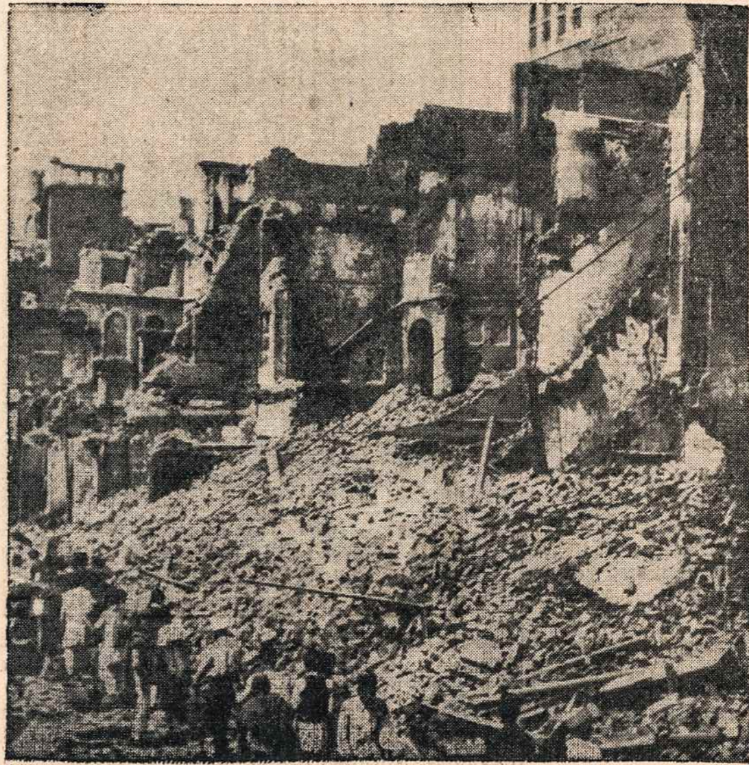
Riaušėms pasibaigus. Čia parodo taip vadinamą Sikhs'ų "šventąjį miestą" Amritsar, Indijoje, kur įvyko riaušės tarp musulmanų, hindusų ir sikhs'ų. Riaušių metu žuvo tūkstančiai žmonių ir bazaro rūmai paversti griuvėsiais.

1935 metais ji ištėkėjo už Henry Luce, redaktoriaus ir leidėjo "Time", "Life" ir "Fortune" žurnalų. Jie susitiko atsitiktinai, dviejuose parengimuose New Yorke.