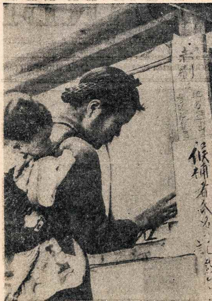
Amerikiečiams okupavus Japoniją buvo toji šalyje įvesta demokratinė sistema. Ir štai tūla japonietė atėjusi į rinkimų vietą, nešdama kūdikį ant pečių, peržiūri kandidatų sąrašą pasirinkimui už kurį ji norėtų balsuoti.

"Kalifornijos Lietuvis" spausdinamas Oaklande, galima įsigyti šiuo adresu: 2721 Logan St., Oakland 1, Calif. Prenumeratos kaina metams du doleriai. A. Sk.