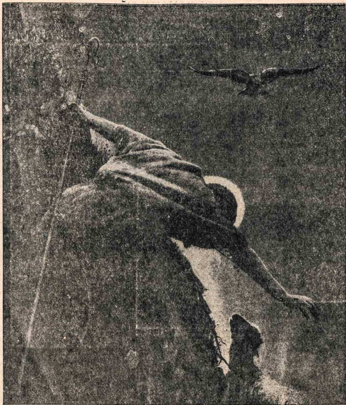
Gerasis Ganytojas. Jis yra Tiesa, Kelias ir Gyvenimas.

Pasaulio vadų sąžinė lyg ir atgyja. Jei ne sąžinė, tai bent buvęs prarastas garbės pojūtis. Norėtų atitaisyti blygybę ir skriaudą, kurią taip negarbingai tautoms padarė. Tačiau — suardyti buvo ne taip jau sunku, atitaisyti kaip ir negalima. Iškelta ant šakių Rusija dabar nė kalbėt rimtai nebebori. Pajuokaut, pasigindyt, paskui išgert į visų sveikatą — kodėl ne. Kad ir liaudis badu miršta, bet Kremliaus ponai išteklių turi. Vodkos, šampano, kachetinsko, kavario, riabėčių, ras-tegajų — kiek tik dušėlė trokšta. Politinių nuolaidų, smaugiamoms tautoms lengvatų — nė gu-gu. Atstovams tenka grįžti tuščiomis rankomis. Visos lauktu-vės — spėlojimai: ką Rusija mano daryti? Tarsi neži-notų, ko Rusija siekia, kas įrašyta Lenino - Stalino pa-grindinėj programoj — pasaulinės revoliucijos. Komu-nistų linija, kad ir dažnai vingiuotėmis iškraipyta, vi-suomet siekia vieno ir to paties tikslo: pasaulį paveldėti. Jie gali apsisistatyti įvairiomis iškabomis, puoštiš- nekalčiausiai bei patriotingiausiai šūkiams, nešioti tai lapės, tai avies kailinius, bet esmėje buvo, yra ir bus —