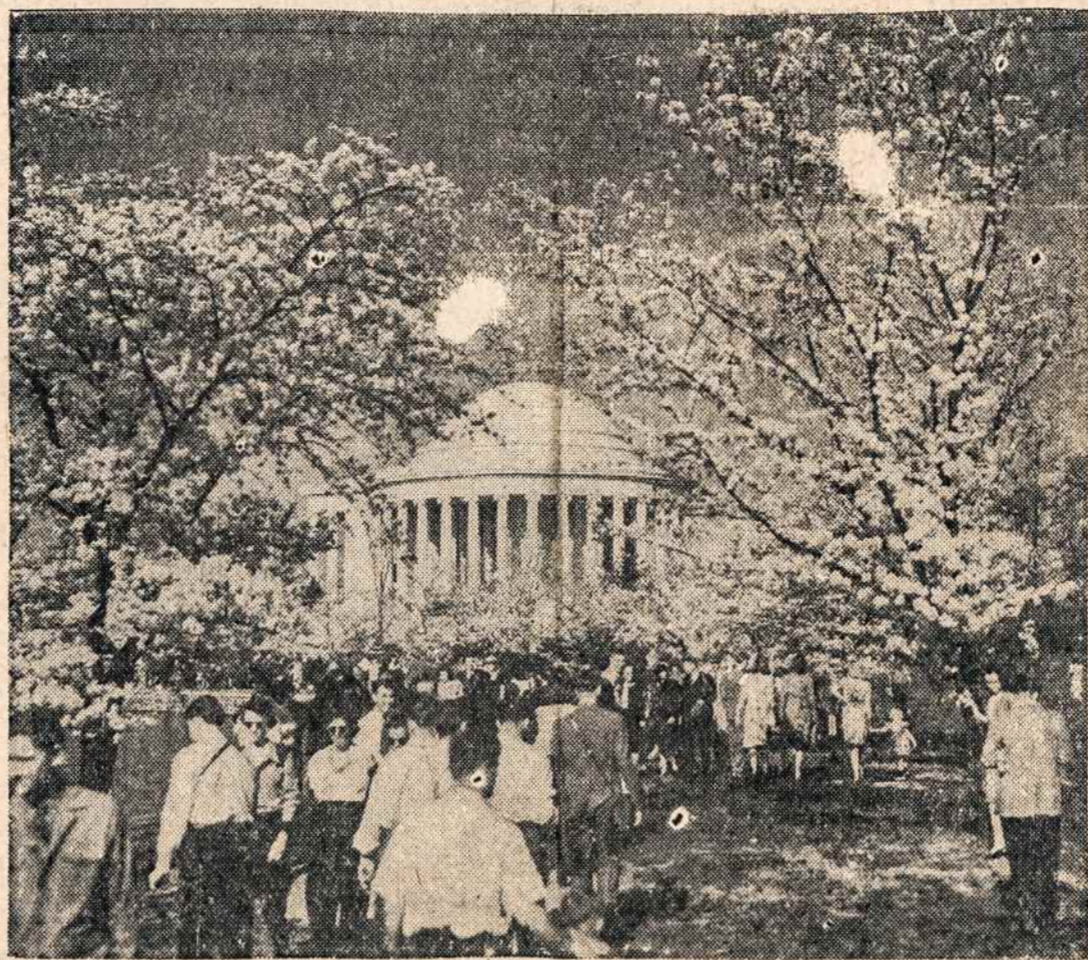
Mūsų krašto sostinė — Washington, D. C. — yra labai populiarus vasarį vyšnių medžių žydėjimu. Suvažiuoja tūkstančiai žmonių į Washingtoną pamatyti. Čia matome dalį gausios minios parke arti Jefferson Memorial.