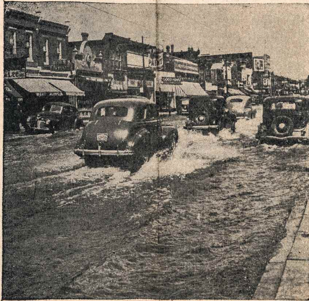
Atrodo lyg potvynis. Bet tai tik sutrūkęs didysis vandens vamzdis, Philadelphia mieste, patvindė gatves.

Kai tokios dvasios vyrai "komunizmą piauna", visokiems padleckiams belieka kraustyti iš proto... ir iš šio pasaulio. Č.