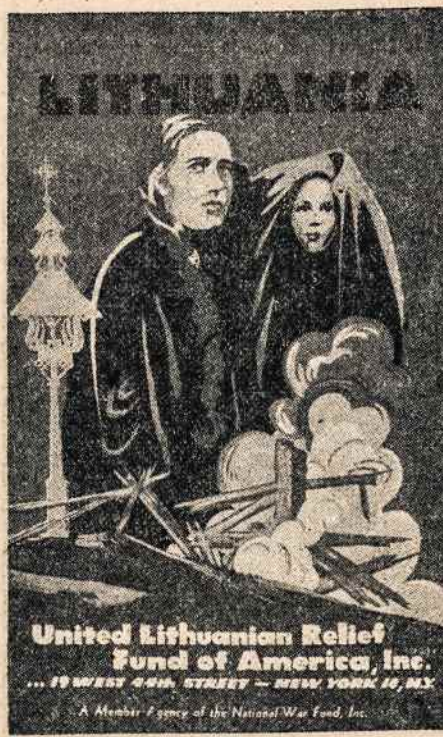
United Lithuanian Relief Fund of America, Inc. 19 WEST 58th STREET - NEW YORK 19, N.Y.

Tačiau tos istorinės klaidos nenori pakartoti dabartinė lietuvių tauta. Su koku užsidegimu šoko mokytis jaunoji lietuvių karta, atsikovojo Lietuvai laisvę! Greitai studentų skaičius, poporcingai imant pagal krašto gyvenotojų skaičių, buvo didesnis,