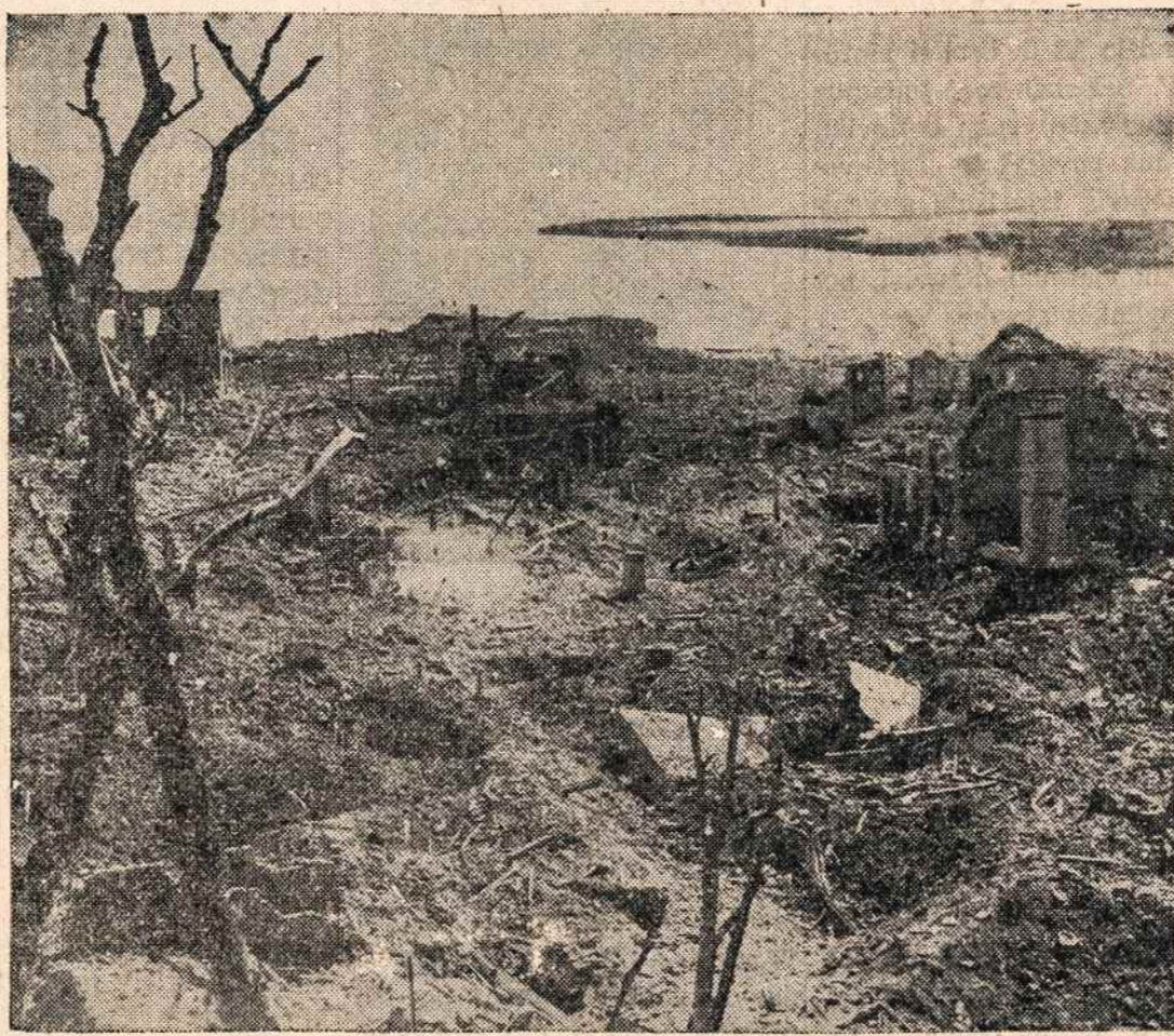
Netik per karą buvo bombarduojami kariški įsistiprinimai, bet ir po karo. Štai vaizdas nesena subombarduotos Helgoland salos tvirtovės. Tai buvo vokiečių galinga submarinų stotis, kurią britai okupavo ir šiomis dienomis subombardavo paleisdami 7000 tonų bombą.