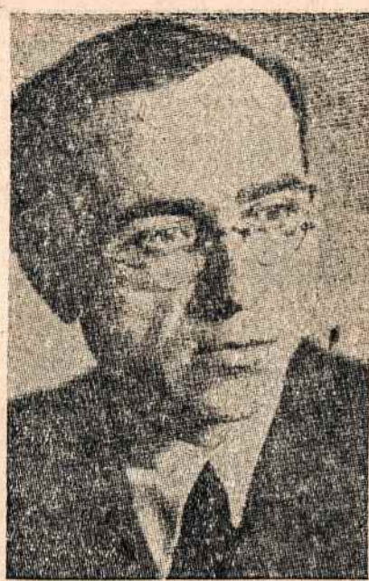
Poetas Bern. Brazdžionis, tremtyje laimėjęs pirmąją premią už eilėraščių rin- kinį "Svetimi Kalnai".