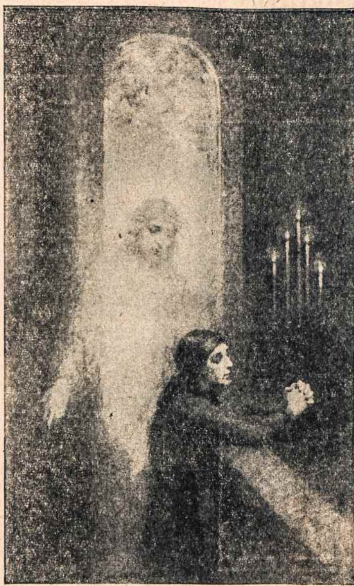
Jeį širdį tau skausmas kaip peiliais suspaus... Ei, bėk prie galingos maldos!