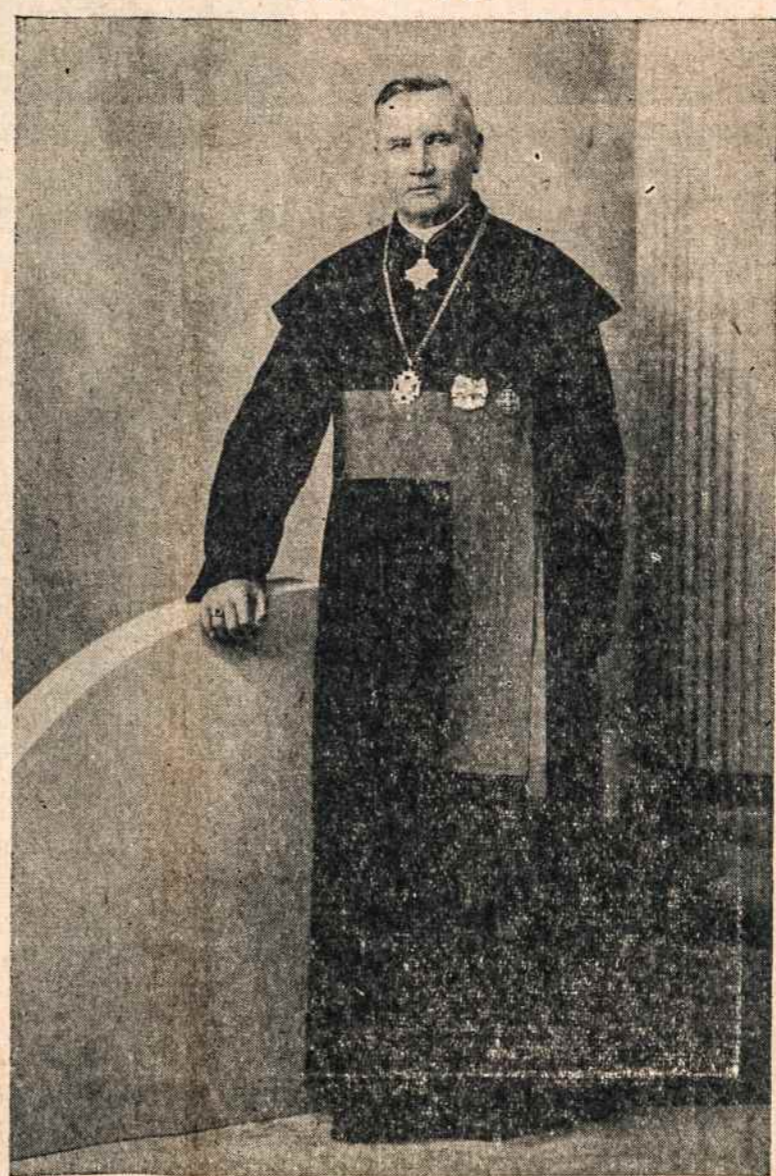
A. † A.

Gera motina vertesnė už šimtą mokytojų. Georges Herbert.