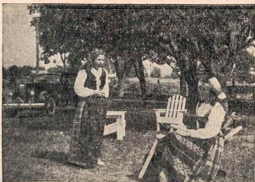
Amerikos lietuviškos tautiniais rūbais mergaičių stovykloje (kempėje) Putnam, Conn. Stovykla prasidėjo birželio 29 dieną.

— Čia visai ne politinis reikalas. Girti, tai gal skubėdami traukiniu ir pamir-