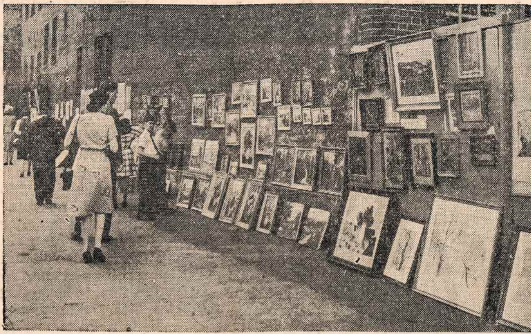
Dailės paroda lauke — Čia matome artistų išstatytus paveikslus New Yorko Greenwich kaimelyje. Praeinantieji gali pamatyti ir nusipirkti.

Lygiai jau du metai, kaip gyvename, tarsi skruzdės šiame Hanau kampely, lygiai tiek pat laiko valgo me USA duoną ir rengiamės jų drabužiais. Nors, tiesa, visa tai gauname nemokamai, tačiau mes čia neastogaujame, bet dirbame, mokomės ir mel-džiamės su viltimi, kad vėl