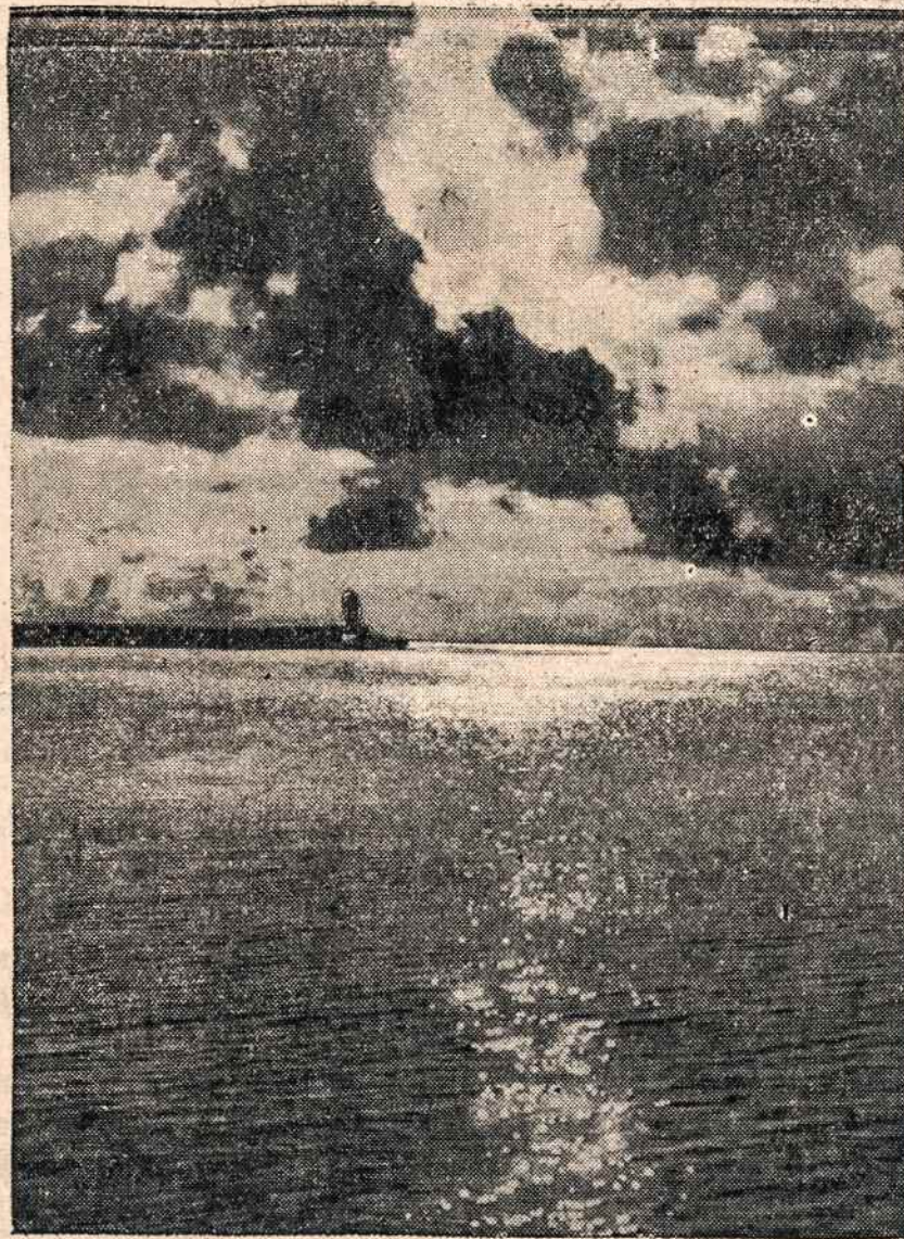
Klaipėdos uosto švyturys

Gyvens čia ir šveicarijoj Erich Maria Remarque, "Vakarų fronte nieko naujo" autorius, šiuo metu gyvena Jungtinėje Valstybėje. Jo paskutinis romanas "Triumfo arka", kurio tema sudaro vokiečių emigrantų (po 1933 metų) gyvenimas Paryžiuje, sumušė visus Amerikos tiražų rekordus. Remarque'as iki 1929 metų, prieš išeinant pirmam jo romanui, gyveno viename Vokietijos provincijos mieste ir išbandė paeiliui mokytojo, antkapių pardavėjo, auto lenktyniniko, biuro tarnautojo ir sporto korespondento profesijas. Jo knygos "Vakarų fronte", kuri išėjusi turėjo didžiulį pasisekimą, leidėjai nenorėjo leisti, sakydami, kad karo romanais niekas nesidomės... Šiuo metu rašytojas pareiškia, jog vokiečius reikia įtikinti, kad jų daugumas kalti dėl suruoštų tautų skerdynių ir okupacijos žiaurumų. Jis pasisakė nuo šiol gyvensiąs pakaitom šveicarijoj ir Amerikoje. Gyvenimas šveicarijoj, kur jis savo metu buvo emigravęs iš Vokietijos, duos jam galimumą palaikyti kontaktą su Europa.