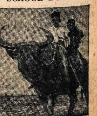
Two Filipino boys on the family carabao take home school books sent to the islands from California through the American Junior Red Cross.