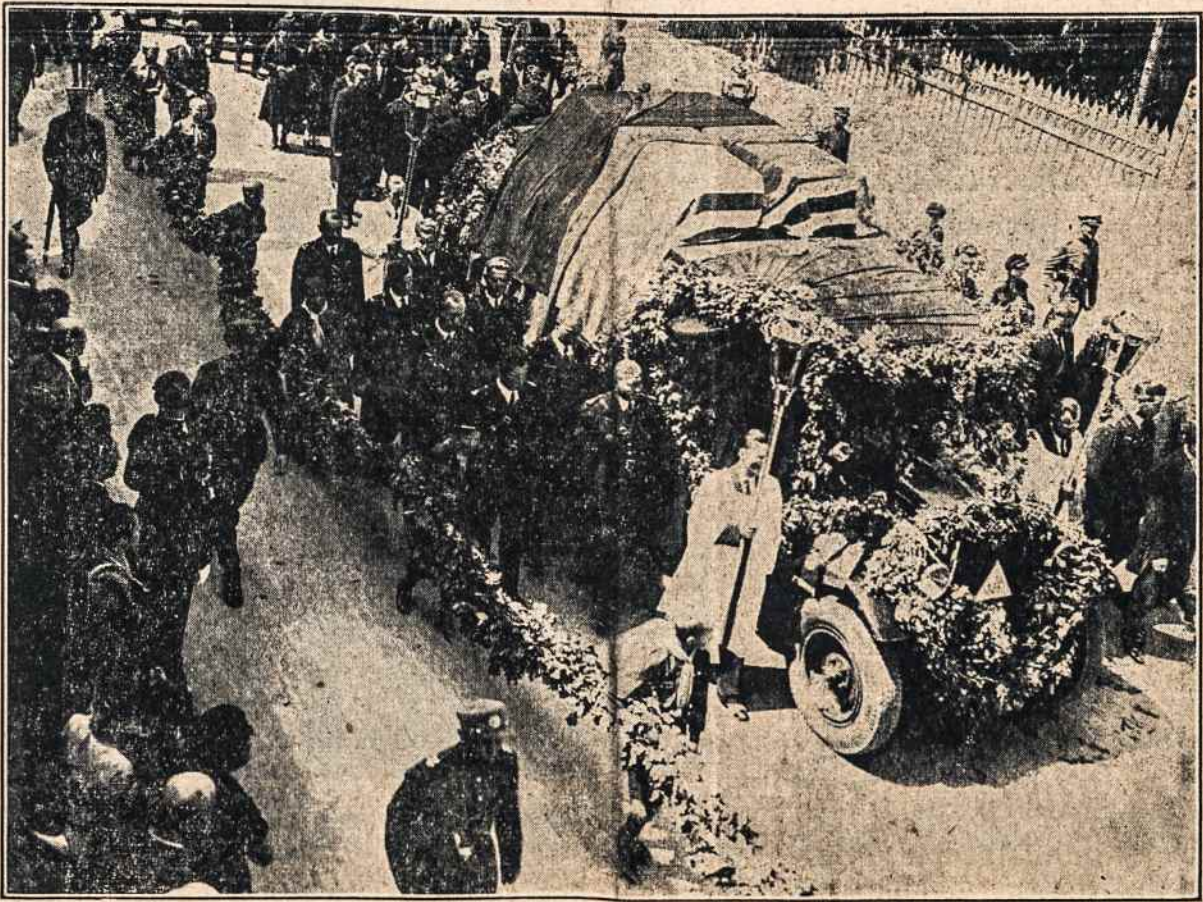
Dariaus ir Girėno laidotuvės Kaune (liepos 20, 1933 metais). Didvyrius į amžino poilsio vietą lydėjo apie 60,000 žmonių. Vieni paskutinių Dariaus žodžių Amerikoje buvo šie: "Tu, Jaunoji Lietuva, turėsi iš naujo ryžtis, aukotis ir pasirengti naujam žygiui".