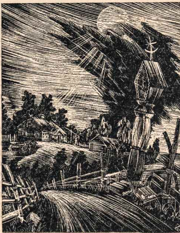
Saulė pro debesis tėviškės laukuose.

Jų padėtis bloginama. Iš vienos pusės sovietų įtakoje iš kitos — vokiečių. Ankstesnėse slaptose UNRRA-os instrukcijose buvo nurodyta kilnoti ir blogesnius lagerius, silpninti maistą. To paties nori ir vokiečiai, kurie prie amerikiečių pareigūnų eina dviem keliais — oficialios vokiečių įstaigos, partijos kreipiasi į amerikiečių karinę valdžią, kad namai, kuriuose dabar apgyvendinti DP, būtų vokiečiams gražinti. Vokiečių spaudi-