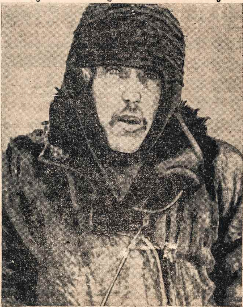
Taip ir dar baisiau atrodo tremtiniai — darbo ver- gai Sibire.

Saivinski apylinkėse vien- sas slėnis yra pavadintas Mirties slėniu. Tai vieta, kur, kaip pasakojama, vi- sa tremtinių grupė, susi- dedanti iš keleto tūkstan- čių žmonių, drauge su sa- vo sargybiniais pūgoje pa- klydo ir mirė visi iki vie- nam. Kalbama, kad pir- maisiais metais, kada bu- vo steigama aukso kasyk- lų sostinė Magadanas, tik vienas iš 50 ar 100 tremti- nių, atgabentų sunkiose tyrlaukais, juos, tačiau, daugumoj sugaudydavo