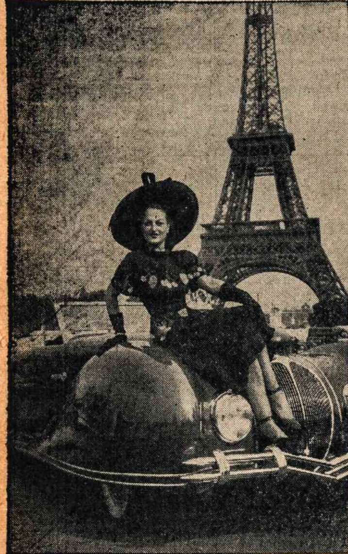
Nieko sau sėdėti ant guminių ratų. — Šis pirmas prancūzų išdirbystės automobilis Pary-žiuje atkreipė daugelio dėmesį. Bet ne tiek au-tomobilis, kiek madniai pasipuošusi vairuotoja.