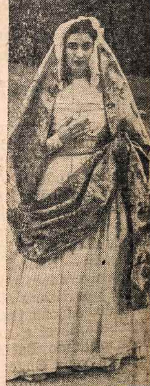
Senorita Carmen Franco Polo, Ispanijos valdovo dukterė, pasipuošusi senovės ispanų tautiniais drabužiais, dalyvavo festivalyje.