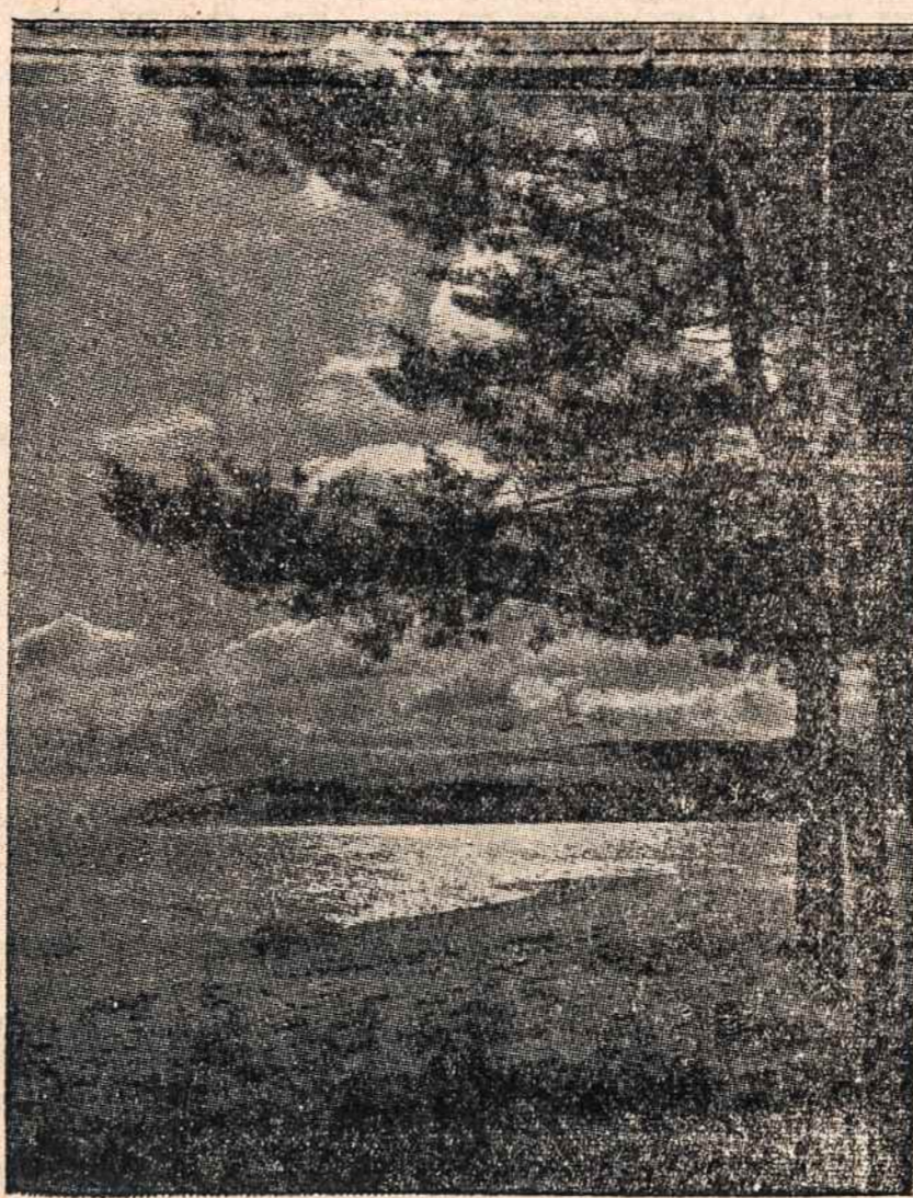
Gražusis Lietuvos pajūris

Betgi, jei Mažvydo "sausis" reiškia "gruodį", tai — 1547 m. gruodžio 8 d. veikalas galėjo išeiti: vienuolika mėnesių skirtumo, vienuolika mėnesių papildomo laiko leidiniui paruošti ir išleisti. Esu tikras šių samprotavimų tvirtumu. Visvien, prašau mūsų bibliografijos ir žodyno augimo istorikus tarti galutiną žodį, kad istoriniu tikslumu atžymėtume šią reikšmingą sukaktį.