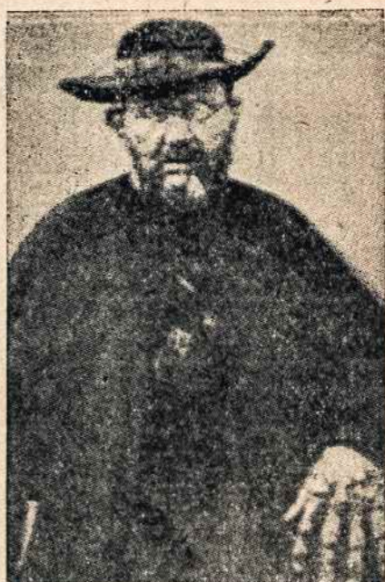
Meilės didvyris, raupsuotųjų apaštalas Tėvas Damijonas.

Pradžioje savo tarnybos T. Damijonas galėdavo retkarčiais palikti raup-