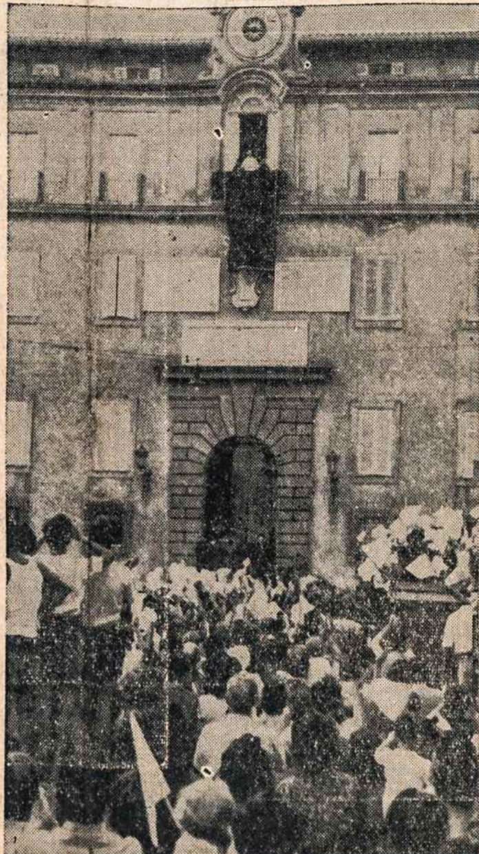
Vasaros rezidencija — Jo šventenybė Popiežius Pijus XII, stovėdamas savo vasarinio palociaus balkone Castelgandolfo, Italijoje, laimina susirinkusius kaimiečius. Šis yra trečias po karo Popiežiaus vizitas.

Formalis kaltinimas iškeltas Amerikos Geležies ir Plieno Institutui, New York, ir jo 100 narių. Kaltinime aiškiai yra pasakyta, kad tai buvo "šamokslas" palaikyti tas padidintas kainas už plieną.