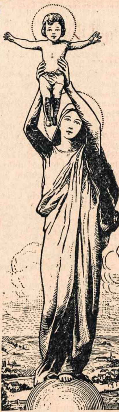
Šv. Rožančiaus Karalienė

žiauriai nuo tų pačių vokiečių nukentėjo? Tik tie, taip gali kalbėti, kurie arba nežino tikrosios padėties, ką nelaimingiesiems tremtiniams teko iškentėti, arba tie, kurie tyčia, su juos (tremtinius) pašmeižti.