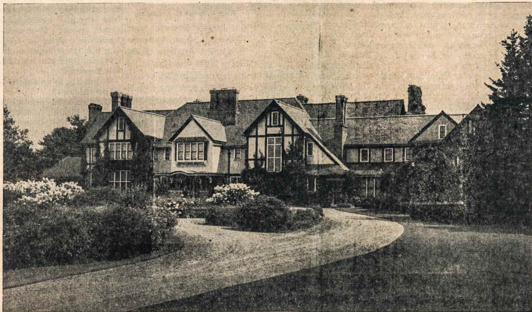
Lietuvos Pranciškonų naujas vienuolynas, kurį jie pirkė rugsėjo 8 d. š. m., Kennebunk, Maine, yra gaisrų srityje. Bandyta susisiekti telefonu, bet nebuvo galima. Taigi kol kas neturime žinių ar vienuolynas apsaugotas nuo ugnies? Žinios paduoda, kad Kennebunkport miestelis, kuris yra visai arti Pranciškonų vienuolyno, sunaikintas. Taipgi Campbell ūkis arti vienuolyno sudegė.

Padarė Milijoninius Nuostolius.- Gaisrininkai, kareiviai ir civiliai žmonės kovoja su ugnimi dieną ir naktį. - Massachusetts valstybėje pavyko gaisrus sukontroliuoti. - Maine valstybėje daugiausia nukentėjo Kennebunkport - Biddeford.