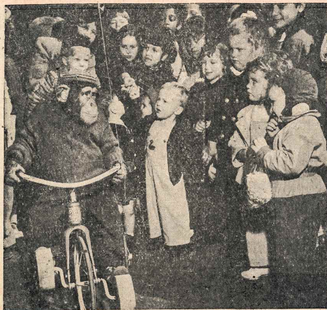
Ši beždžionė, gerai pasistiprinus maistų, New Yorko Central parko zoologijos kieme linksmina vaikučius.

Parapijos choras jau gerai pasiruošęs su vaidinimu operetės "Kuprotas Oželis." Solistai gražiai dainuoja; taipgi vyrų ansamblis gražiai yra pasirėngęs su dainomis, mergaitės su gražiais solais ir duetais. Tikrai bus graži muzikališka puota lapkričio 23, šv. Jurgio parapijos svetainėje, 7, val. vakare. Turėtų šį veikalą visi pamatyti ir išgirsti dainas, nes tokie veikalai nebūna kas dieną. Atmintkite visi lapkričio 23. O.