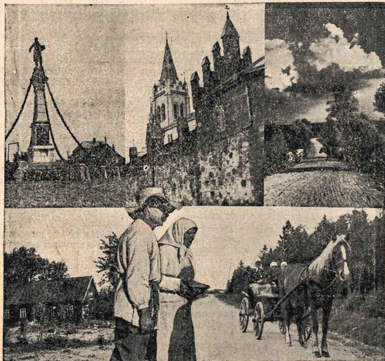
Gražiosios Lietuvos vaizdai: Simano Daukanto paminklas Raseiniuose, Žemaitijos vieškeliai, ramūs žemaičiai.